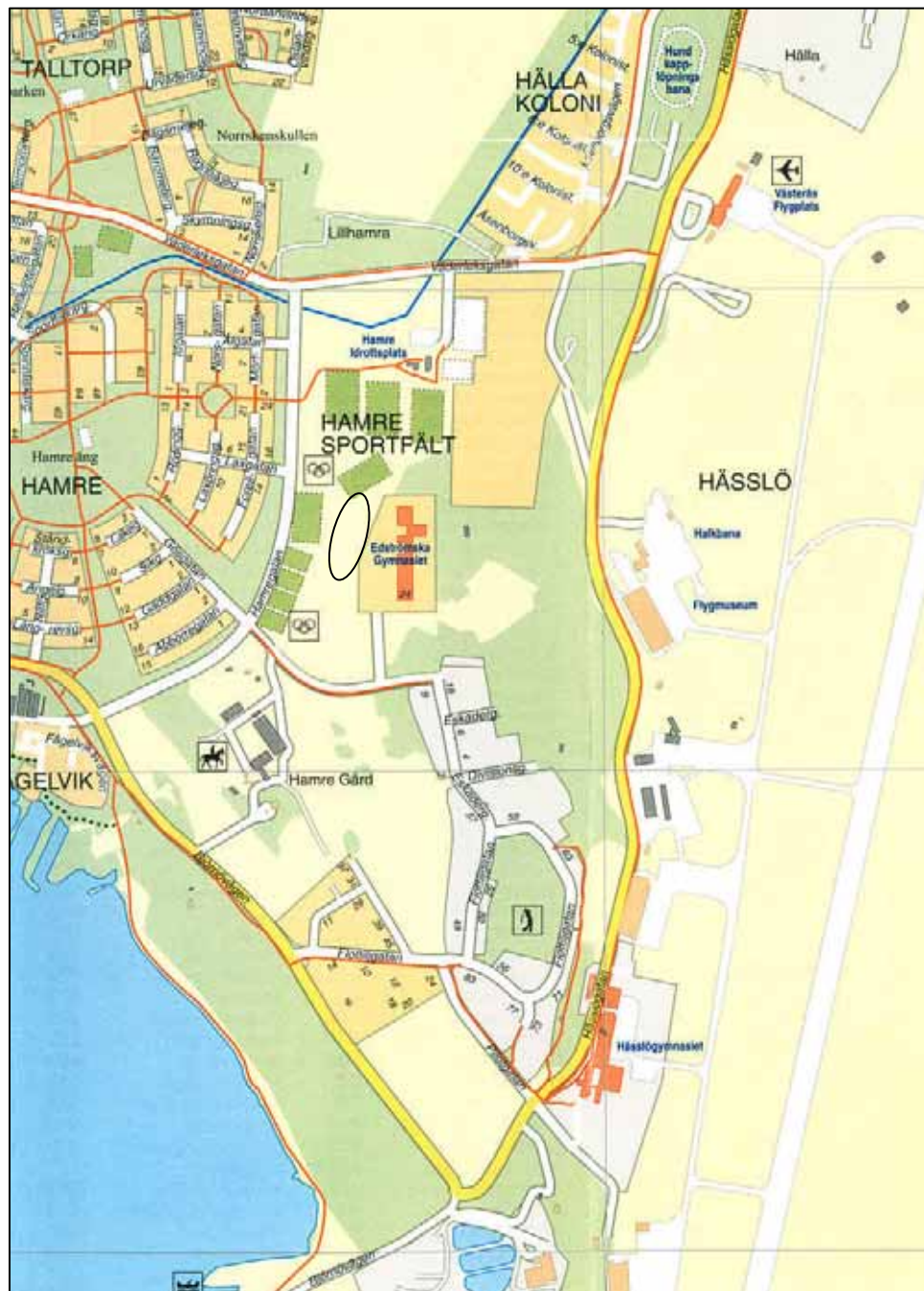
Figur 1. Undersökningsplatsens läge markerat med en oval. Utdrag ur Västeråskartan 2006. Skala 1:15 000.

Kartor ur allmänt kartmaterial © Lantmäteriet Gävle 1998. Dnr 507-99-498.