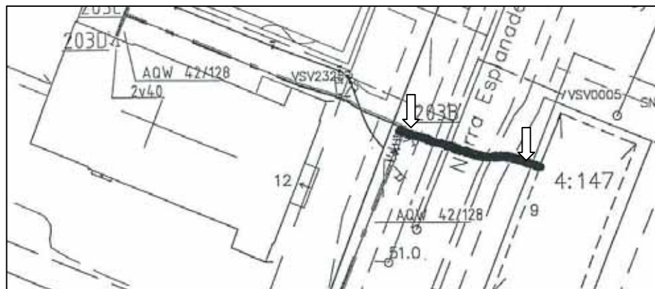
Figur 2. Fjärrvärmeschaktets läge. De grävda schaktavsnittens lägen markerade med pilar. Sträckan över Norra Esplanaden borrades. Skala 1:500.