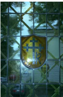
Bildtexter se sidan 11.