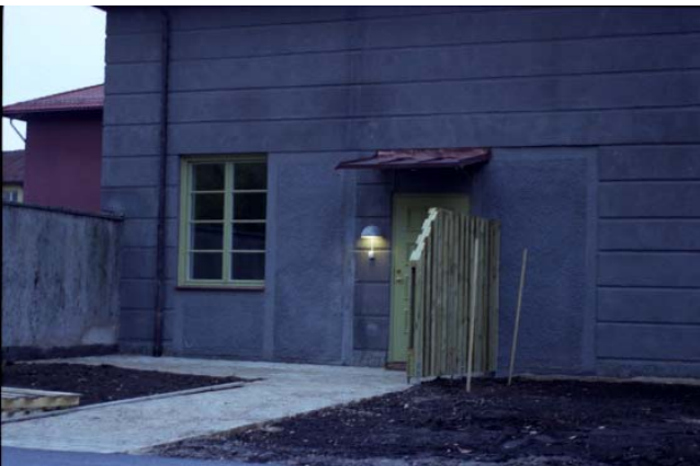
Bildtexter se sidan 11.