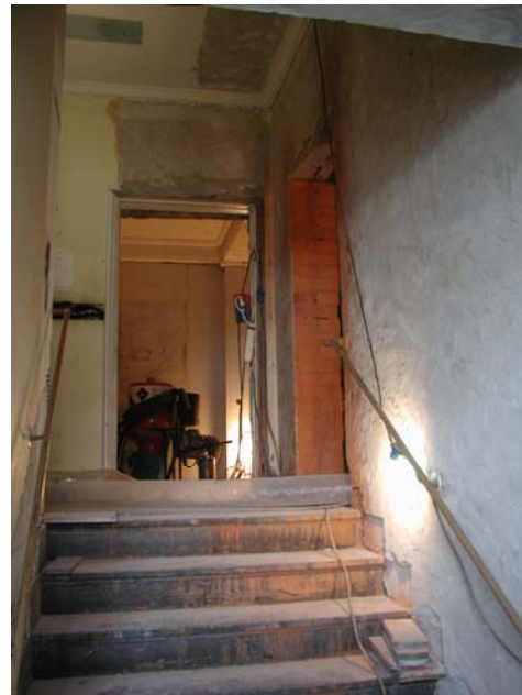
Figur 5, överst t.v. Styrelserummet under renoveringen med tjärstruket tegel som tidigare täckts med paneler. Vägghälsor och parkettgolv ersattes med nytt material.