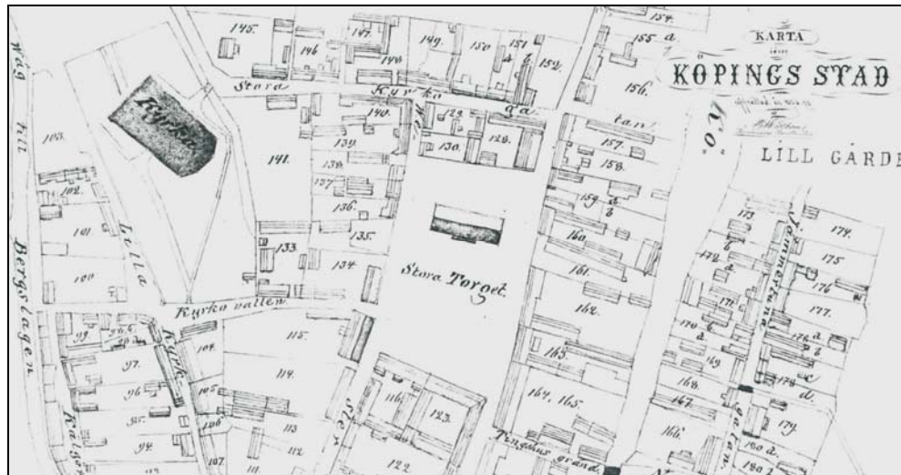
Figur 1. Gamla Sparbankshuset markerat vid Stora Torget på den moderna fastighetskartan.