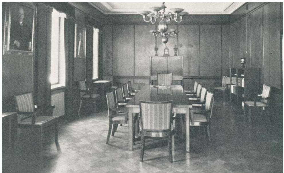
Figur 3. Expeditionssalen, troligen omkring 1945 Kassetaket kan anses. Bilden tagen ur boken Köpings stads sparbank 1845-1945.