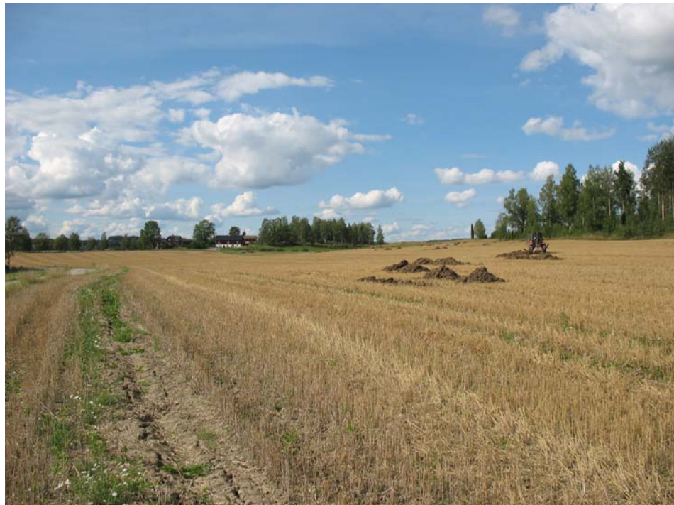
Figur 1. Vy från Område III mot Gillberga by.

Vid utredningen grävdes sökschakt med grävmaskin. Schakten grävdes inom fyra delområden (Område I-IV) vilka motsvarar höglänta plåtåer eller plåtåliknande ytor vilka bedömdes som bra boplatslägen (se figur 2). Dessa områden omfattade även platserna där de tre lösfynden antas ha påträffats. I de för bosättning lämpligaste delarna av dessa områden grävdes schakten med ungefär 6 meters längd och i mer sluttande mindre lämpliga lägen inom områdena grävdes ca 4 meter långa schakt. På och runt en svag förhöjning i den lågt liggande marken grävdes det också 4 meter långa schakt. Schakten grävdes ner till en orörd nivå vilken förekom på 0,2-0,3 meters djup.