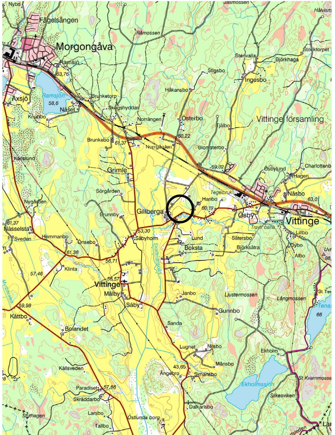
Figur 1. Utredningsområdets läge markerat med en ring. Utdrag ur digitala gröna kartan, blad 11H NV Enköping. Skala 1:50 000.

Kartor ur allmänt kartmaterial ©Lantmäteriet. Ärende nr MS2006/01407.