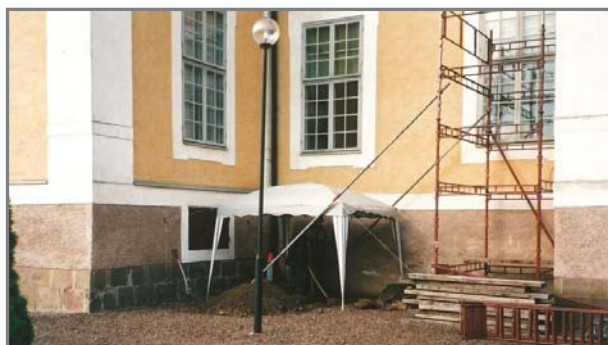
Figur 2. Undersökningsområdet under tält. Trappan kommer att sträcka sig från norra väggen med ställningarna och ner till det blivande fundamentet där tältet står.