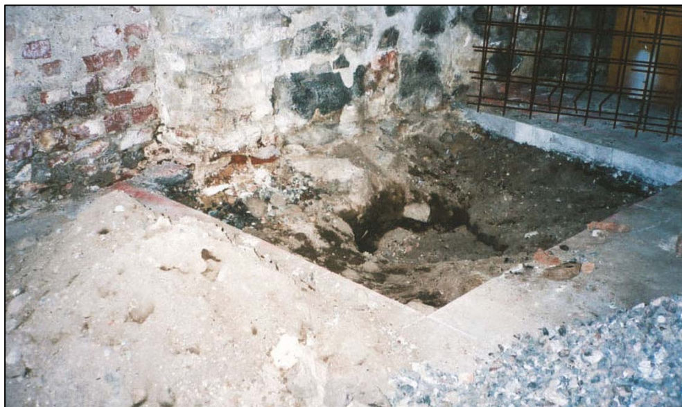
Figur 2. Det uppsågade golvet intill den östra väggen i Stekaren. Okynnesgrävningen skedde i hela schaktets yta men framför allt i centrum där en djupare grop grävdes. Bilden tagen före den antikvariska undersökningen.