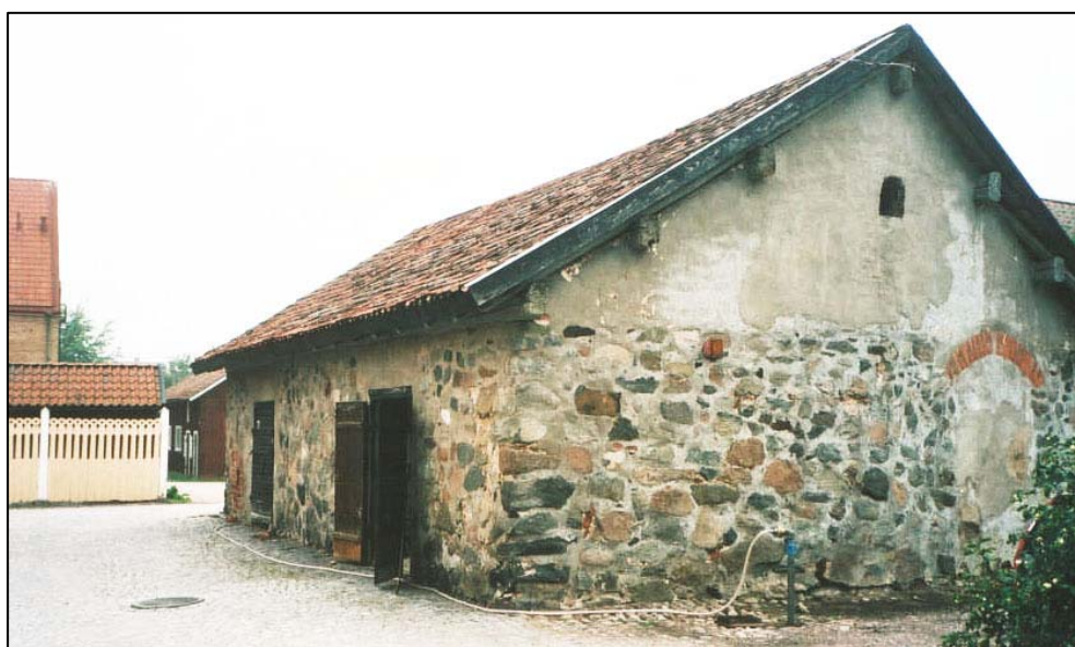
Figur 1. Stekarehuset i Arboga.

Under medeltidsveckan i Arboga 2006 öppnades det medeltida huset Stekaren för enklare servering. Huset höll också på att omgestaltas till en serveringslokal, där bl.a. arbete för en eldstad redan hade påbörjats. I betonggolvet hade en 2 x 1,5 m stort område sågats upp och ett singellager hade tagits bort. Kulturlagret som låg under betongen låg då helt öppet och kunde inte motstås att undersökas av en lokalpatriot som visste allt om Arbogas historia varför delar av de ostörda kulturlagren skövlades. På grund av denna händelse utförde Stiftelsen Kulturmiljövård Mälardalen, genom Ulf Alström, en antikvarisk kontroll av plundringsgropen i Stekarehuset. Arbetet med besiktning och dokumentation utfördes 2006-08-18 och 2006-08-21 efter samråd med Länsstyrelsen i Västmanland. Arbetet bekostades av Arboga kommun.