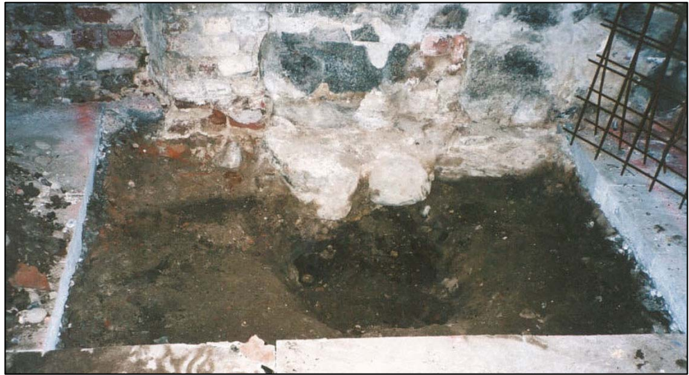
Figur 4. Groppen efter den antikvariska kontrollen. Lösa massor är borttagna och plundringsgropen tömd.