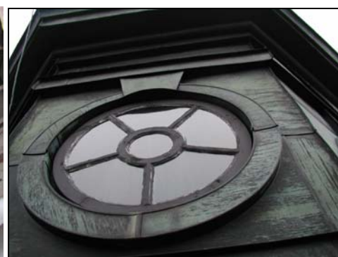
Figur 6, överst t.v. Nederdel av fönsterbåge före renoveringen.