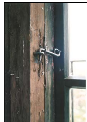
Figur 12, överst t.v. Nyttillverkade bågar. Bågarna tillverkades i två delar lika befintliga. De ytterligare äldre bågarna som förvaras i tornet var hela.