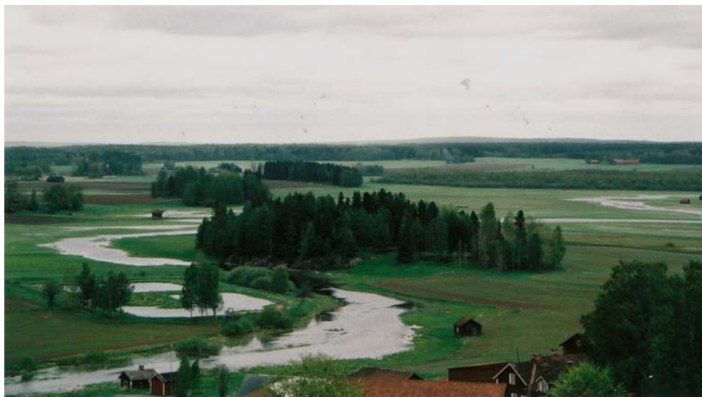
Figur 2. Utsikt från tornet mot Svartån.