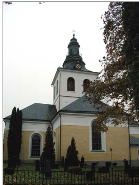
Figur 4. Lanterninen före renoveringen.