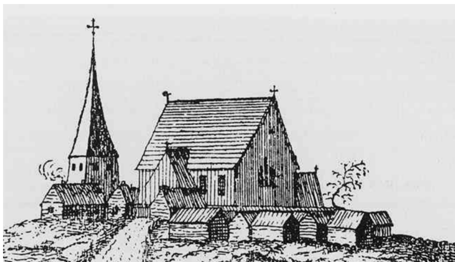
Figur 3. Västerfärnebo kyrka, Illustration ur Olof Grau: Beskrifning öfver Wästmanland .

Västerfärnebo kyrka började troligtvis uppföras på 1300-talet. Eventuellt kan kyrkans dopfont från 1200-talet tyda på att det funnits en föregångare, men inga bevis finns för detta. Omkring 1480 slogs stjärnvalven över långhuset. Troligen såg kyrkan då ut ungefär som den framställs av Olof Grau vid 1700-talets mitt – en gotisk landsortskyrka av gråsten med ett högre sadeltak och utan torn.