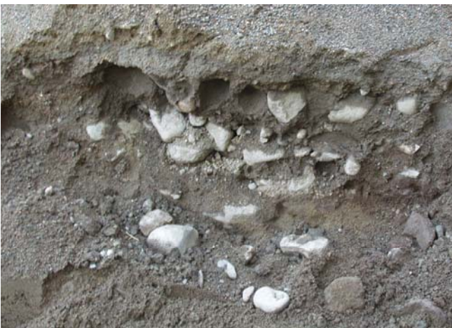
Figur 3. Stenläggningen i den östligaste delen av schaktet. Stenarna i bildens nederkant är nedrasade. Foto mot NV av Kristina Jonsson.