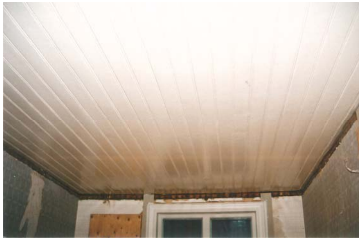
Figur 8: Kökstaket efter ommålning med linoljefärg.