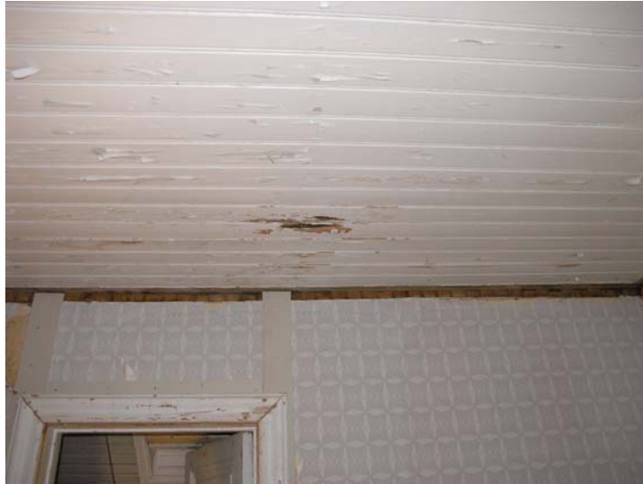
Figur 7: Kökstaket före ommålning. Centralt i bilden syns den skada som visade sig vara mindre allvarlig än befarat.