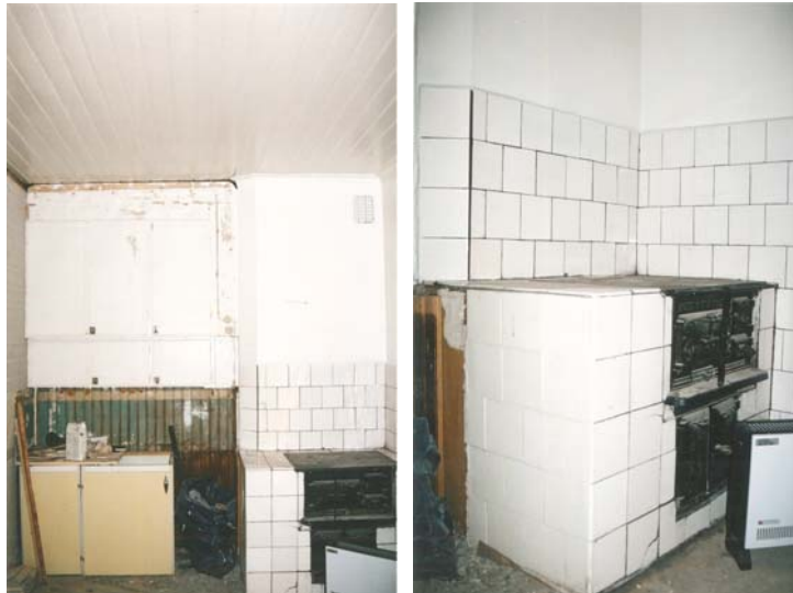
Figur 4: Köket efter åtgärder. Murstocken är åtgärdad, kakel uppsatt kring spisen och murstocken är målad utvändigt.