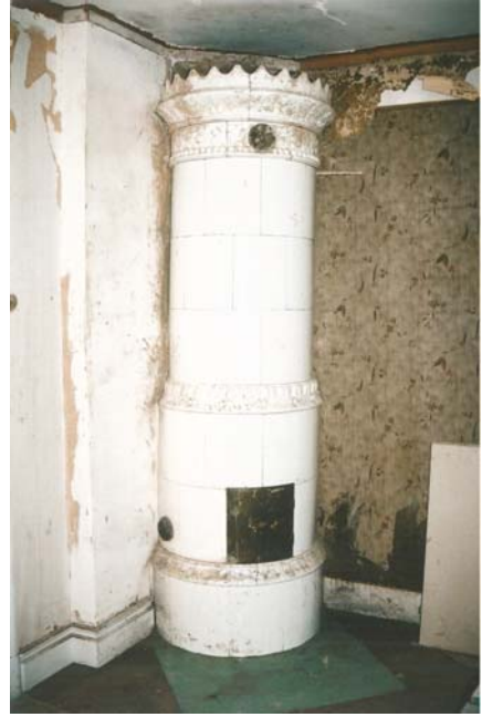
Figur 10. Kakelugnen efter åtgärder.