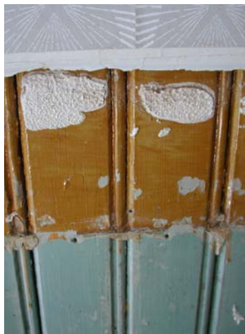
Figur 6 nedan: Spår av björkädring i köket,