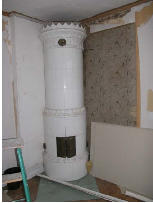
Figur 9: Kakelugnen före åtgärder.