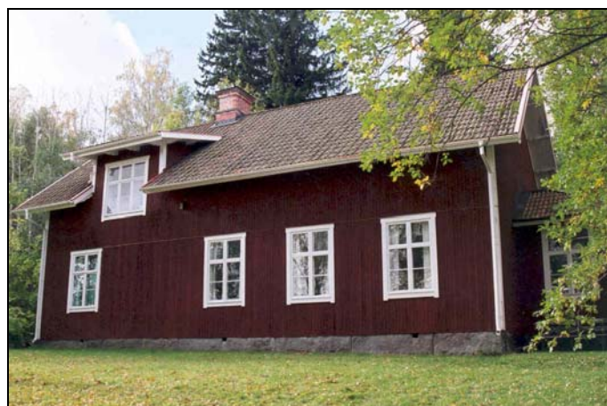
Figur 2: Det gamla Missionshuset i Norr Hårsbäck.