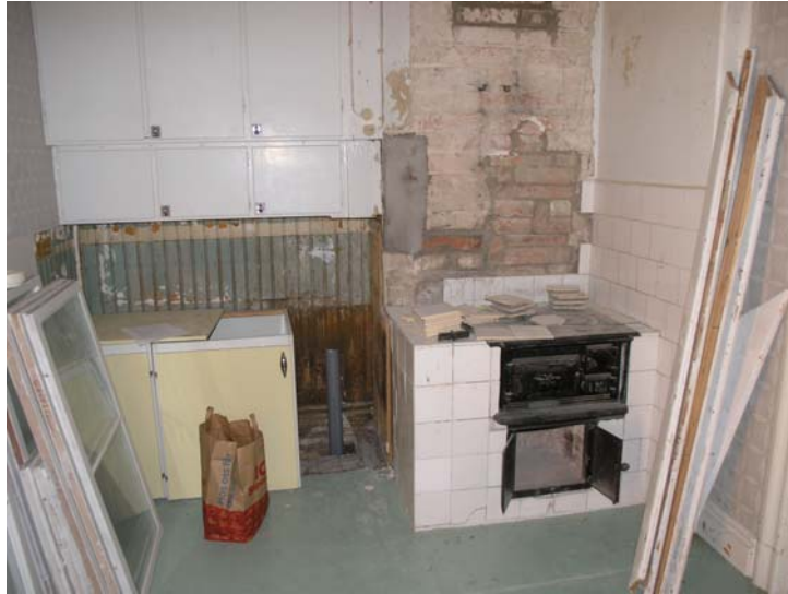
Figur 3: Köket före åtgärderna. Hål har tidigare tagits upp i murstocken, över spisen, för att möjliggöra en rensning av kanalerna från kajbon.