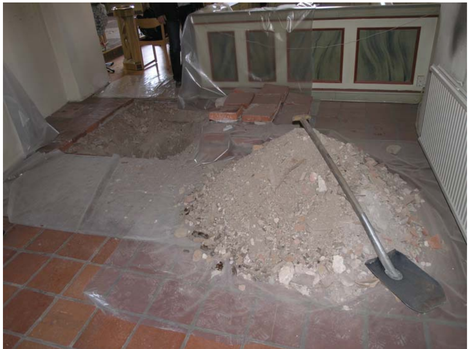
Figur 5. Massor som tagits upp och sedan återfyllts.