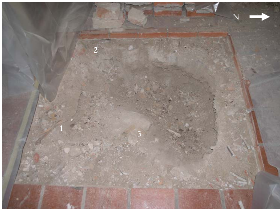
Figur 3. Golvet upptaget.