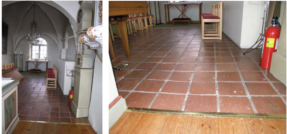
Figur 1. Gravkoret före omläggningen av golvet.