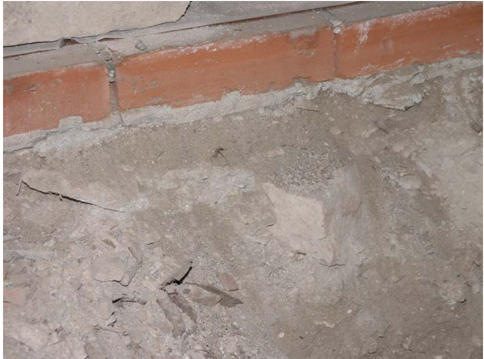
Figur 4. Nuvarande tegelgolv ligger på en kaka av KC-bruk. Teglet är endast fogat högst upp vid ytan.