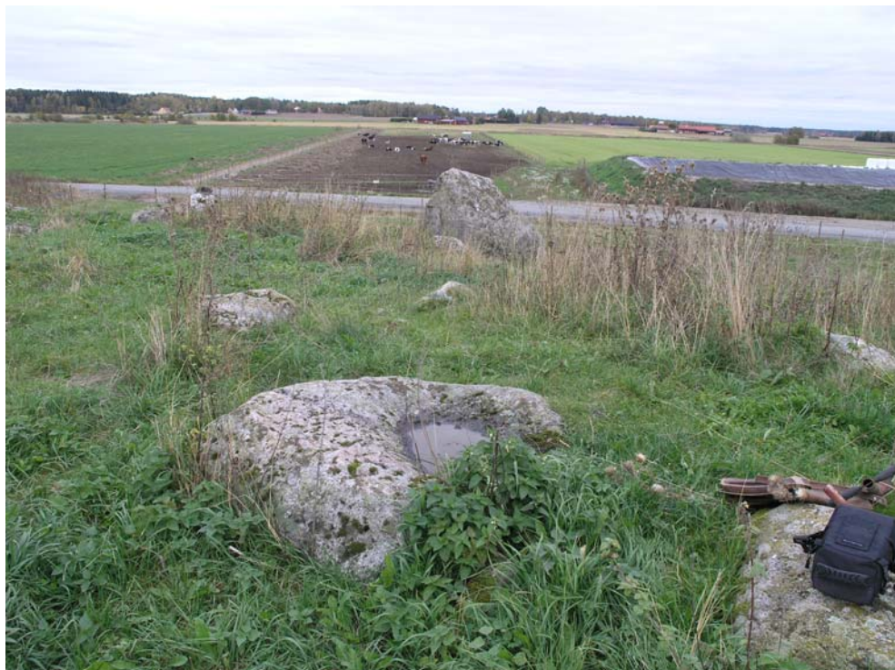
Fig. 3. Malsten? i östra delen av den övergivna bytomten vid Sör Salbo, Västerfärnebo socken.

Inom områdets nordöstra del, närmast söder om smedjan, finns möjligen lämningar efter ytterligare husgrunder. Där finns en rad med sprängda stenar. Dessa är alternativt endast upplagda röjningsstenar. I området, längst åt norr, finns ett flackt röjningsröse. Nära husgrunden nr. 8 är en brunn, som är täckt av en överbyggnad. I områdets centrala del finns en täktgrop och upplagda schaktmassor (se Lihammer 2007; fig. 6).