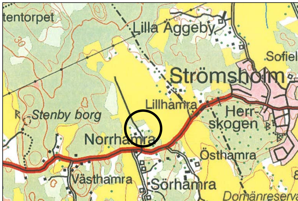
Figur 1. Undersökningsplatsens läge, markerat med en ring. Utdrag ur den digitala gröna kartan, Kartex. Skala 1:20 000.