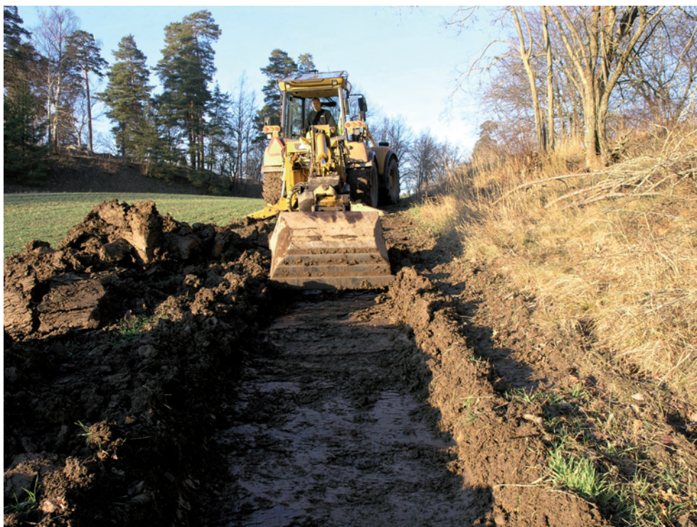
Figur 3. Schaktning på platsen för den planerade rampen som ska läggas mellan den nya parkeringsplatsen och fågeltornet. Till vänster om grävmaskinen syns den del av Strömsholmsåsen där gravfältet RAA 227 ligger. Fotograferat från sydost.

impedimentet. Även här togs ett längre schakt upp. Avslutningsvis grävdes schakt på platsen för det planerade fågeltornet. Då den exakta platsen inte var utmärkt i terrängen lades till början ett schakt omkring 5 meter för långt söderut. När misstaget upptäcktes (tack vare att en polygonpunkt som var markerad på byggplanen framkom i schaktet) togs ytterligare ett schakt upp norr om det första. I det schakt som togs upp utanför utredningsområdet framkom två härdar. Då vi tidigt insåg att schaktet låg för långt söderut lades det igen utan att anläggningarna rensades fram och dokumenterades.