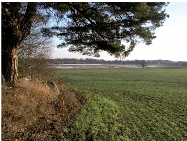
Figur 2. Det planerade fågeltornet ska placeras på impedimentet till vänster i bild. Härifrån har man en bra utsikt över fågellivet i Ladugårdsjön. Bilden är tagen från nordväst.

Länsstyrelsen i Västmanlands län avser att sätta upp ett fågeltorn samt anlägga en parkeringsplats i anslutning till detta inom Strömsholms naturreservat på fastigheten Strömsholm 8:1 i Kolbäcks socken. På impedimentet där fågeltornet ska placeras finns kända fornlämningar i form av två gravar (Kolbäck 382:1 och 384:4). Den 29 oktober 2007 inkom till KM med anledning av detta en begäran om undersökningsplan och kostnadsberäkning för en steg 2 utredning (sökshaktning) från länsstyrelsen. Länsstyrelsens beslut (1st dnr: 431-11767-07) är daterat 2007-11-08. Den särskilda utredningen bekostades av länsstyrelsen med medel från anslaget 28:25/2007 under ärendegruppen Fa 3, länsstyrelsens egenverksamhet.