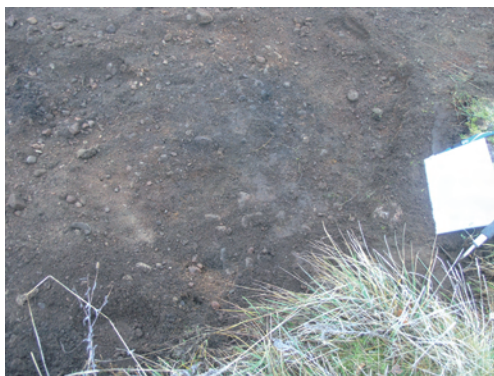
Figur 6. En av de två härdar som återfanns i schakt 6, på platsen där fågeltornet inte är ska byggas.

På impedimentet togs två mindre schakt upp, schakt 5 och 6. I det södra av dessa, schakt 6, som av misstag togs upp för långt söderut (se mer under kapitlet genomförande och metod) påträffades två härdar. Dessa vare sig rensades fram eller dokumenterades mer noggrant då det visade sig att schaktet grävts på fel plats. Vid schaktningen påträffades enstaka fragment bränd lera som sannolikt kan knytas till härdarna.