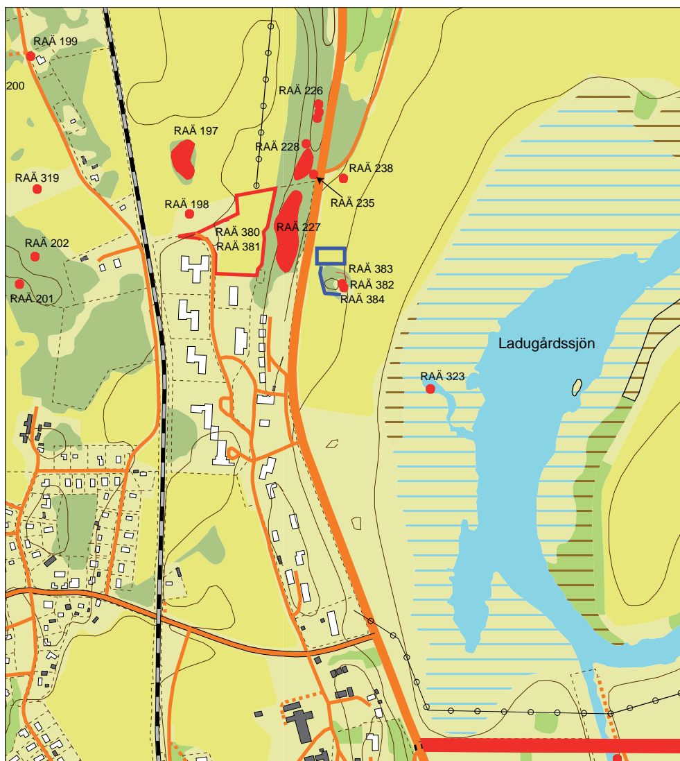
Figur 4. Utdrag ur digitala fastighetskartan (motsvarande blad 11G 0f). Utredningsområdet är markerat med en blå polygon och linje. Registrerade fornlämningar är markerade med rött. Skala 1:10 000.