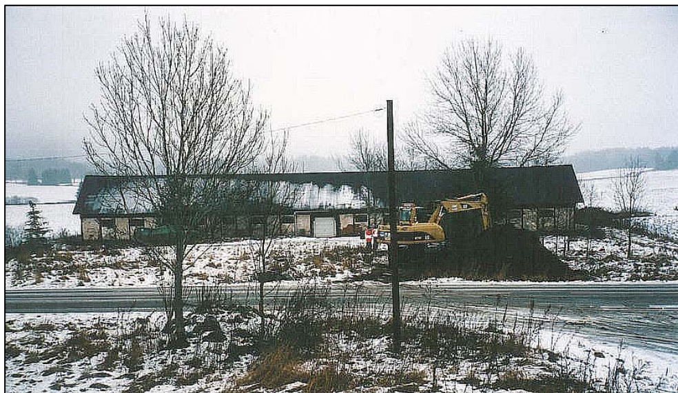
Figur 1. Bortschaktandet av de pålagda jordmassorna på fornlämning 158. Foto från väster.

Målsättningen med arbetet var att schakta bort de pålagda massorna utan att husgrunden skadades. Detta visade sig inte vara något problem eftersom arbetet utfördes av samma personal som lagt på jordmassorna.