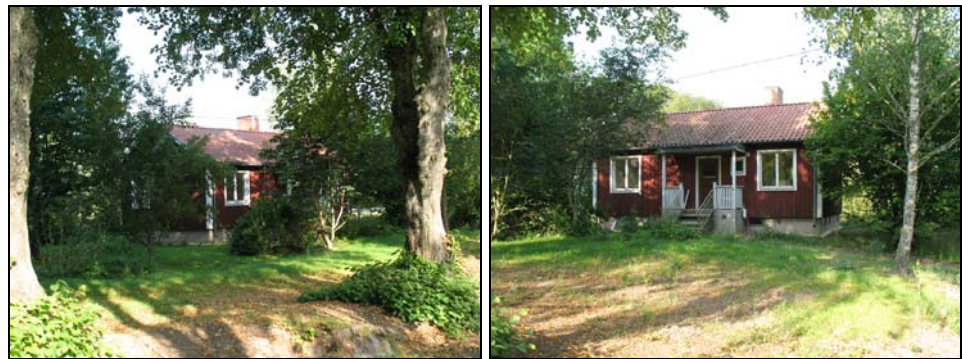
Figur 3. Lilla Hultet inbäddat i grönska före ombyggnaden.