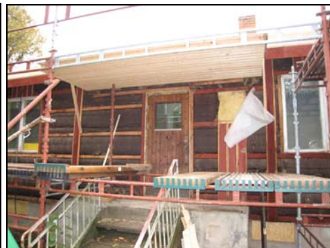
Figur 9. Undertak är omlagt och läkten ny. Foto: Helén Sjökvist. Figur 10. Nytt skärmtak över verandan samt den gamla ytterdörren. Foto: Helén Sjökvist.