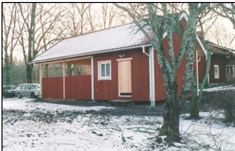
Figur. Ny fönsteromfattning. Foto: Helén Sjökvist. Figur. Nyuppfört garage. Foto: Helén Sjökvist.