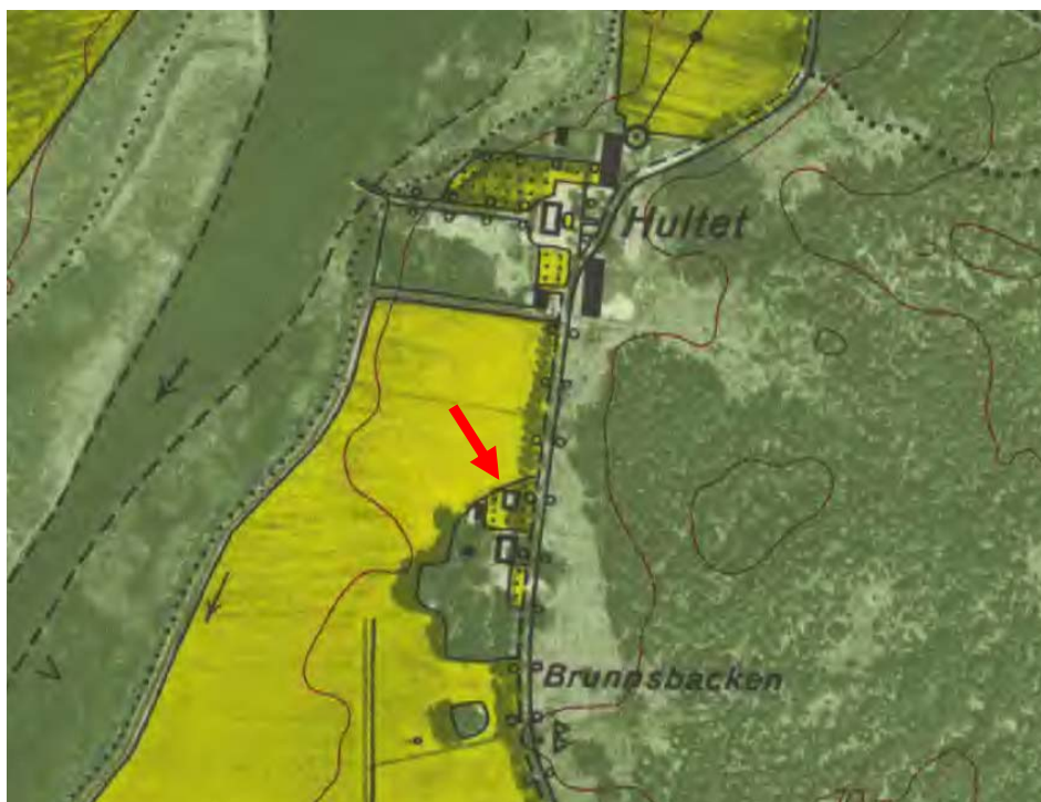
Figur 2. Lilla Hultet markerat med en röd pil på ekonomiska kartan från 1962. Här syns även läget för den gamla ekonomibygnaden.

Området är skyddat som naturreservat sedan 1979. 2 I reservatetsbeskrivningen framhävs det slottspräglade kulturlandskapet med ekar och hästhagar. Lövräden skall gynnas i skötseln men också jordbruket, hästsporten och friluftslivet är viktiga värdebärare. Området ingår också i EU:s nätverk av skyddade områden, Natura 2000.