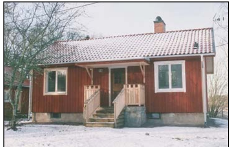
Figur. Tillbyggnaden på västra sidan. Foto: Helén Sjökvist. Figur. Ny veranda. Foto: Helén Sjökvist.