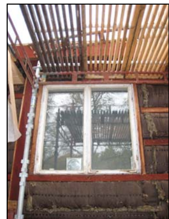
Figur 13. Detalj av hörnjärn på fönster på östra fasaden före renovering. Foto: Helén Sjökvist. Figur 14. Fönster på östra fasaden före renovering. Foto: Helén Sjökvist.