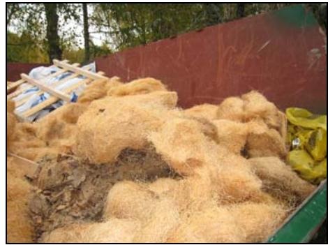
Figur 15. Knutbräda i liv med fasadens panel. Foto: Helén Sjökvist. Figur. Gammal träullsisolering. Foto: Helén Sjökvist.