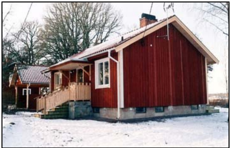
Figur. Interiör i tillbyggnaden efter färdigställandet. Foto: Helén Sjökvist. Figur. Byggnaden sedd från nordöst efter ombyggnaden. Foto: Helén Sjökvist.