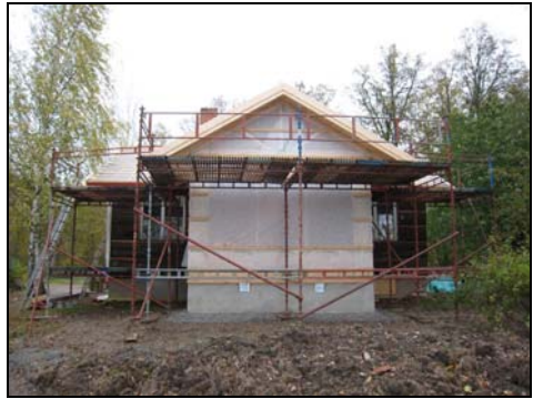
Figur 7. Södra gaveln i samband med renoveringen. Foto: Helén Sjökvist. Figur 8. Utbyggnaden mot väster under uppförande. Foto: Helén Sjökvist.