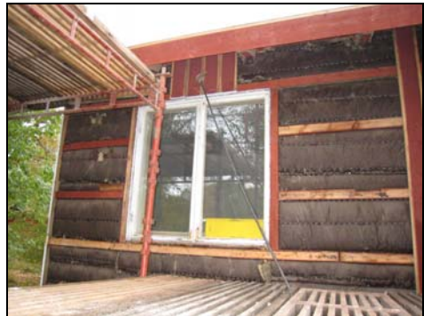
Figur 11. Det gamla trapppräcket och trätrappan. Foto: Helén Sjökvist. Figur 12. Den gamla isoleringen med delvis återanvänd läkt. Foto: Helén Sjökvist.