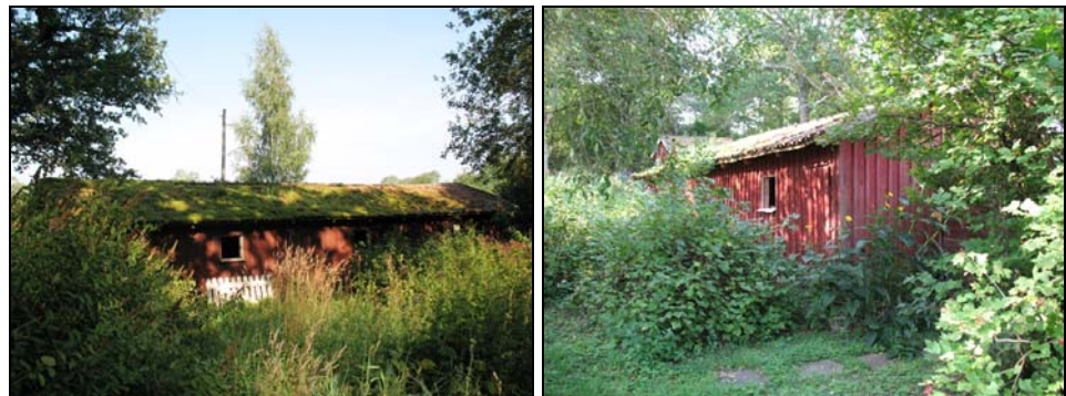
Figur 5. Den gamla utbusbyggnaden före rivning.