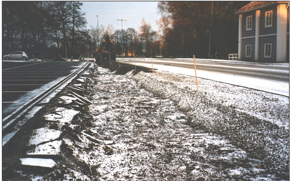
Figur 2. Schaktet mellan planteringsgroparna. Till höger Kungsgatan, till vänster parkeringsytan i kvarteret Bergwerdien

Vid kvarteret Bergwerdiens norra del har en parkeringsplats iordningställt. I samband med detta arbete har ett antal träd planterats i kvarterets nordvästra och nordöstra hörn. I kvarterets nordvästra hörn bestod det övre lagret av 0,4 meter jord. Därefter kom ett 0,1 meter tjockt slagglager. Under slaggen på 0,5 meters djup kom ren lera. I kvarterets nordöstra hörn bestod det övre lagret av 0,6 meter sand. Därefter fanns ett 0,2 meter tjockt lager med slagg. Slagglagret låg på ren lera. Inga spår efter byggnader eller brandlager påträffades i groparna. Utifrån resultatet i denna mycket begränsade undersökning kan man med försiktighet tolka bristen på arkeologiska lämningar till att det förmodligen inte fanns några byggnader på denna begränsade yta när 1736 års brand drog fram över staden.