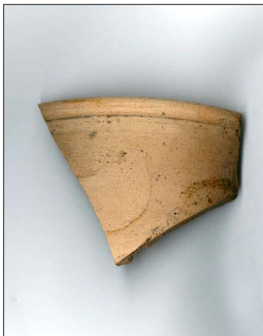
Figur 2. Stengodsskärvan från kvarteret Stadsträdgården.

Endast ett fynd påträffades i schakten, nämligen en stengodsskärva med sentida datering. Skärvan avbildades och slängdes