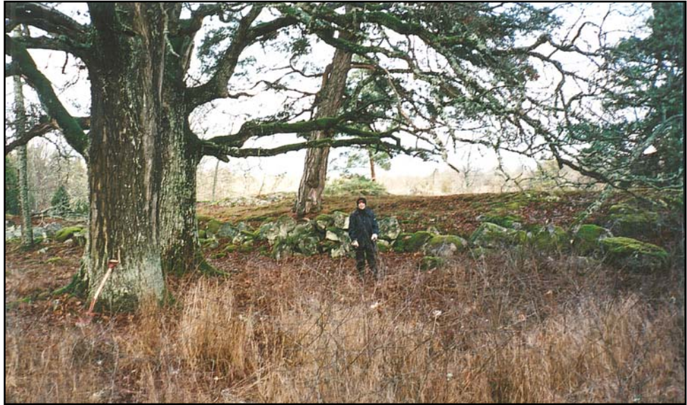
Figur 4. Del av muren till tegelladan. En numera anseilig ek har sedan länge växt inne i stengrunden.

Öster om tegelladan finns rester efter två tegelugnar. Den ena är 9 x 9 meter stor och två meter djup med öppningen i öst. Den andra är 10 x 6 meter stor och 2 meter djup med öppningen i väst. Begreppet djup används för att båda ugnarna är ingrävda i naturliga moränslänter. I området för tegelugnarna finns mängder med krossat tegel. En par större tegelfragment där längd bredd och tjocklek på teglet kunde mätas visar på samma storlek som teglet i Ängsö kyrka. Här kan man erinra om att kyrkan började byggas på 1340 talet (Hammarskiöld 2005, Nisbeth okänt tryckår). Om ugnarna är från den tiden vet vi däremot inte.