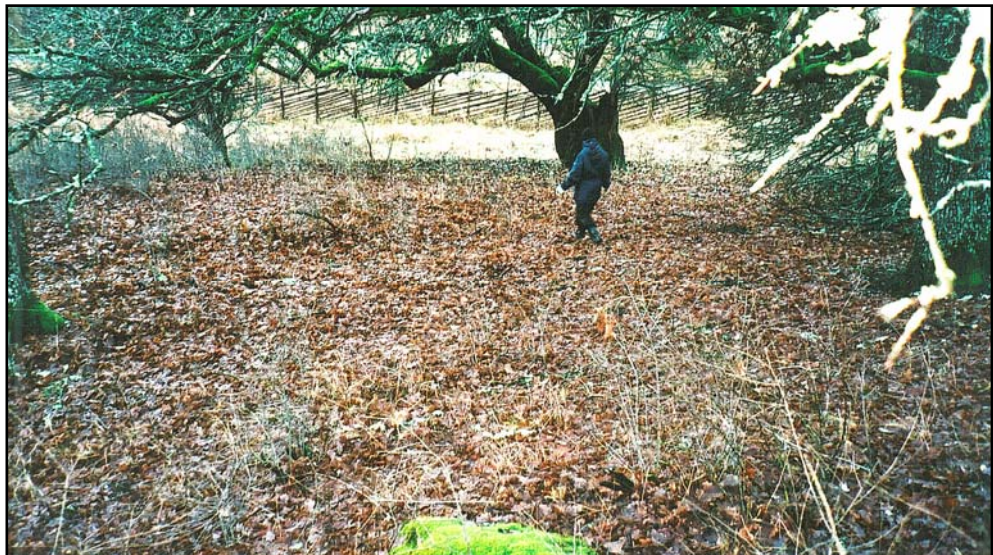
Figur 3. Den plana ytan intill den tänkta placeringen av spången vid gårdesgården som skymtar i bakgrunden.

Enligt Länsstyrelsens önskemål har tre mycket små provgropar grävts i området. I den plana ytan som ligger intill den tilltänkta rampens placering grävdes tre små undersökningsgropar för hand. Dessa var 0,5 x 0,5 meter stora. Den plana ytan som är cirka 14 x 15-20 meter stor har i ytan ett 0,2-0,3 meter tjockt matjordslager. Ytan är bevuxen med ekar och äppelträd som har en anseelig ålder. Ytan är en utmärkt plats för en kålgård för tegeltorpets innevånare där den ligger i skyddat söderläge nedanför en mindre bergrygg. Direkt under matjordslaget kom sjöbottenavlagringar i form av sandig lera.