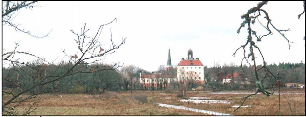
Figur 2. Ångsö slott från höjdryggen med tegeltorpet, torkladan och tegelugnarna.