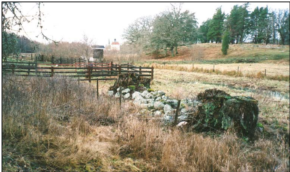
Figur 7. Platsen för bryggan 4 december 2007.

Som figurerna 6 och 7 visar har egentligen inte mycket förändrats i området. Kanalen in till slottet finns kvar men att lägga till med en liten båt vid platsen för bryggan går inte längre. Under de 215 år som förflutit mellan bilderna har huset på bryggan försvunnit. Istället har ett pumphus(?) tillkommit.