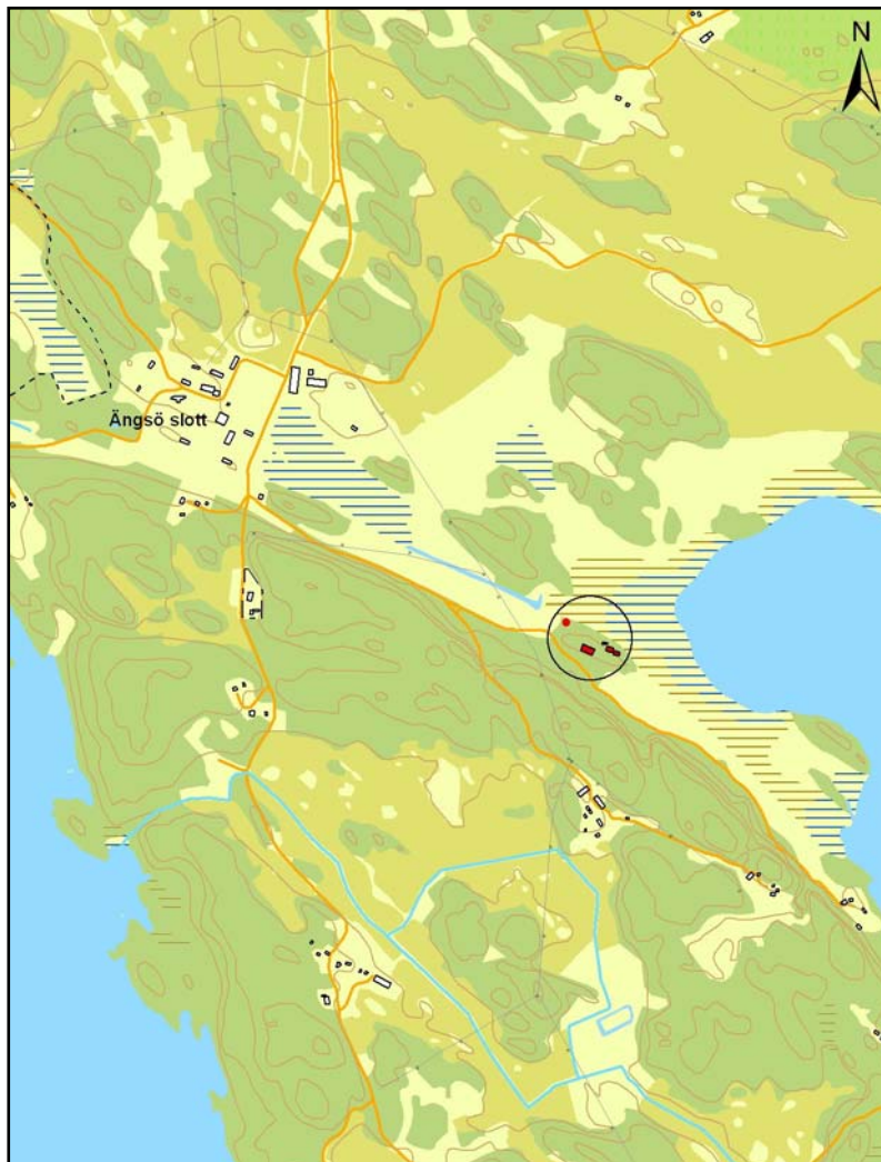
Figur 9. Området med tegelugnar, torklada, busgrund samt bryggfundament i förhållande till Ångsö slott. Skala 1:20 000. (Inmätningar och karta Jan Åhlström.)