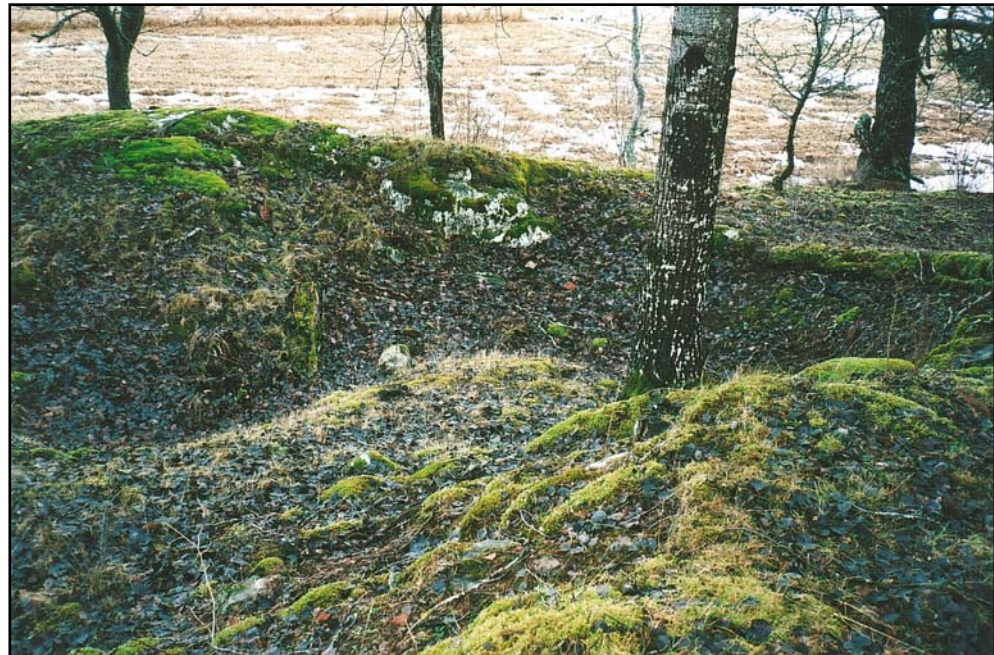
Figur 5. De kvarvarande resterna av en av tegelugnarna. I bakgrunden vårmarken som har varit farbar när tegeltillverkningen skedde. Till höger utanför bilden ligger idag Mälarens vattenspegel och till vänster utanför bild ligger slottet och kyrkan på någon kilometers avstånd.

Öster om tegelladan finns rester efter två tegelugnar. Den ena är 9 x 9 meter stor och två meter djup med öppningen i öst. Den andra är 10 x 6 meter stor och 2 meter djup med öppningen i väst. Begreppet djup används för att båda ugnarna är ingrävda i naturliga moränslänter. I området för tegelugnarna finns mängder med krossat tegel. En par större tegelfragment där längd bredd och tjocklek på teglet kunde mätas visar på samma storlek som teglet i Ängsö kyrka. Här kan man erinra om att kyrkan började byggas på 1340 talet (Hammarskiöld 2005, Nisbeth okänt tryckår). Om ugnarna är från den tiden vet vi däremot inte.