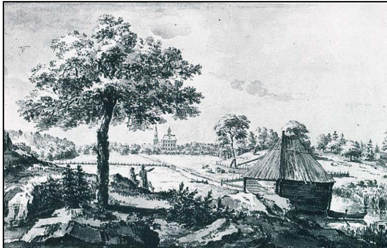
Figur 6. Platsen för bryggan 8 juli 1792. Då fanns en byggnad på bryggan. (Bild från Piper 1997.)

Frakten av råmaterial och färdigt tegel bör till en del ha skett vattenvägen. Strax nordväst om platsen för tegelladan och ugnarna finns därför mycket riktigt ett bryggfundament kvar som visar att vattentransport av tegel kan ha skett från platsen. På en bild från 1792 finns platsen för bryggan avbildad. Då fanns en knuttimrad byggnad på bryggfundamentet.