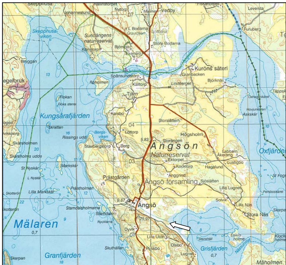
Figur 10. Pilen markerar höjdryggen där platsen för tegelortet, tegelugnarna, torkladan samt bryggfundamentet är belägna. Topografiska kartan. Skala 1:50 000.