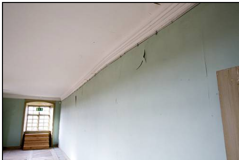
Figur 31. Galleriet med löst sittande microlite på väggar.