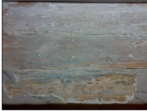
Figur 14. Färgspår under oljespackel.