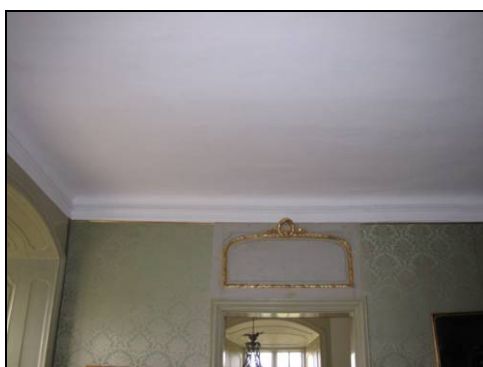
Figur 3. Armfeldtska rummet med delvis nedfallen, delvis nedriven microlite.