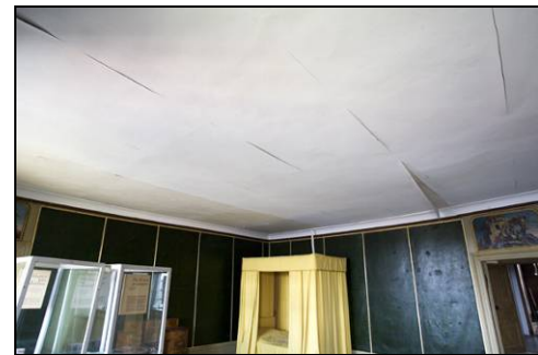
Figur 27. Sovrum på fjärde våningen före åtgärder.