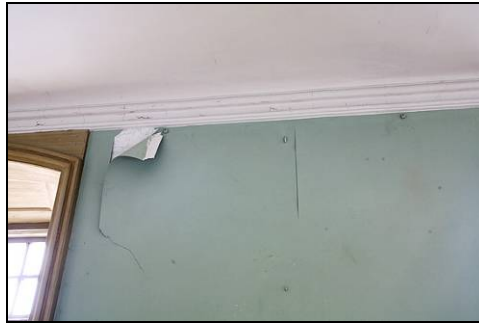
Figur 30. Galleriet med löst sittande microlite på väggar och i tak.