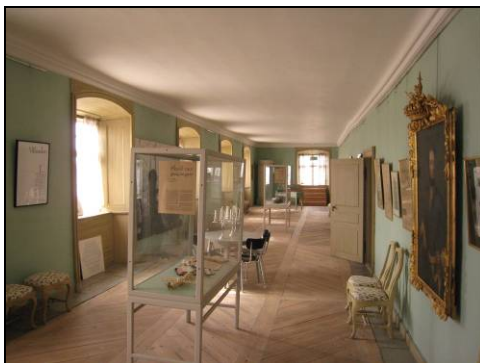
Figur 34. Galleriet på fjärde våningen, tak och väggar åtgärdade.