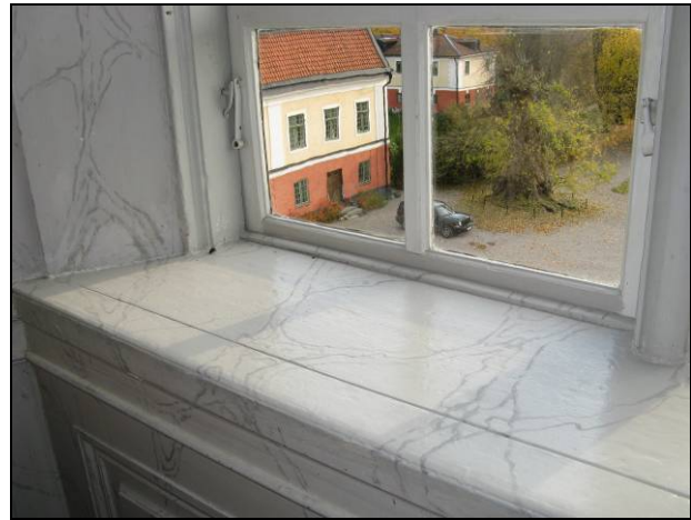
Figur 17. Fönsterbänken färdigmålad.