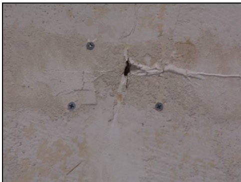
Figur 10. Exempel på spricka som säkrats med gipsskruv.