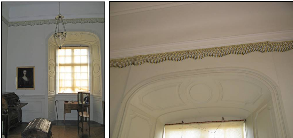
Figur 22. Hörnrummet efter åtgärder.