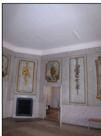
Figur 6. Balsalen, lossnad microlite i taket.

Ommålning genomfördes med en platsbruten linoljaefärg i samma kulör som den befintliga. Endast större skador ilagades med oljespackel. Pigmentering gjordes med zinkvitt, grå umbra och guldockra. Även den marmoreringsmålning som finns i nischerna kopierades.