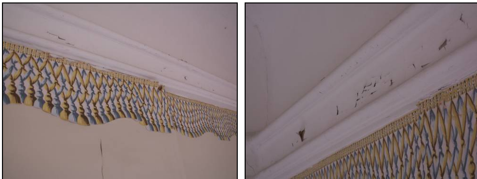
Figur 20. Skadad bård och färgsläpp vid hålkäl.