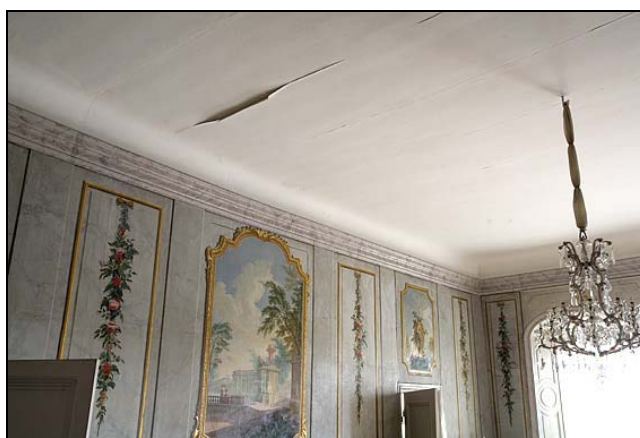
Figur 7. Balsalen, lossnad microliteväv i taket.