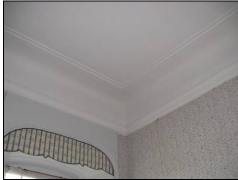
Figur 24. Brita Bååths rum efter åtgärder.