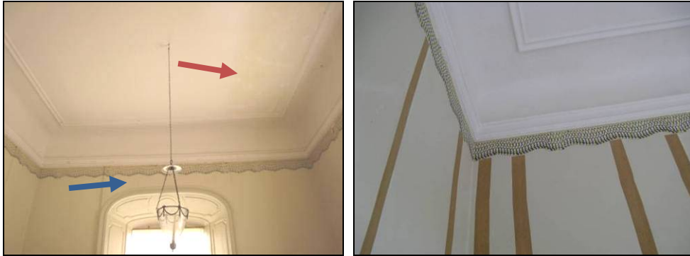
Figur 18. Gavelrummet på tredje våningen. Röd pil markerar nedfallen microlitevåd. Blå pil markerar lossnad tapetvåd.