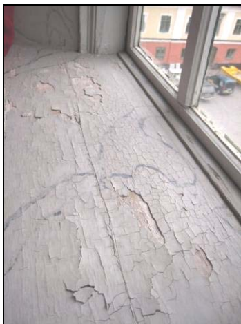
Figur 12. Balsalen, mycket svårt skadat måleri på fönsterbänk.