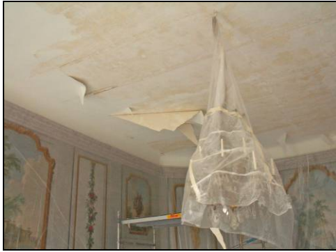
Figur 8. Nedrivning av microliteväv.