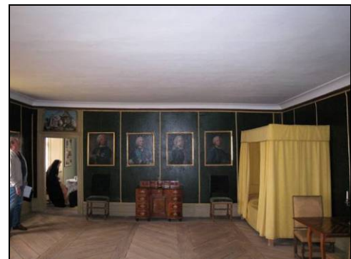
Figur 29. Sovrum på fjärde våningen. Taket åtgärdat.