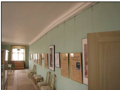
Figur 33. Galleriet med åtgärdat tak och väggar.