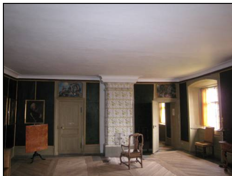
Figur 28. Sovrum på fjärde våningen. Taket åtgärdat.