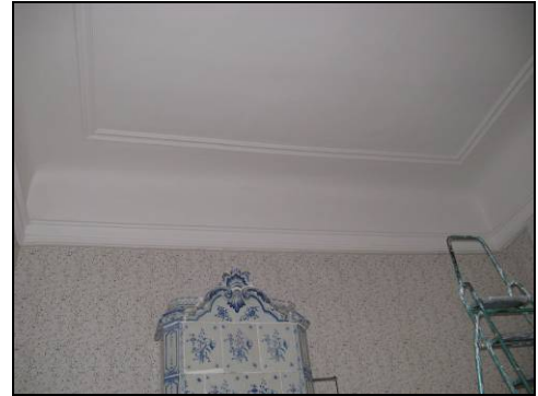
Figur 25. Brita Bååths rum efter åtgärder.