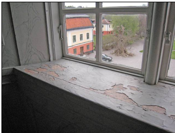
Figur 13. Balsalen, mycket svårt skadat måleri på fönsterbänk.