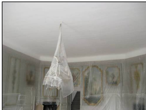
Figur 11. Balsalens tak efter åtgärder.