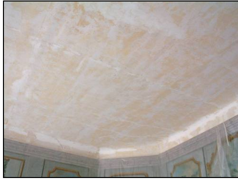
Figur 9. Microliten borta från taket.