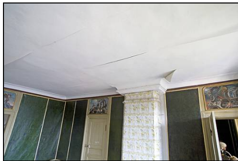
Figur 26. Sovrum på fjärde våningen före åtgärder.

I sovrummet på fjärde våningen har microliteväven tagits ned helt då två våder redan fallit ned av sig självt. Små putslagningar i taket har genomförts med gips. Taket har målats med en platsblandad cellulosalimsbaserad limfärg med tillsats av 20% Wibo emulsionsfärg.