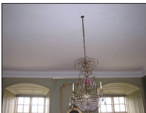
Figur 4. Armfeldtska rummet efter åtgärder.