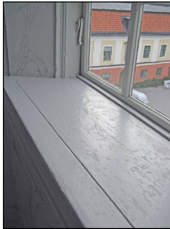
Figur 16. Balsalen, fönsterbänken renskräpad och grundad med linoljefärg.