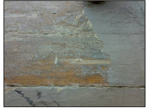
Figur 15. Färgspår under oljespackel.