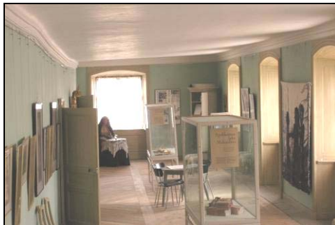
Figur 32. Galleriet med löst sittande microlite på väggar och i tak. Foto: Jan Gustafsson.