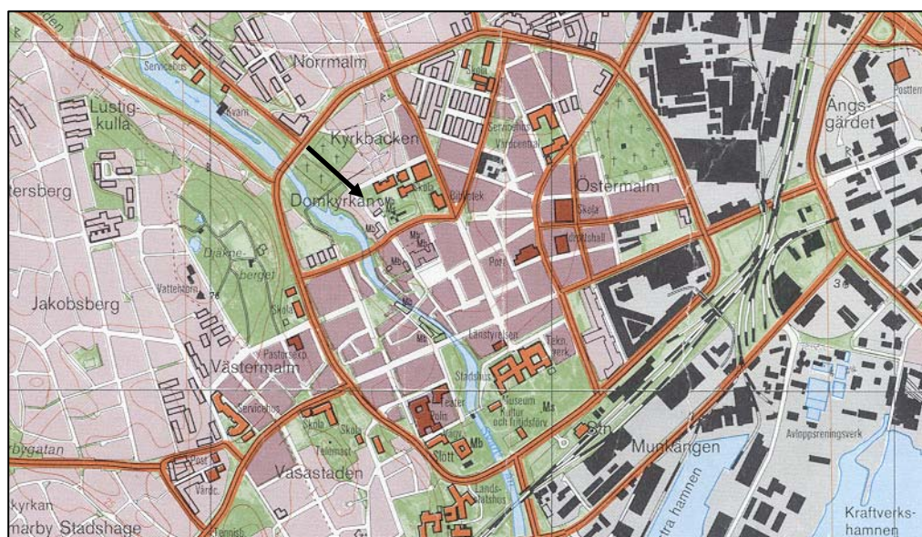
Figur 2. Undersökningsområdet markerat med en pil. Ekonomiska kartan. Skala 1: 20 000.