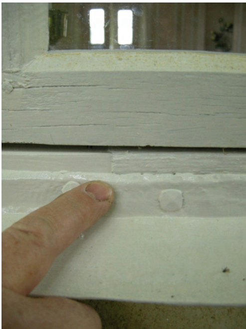
Figur 16. Ilagning av trä i fönsterkarmens underkant.