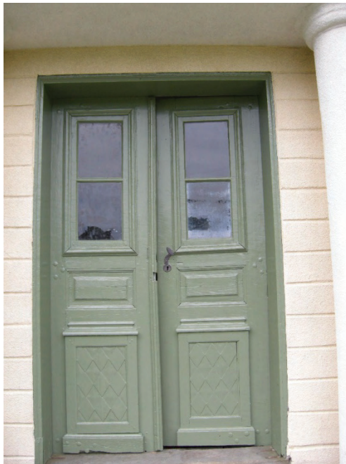
Figur 17. Dörrens färgsättning efter restaurering.

Dörrbladet har rensats från färgrester mekaniskt. Den har grundats med Engwall & Claesson äkta linoljefärg utspädd med 25% balsamterpentin. Mellanstrykningen var utspädd med 10% balsamterpentin och slutstrykning skedde med utspädd färg (figur 17). Referensytor har sparats.