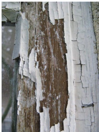
Figur 14. Flagande färg på fönsterbåge.

Fönstren har grundats med Engwall & Claesson äkta linoljefärg utspädd med 25% balsamterpentin. Därefter återmonterades glaset och kittades med äkta linoljekitt. Mellanstrykningen var utspädd med 10% balsamterpentin och slutstrykning skedde med utspädd färg. Referensytor har sparats.