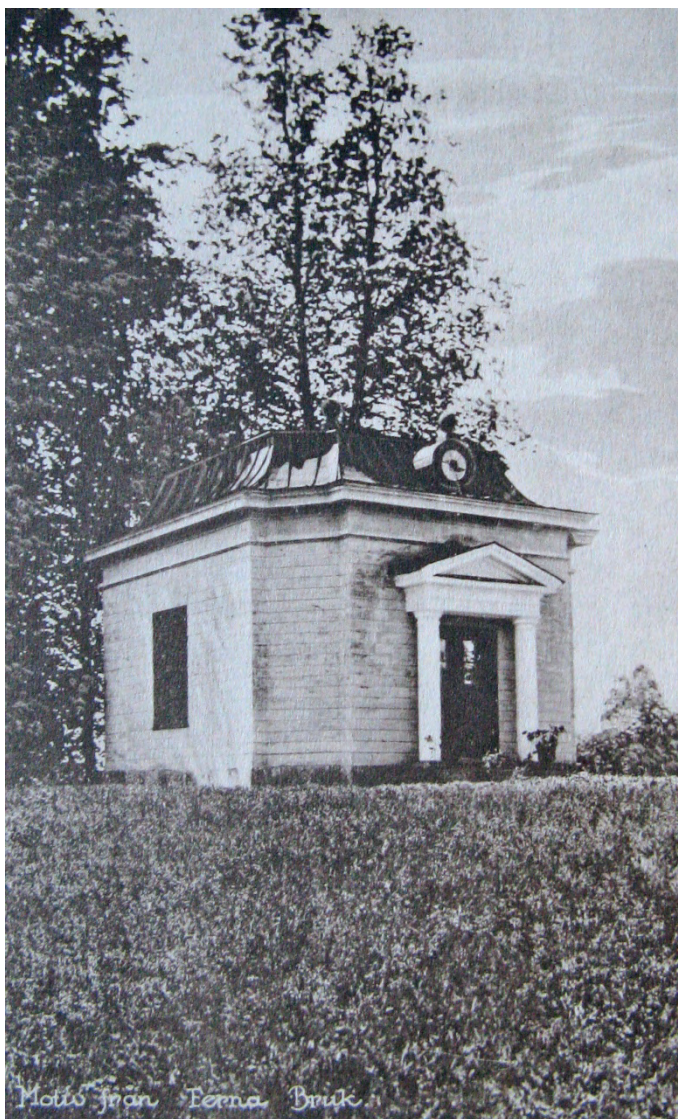
Figur 5. Lusthuset vid färna herrgård.

Av 1858-års karta att döma hade en trädgård även etablerats norr om huvudbyggnaden vilken gick under benämningen "Lilla trädgården" (figur 8). Den äldre delen söder om huvudbyggnaden gick under benämningen "Stora trädgården".