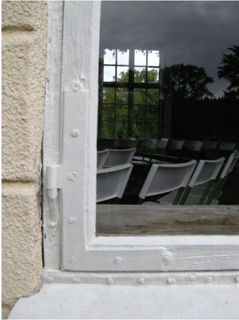
Figur 15. Detalj av fönsterbåge med beslag efter restaurering.