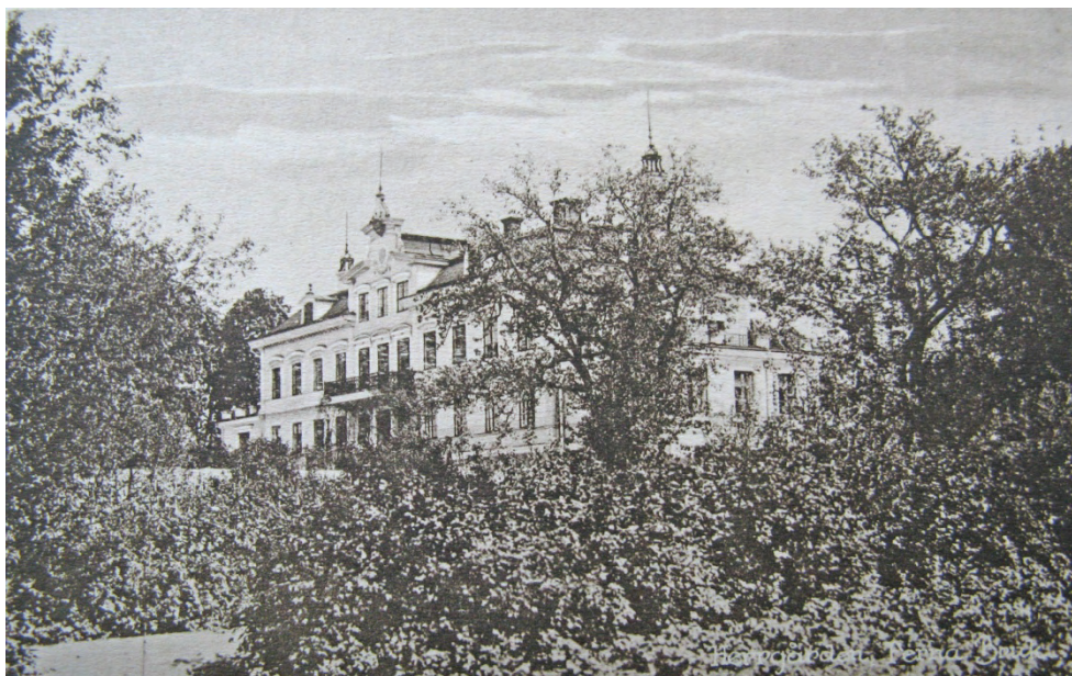
Figur 2. Färna herrgård sedd från trädgården under tidigt 1900-tal.

Huvudbyggnaden är uppförd på 1770-talet men har genomgått stora förändringar under 1800- och 1900-talen. 3 Främst en stor ombyggnad 1857 innebar att träfasaden ersattes med en ljus gulputsad fasad med vita fasaddekorationer enligt tidens ideal (figur 2). Flygelbyggnaderna tillkom omkring år 1800.