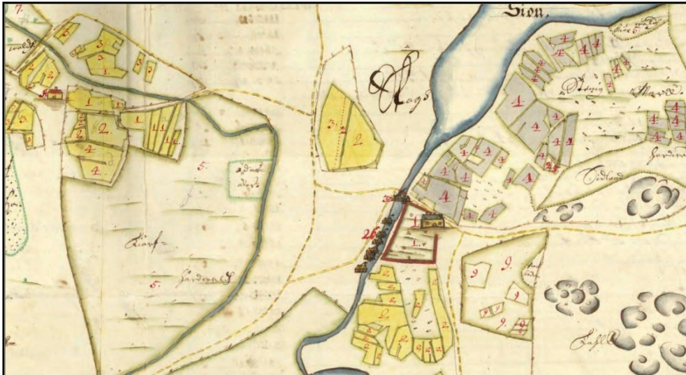
Figur 6. Karta över Färna 1696.