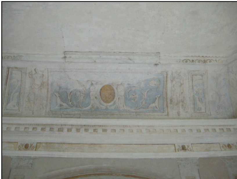
Figur 19. Retucherade takmålningar efter konservering.