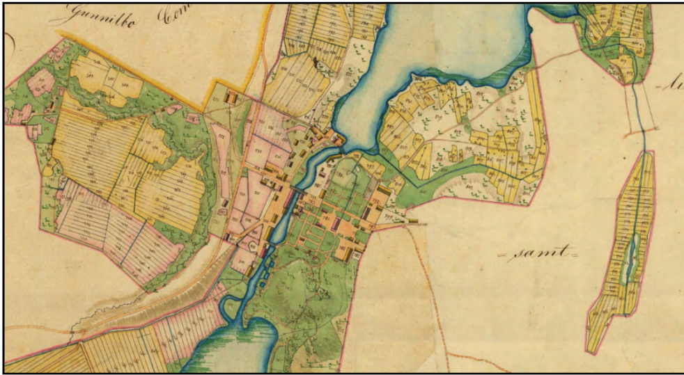
Figur 8. Karta över Färna 1858.