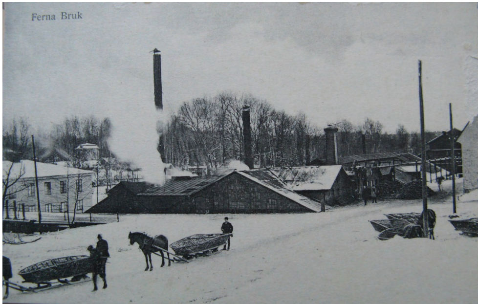
Figur 3. Färna bruk omkring sekelskiftet.