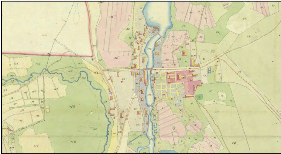
Figur 7. Karta över Färna 1816.