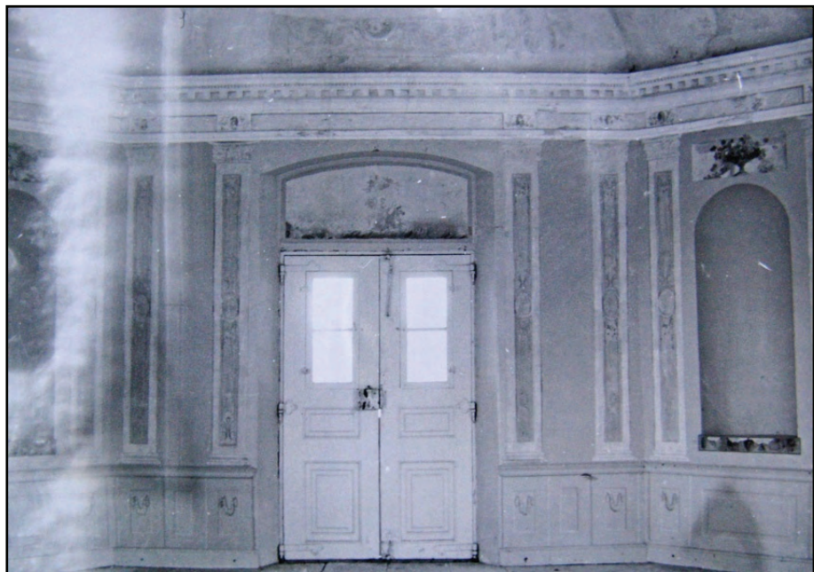
Figur 11. Foto av interiören mot norr, möjligen i samband med 1970-tals renoveringen.