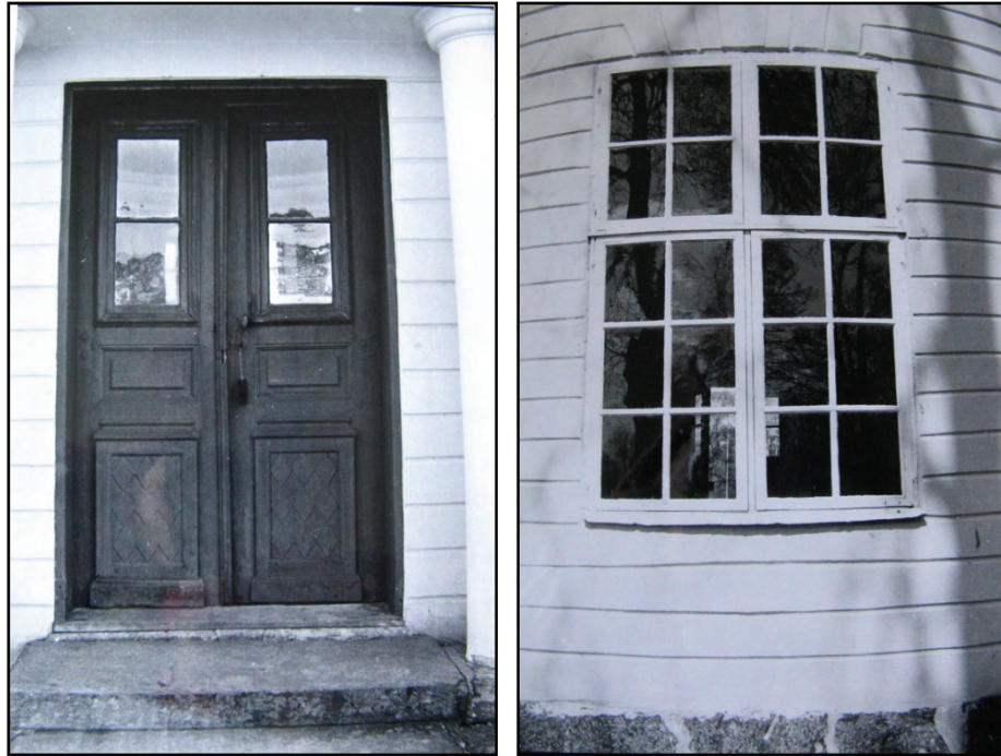
Figur 9. Foto av entrédörren, möjligen i samband med 1970-tals renoveringen. Foto: VLM arkiv. Figur 10. Foto av södra fönstret, möjligen i samband med 1970-tals renoveringen. Foto: VLM arkiv.

I läns museets arkiv finns ett antal bilder som tagits av studenter vid KTH. Fotograf och årtal är inte angivet men det skulle kunna röra sig om 1970-talet, då lusthuset genomgick en exteriör renovering då fasaderna stänkrputsades med för tiden moderna material.