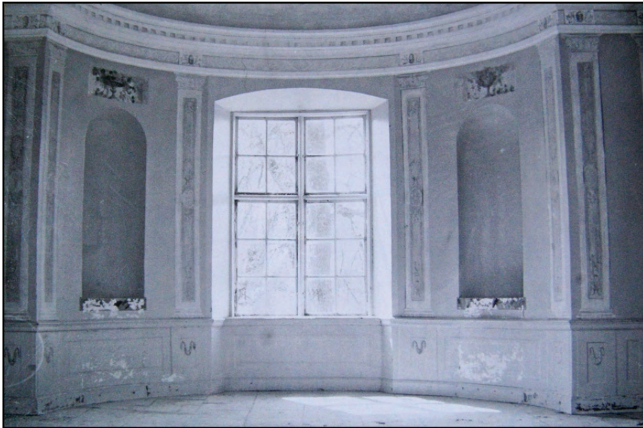
Figur 12. Foto av interiören mot söder, möjligen i samband med 1970-tals renoveringen. Jämför putsbortfall i nischerna med dagens läge vilket redovisas på figur 13.