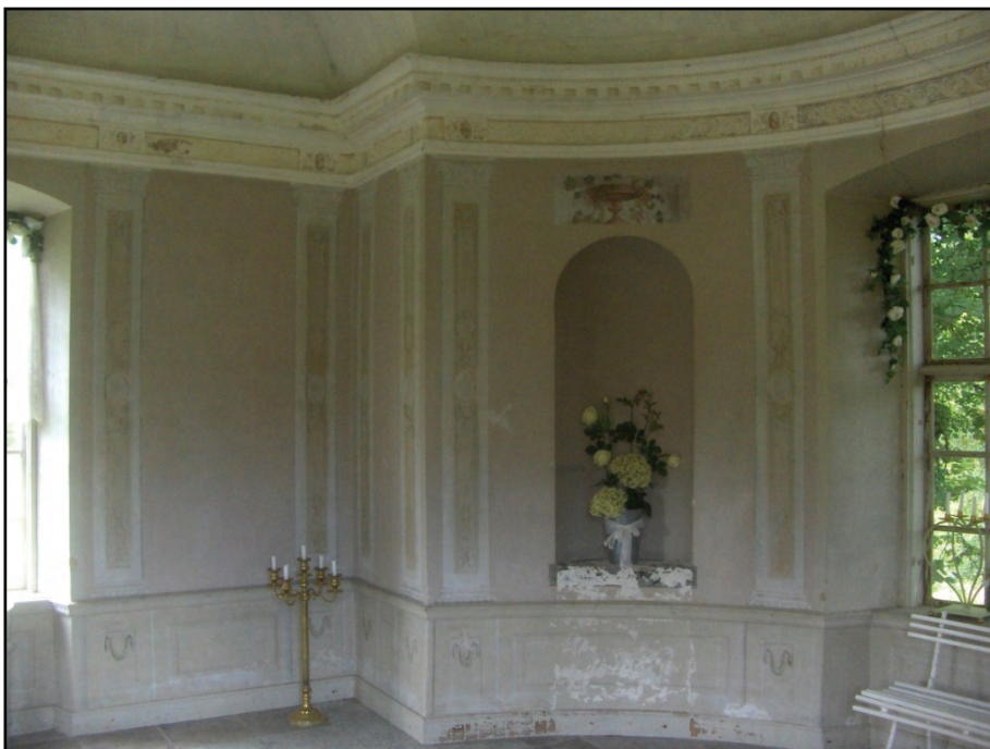
Figur 13. Foto av interiören innan konservering.