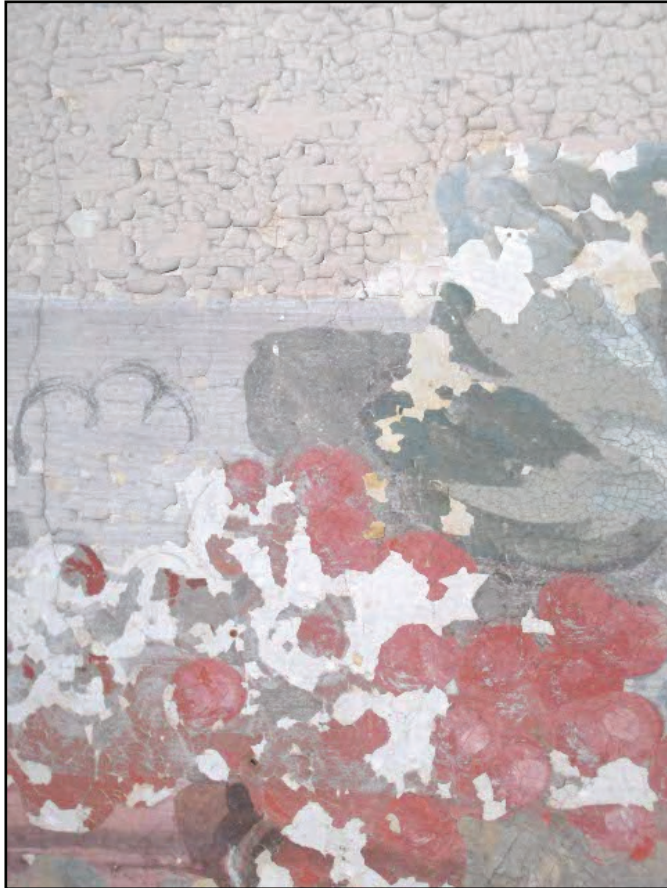
Figur 18. Skador i måleri.