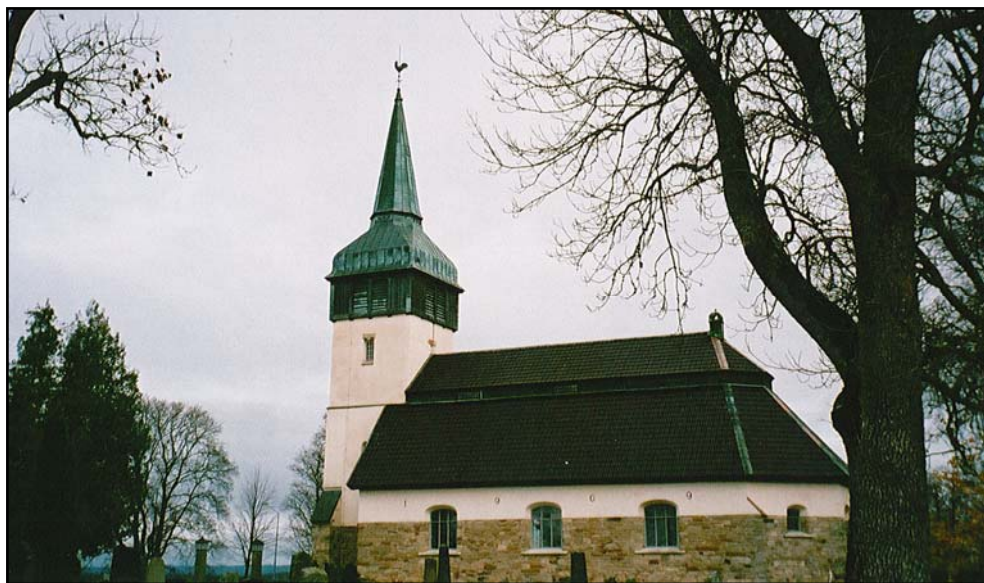
Figur 2. Hackvads kyrka, oktober 2008.

På de första kända skriftliga beläggen från 1314 och 1315 nämns Hackvad som ” De Haknas ” (Ortnamnsarkivet).