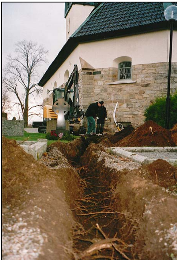
Figur 5. Hackvads kyrka med det färdiggrävda ledningschaktet.

Schaktet vid Hackvads kyrka var cirka 25 m långt, 0,3 m brett och 0,4 m djupt. Schaktmassorna bestod av sand och grus. Inga kulturlager eller gravar berördes av arbetet.