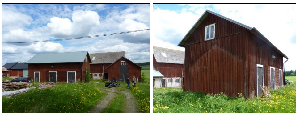
Figur 2. Magasinet i gårdsmiljön före renovering, sett från söder. Foto: Helén Sjökvist. Figur 3. Magasinet sett från sydväst före renovering. Observera spåren i fasaden efter den tidigare tillbyggnaden. Foto: Helén Sjökvist.