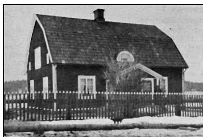
Figur 6. Mangårdsbyggnaden som den såg ut i boken Svenska gods och gårdar år 1940.