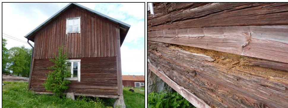
Figur 8. Östra gaveln med bart timmer i nedre delen och gavelröste med stående locklistpanel, före renovering.

Fönstren skrapades rena från löst sittande färg samt kittades om med linoljekitt och målades med linoljefärg.