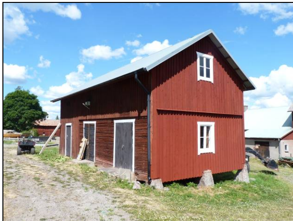
Figur 14. Gaveln brädfodrad och målad.