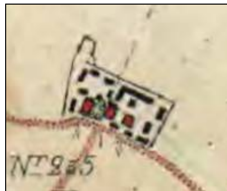
Figur 4. Utsnitt av laga skifteskarta för Gocksta by, upprättad 1866.