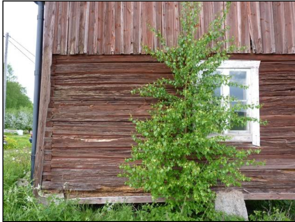
Figur 10. Rötskada på gavelns nedre vänstra sida.