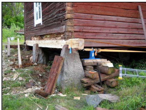
Figur 12. Syllstocken är utbytt mot nytt virke.