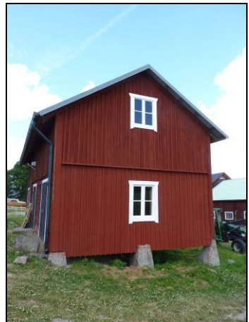
Figur 15. Gaveln brädfodrad och målad.