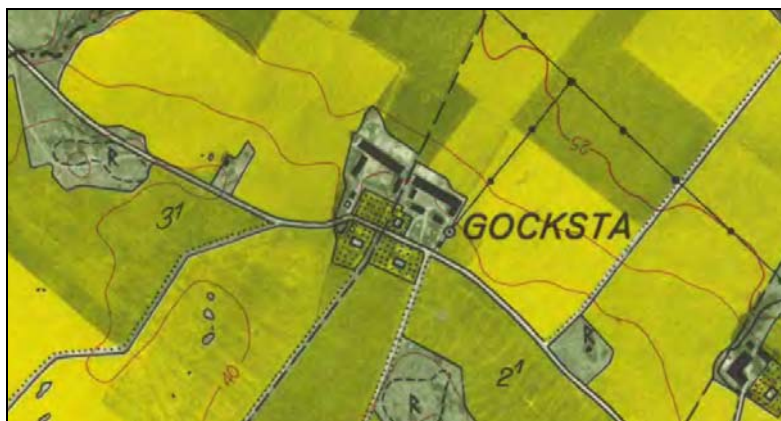
Figur 7. Utsnitt av ekonomiska kartan från 1962.