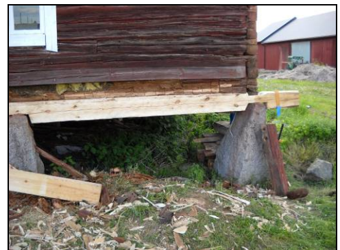
Figur 13. Syllstocken är utbytt mot nytt virke. Över denna gjordes senare en halvsulning av överliggande timmervärv.