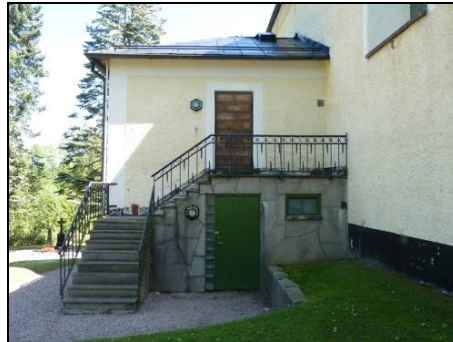
Figur 16. Dörr till sakristia och källare efter renovering.