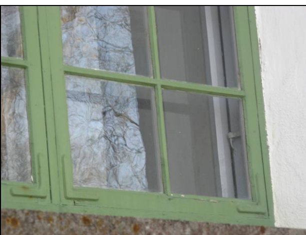
Figur 5. Fönster norra fasaden före renovering.