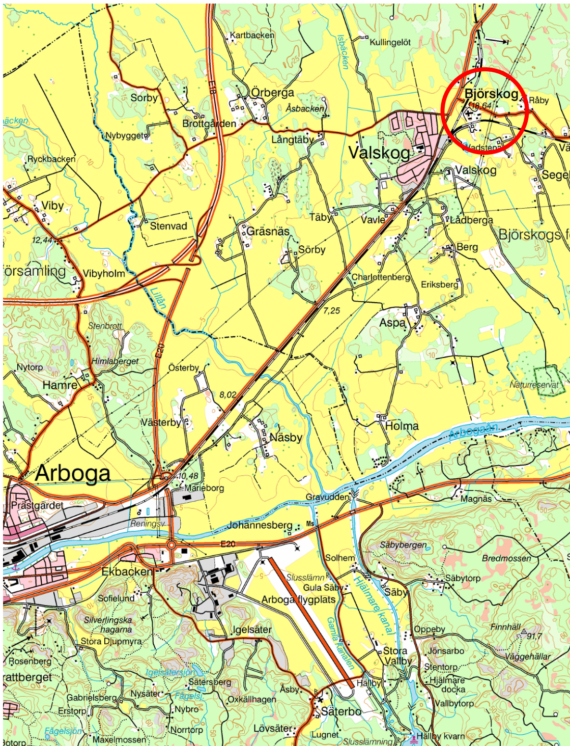
Figur 1. Kyrkans läge, markerat med en ring. Utdrag ur Gröna kartan. Skala 1:50000.