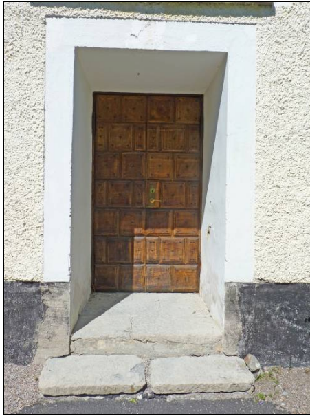
Figur 13. Sydingång efter renovering.