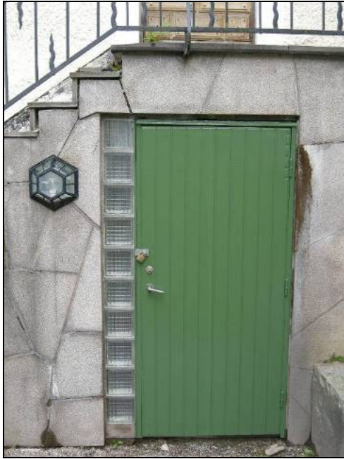
Figur 23. Toalettdörr efter ommålning.