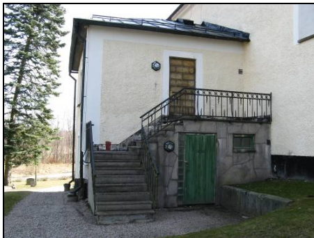
Figur 15. Dörr till sakristia och källare före renovering.