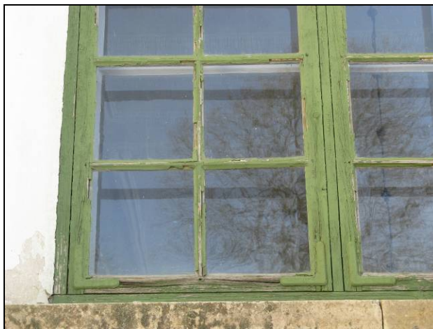
Figur 3. Fönster västra fasaden före renovering. Fönsterbågens bottenstycke är uttorkat och sprucket.