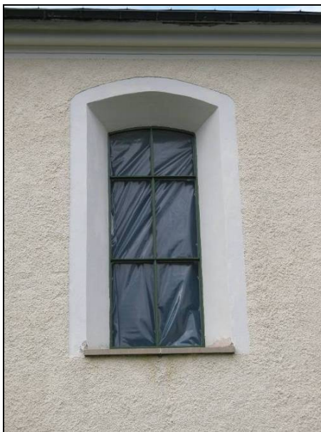
Figur 17. Fönsterbågarna monterades bort för att åtgärdas på verkstad.