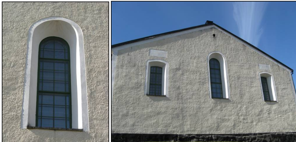
Figur 8. Korfönster före renovering. Foto: Helén Sjökvist. Figur 9. Östgavel före renovering. Foto: Helén Sjökvist.