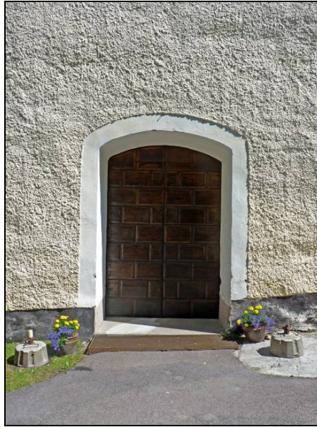
Figur 14. Västingång efter renovering.