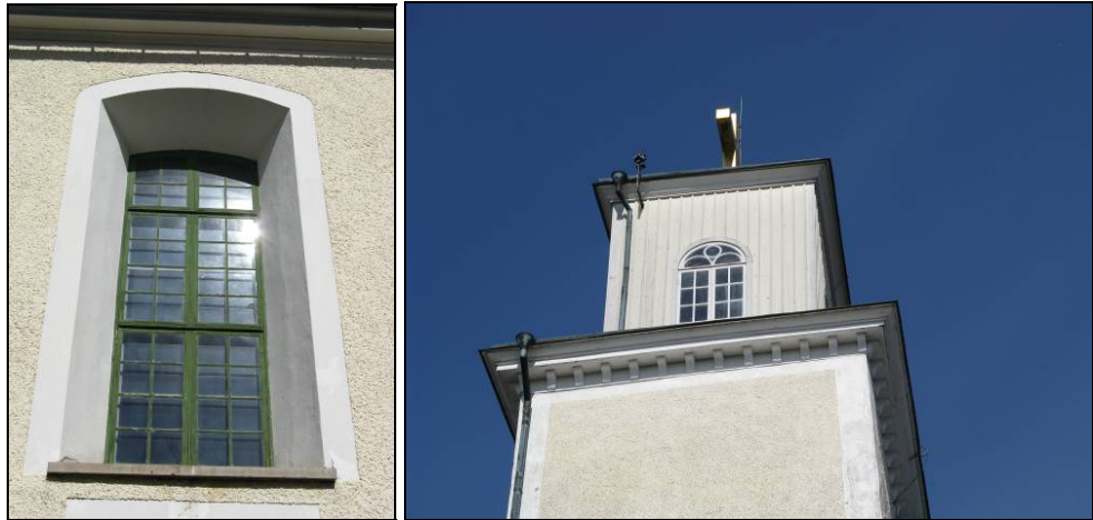
Figur 6. Fönster södra fasaden över sydingång före renovering. Foto: Helén Sjökvist. Figur 7. Lanternin före renovering. Foto: Helén Sjökvist.