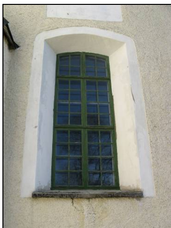
Figur 2. Fönster västra fasaden före renovering.

Kyrkportarna mot väster och söder samt sakristiedörren tvättades med ammoniaklösning och skrapades och avslipades för att avlägsna löst sittande lack. Därefter ströks fyra lager Fabi Deluxe träoljefernissa. Övriga dörrar, som tidigare varit målningsbehandlade, målades med Wiboline linolfärg i samma kulör som fönstren.