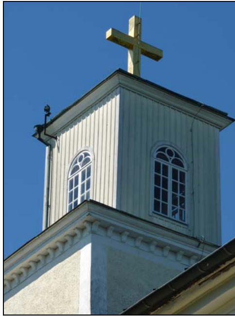
Figur 24. Lanternin efter ommålning.