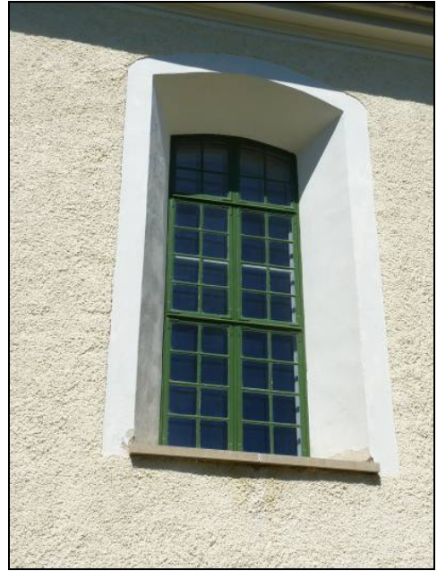
Figur 19. Färdigmålat västfönster (Jämför figur 2 och 3).