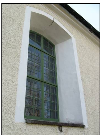
Figur 4. Fönster norra fasaden före renovering.