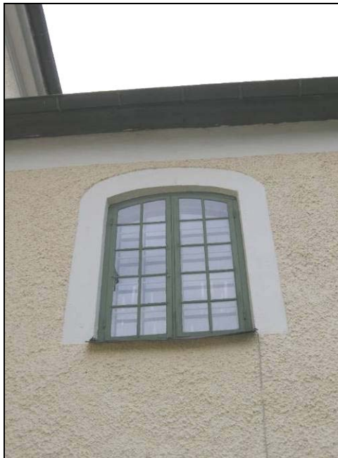
Figur 20. Färdigmålat sydfönster.