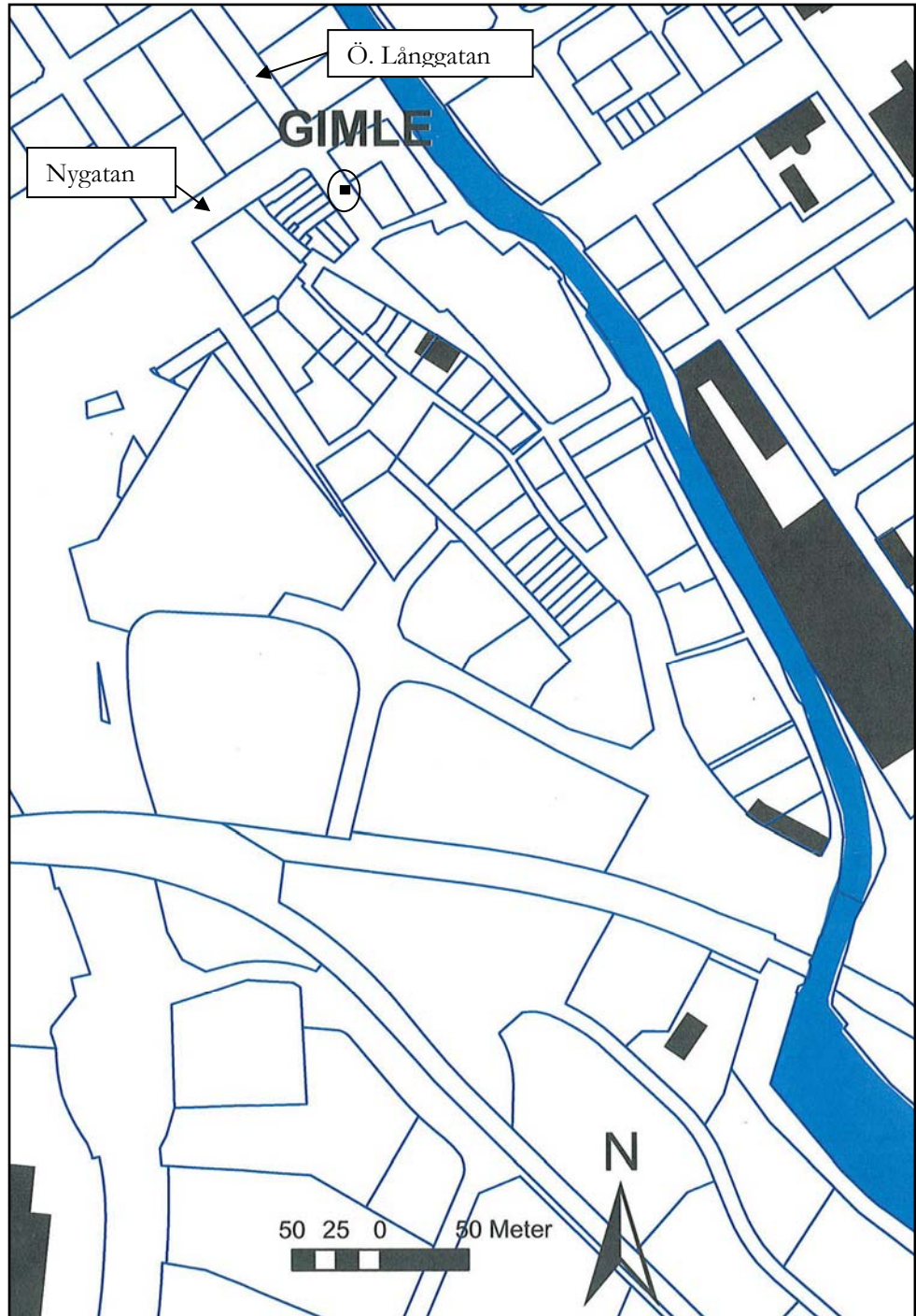
Figur 2. Undersökningsplatsens läge markerat med rektangel inom en cirkel. Utdrag ur digitala fastighetskartan. Skala 1:2000.

Kartor ur allmänt kartmaterial © Lantmäteriet Gävle. Ärende nr MS2006/01407.