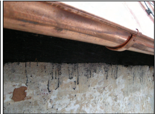
T.h. Bild 15. Nyttillverkad hängränna.