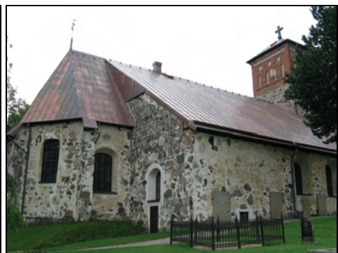
T.v. Bild 8. Långhusets norra takfall innan utbyte av taktäckning.