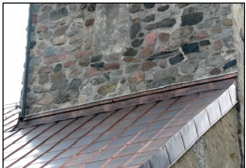
T.v. Bild 18. Plåtanslutning mot norra tornfasaden efter tätning med kalkbruk.

Nederkanterna av tornfasadernas tegelnischer och ljudluckor lagades med kalkbruk lika befintlig.