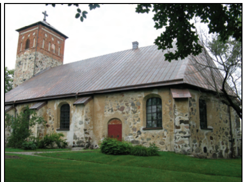
T.v. Bild 6. Södra takfallet innan åtgärder, notera plåtlagningarna samt takluckan.