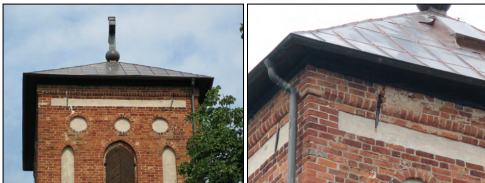
T.v. Bild 12. Tornet efter åtgärder. Bilden visar den nya kopparplåttäckningen på torntak och tornkors samt foglagningar och den färdigtjärade tornluckan/ljudluckan.

Taket på långhuset täcktes sedan med ny dubbelfalsad glödgad kopparplåt med måtten 610×1000 mm innan falsarna knäcktes upp. Falsarna tätades med falsolja. Infästningen av skivtäckningen skedde med s.k. glidklammer av rostfritt stål.