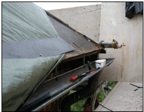
T.v. Bild 16. Hängränna på torntaket återanvändes.