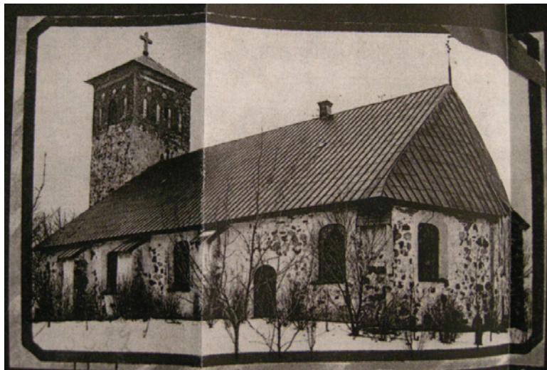
Bild 3. Sankt Nicolai kyrka år 1906. Bilden visar takets järnplåtsbeklädning som tillkom 1887–88 samt tornets nya lägre tälttak.