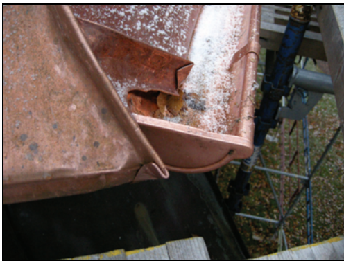
T.h. Bild 17. Hörn med sammanfalsade avvattningssystem på långhuset.