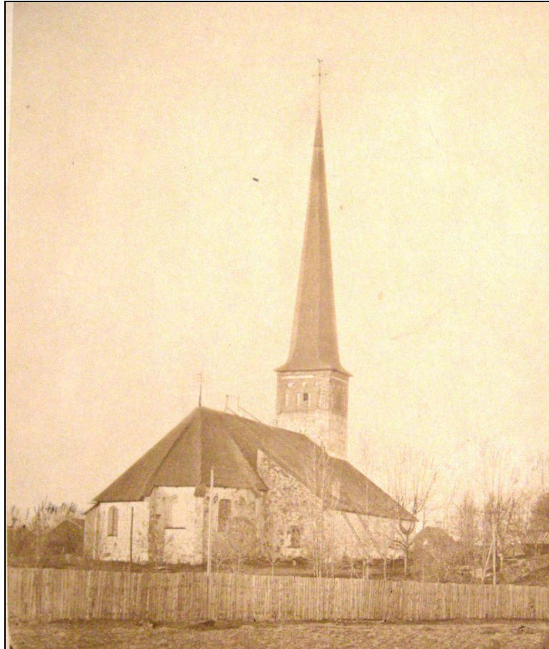
Bild 2. Nicolai kyrkan år 1876. Kyrkan har på bilden fortfarande spåntäckt tak och den höga tornspetsen som uppfördes på 1650-talet. Tornspiran rasade vid en storm år 1889 och ersattes med dagens tälttak.