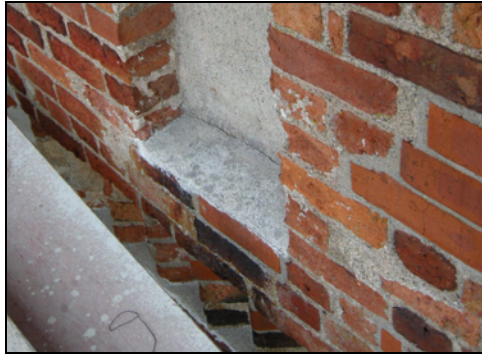
T.v. Bild 20. Skador på solbänk under ljudlucka.