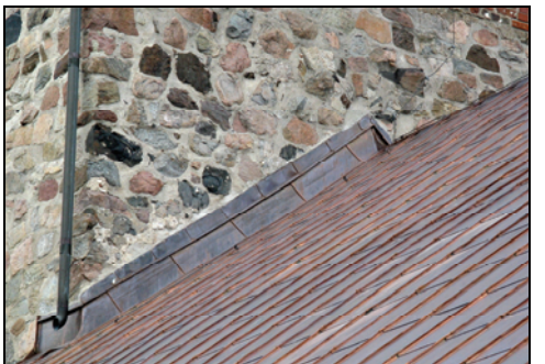
T.h. Bild 19. Plåtanslutning mot östra tornfasaden efter tätning med kalkbruk.