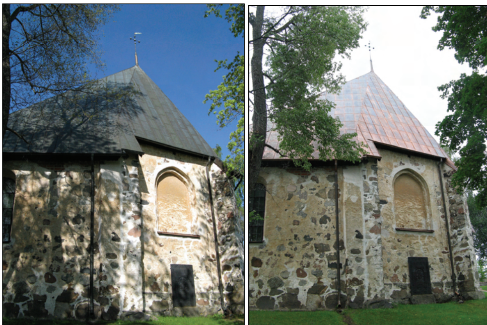
T.v. Bild 10. Korparti med den tidigare kopparplåten från år 1978.