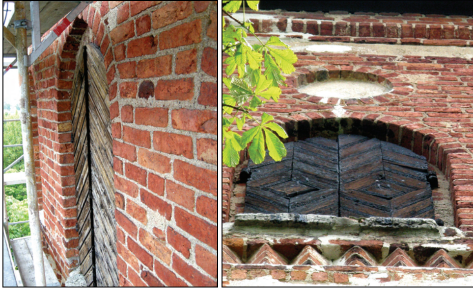
T.v. Bild 24. Ljudlucka i trä innan tjärning.