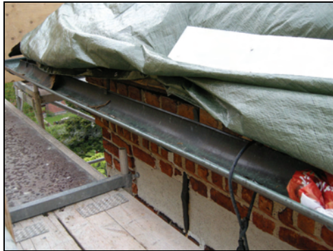
T.v. Bild 14. Äldre hängränna.

Stommen till fotrännorna utfördes av hyvlat virke och skruvades fast i underlaget innan de täcktes med kopparplåt.