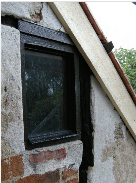
T.v. Bild 22. Nymålat ankarslut.