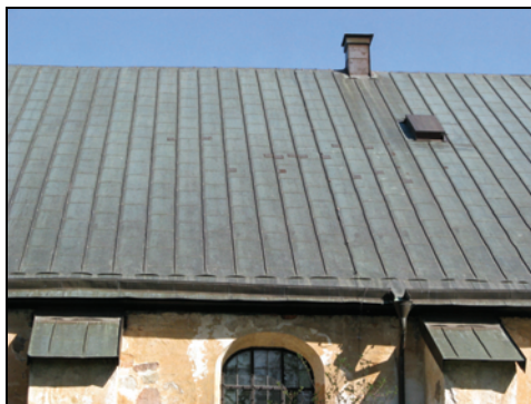
T.h. Bild 5. Ny skintäckning av kopparplåt på långhusets norra takfall.