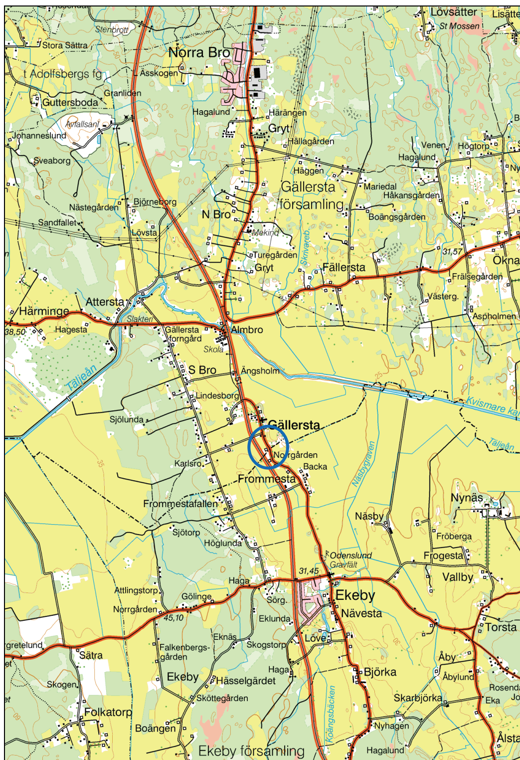
Figur 1. Utsnitt ur Gröna kartan med undersökningsplatsens läge markerat med en ring. Skala 1:50 000.

Kartor ur allmänt kartmaterial © Lantmäteriet Gävle. Ärende nr MS2006/01407.