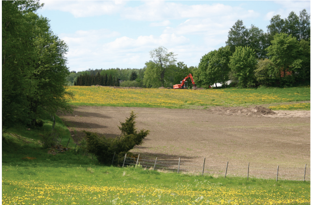
Figur 4. Undersökningsområdet sett från östsydöst. Gällersta 16:1 döljer sig bland träden i bildens vänstra kant.