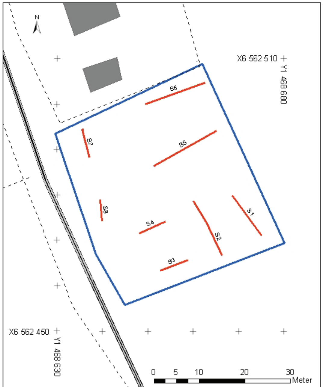
Figur 3. Schaktplan med schaktens läge inom undersökningsytan. Skala 1:500.