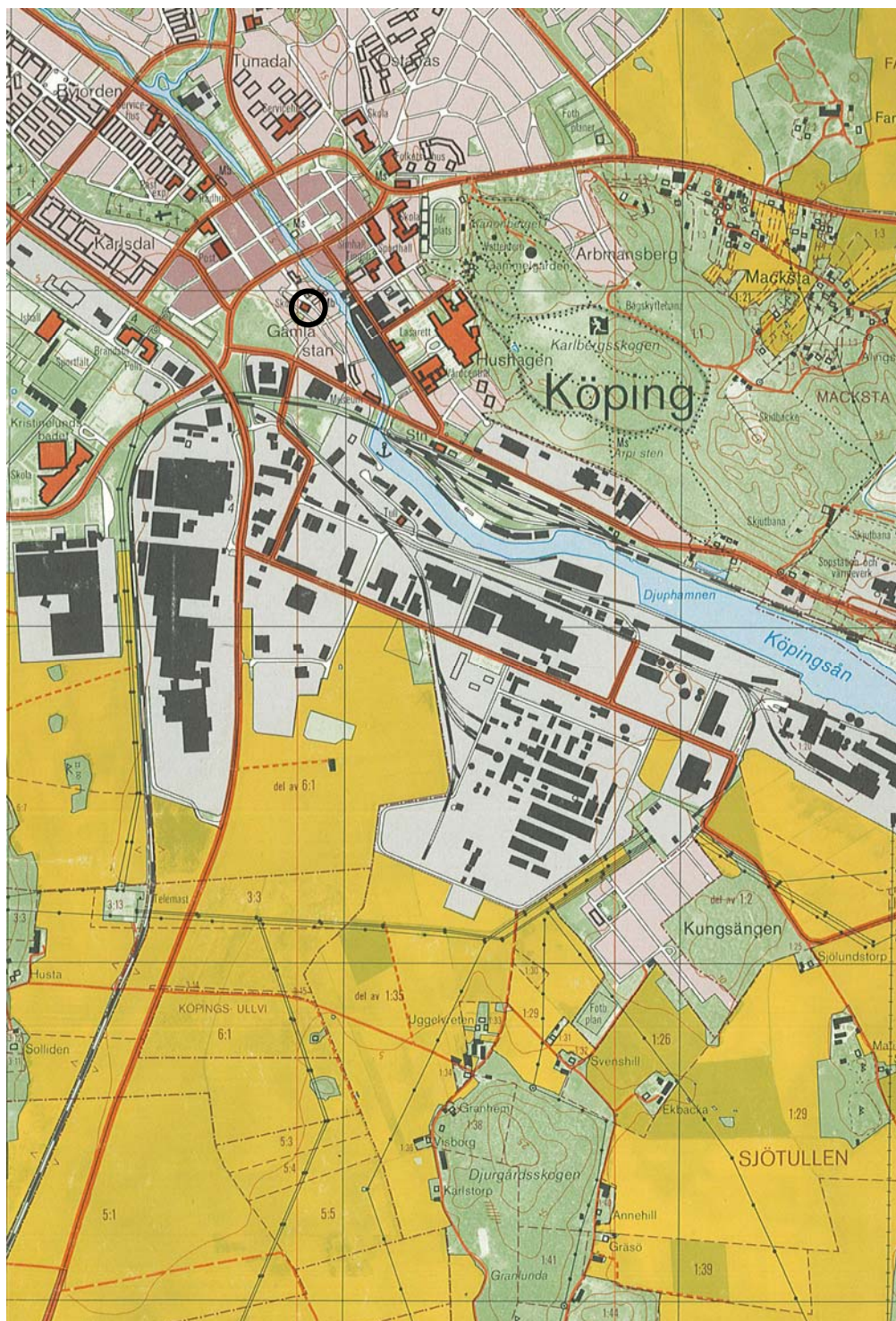
Figur 3. Undersökningsplatsens läge markerat med en ring. Utdrag ur Ekonomiska kartan. Skala 1:20 000.

Kartor ur allmänt kartmaterial © Lantmäteriet Gävle. Ärende nr MS2006/01407.