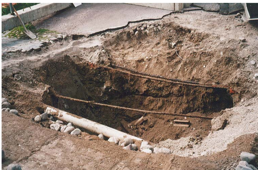
Figur 1. Schaktet i Ö. Långgatan innehöll endast sentida lämningar som kablar och ledningar.

I den 4x4 m stora och 2 m djupa gropen som grävdes i Östra Långgatan påträffades omrörda grus- och lerlager. I schaktet fanns ett flertal kablar, vattenledningar samt fjärrvärme. Inga kulturlager eller fynd påträffades. Från detta enda schakt kopplades fjärrvärmerna vidare till huskropparna i kvarteret Gåsen. I handlingarna uppgavs att två schakt skulle grävas. Så blev alltså inte fallet.