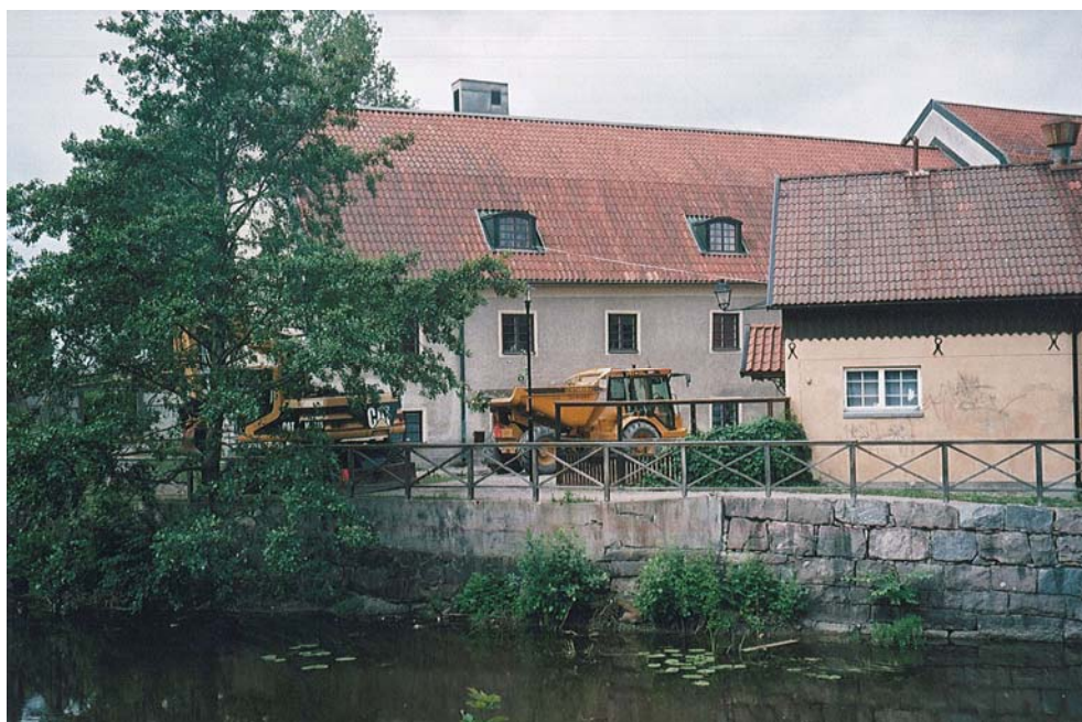
Figur 1. Schaktningar för fjärrvärme vid Köpings museum. (Foto från nordöst U. Alström).

Beställare av den arkeologiska schaktningsövervakningen var Tekniska kontoret, Köpings kommun som också bekostade arbete.