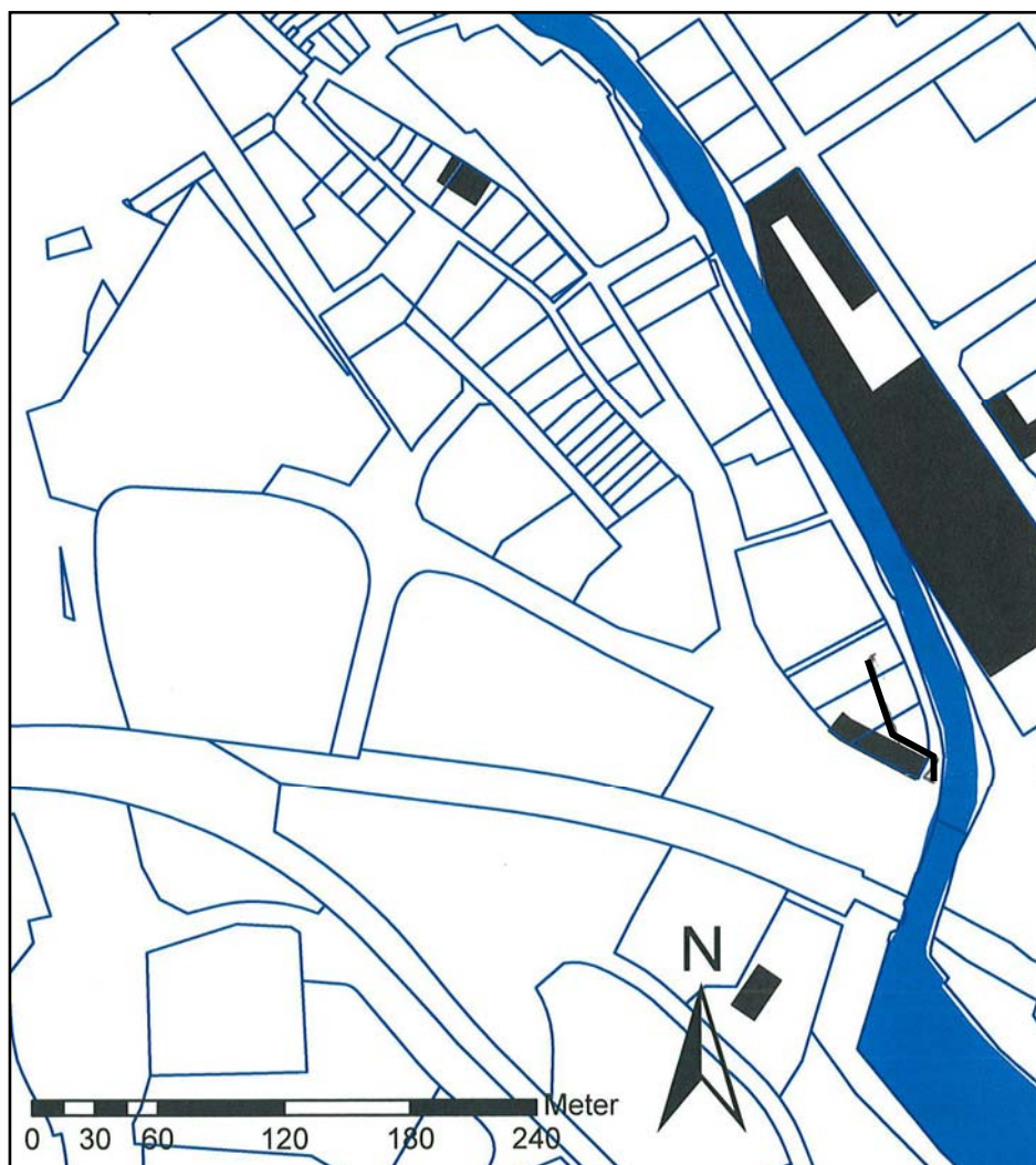
Figur 2. Schaktets dragning på museets tomt markerat med svart linje. (Uttåg ur Fastighetskartan skala 1:4000).

I marken där stadsbranden drog fram har inga arkeologiska spår av den händelsen kunnat noteras i någon sektion eller i plan varför man måste dra slutsatsen att det röjdes väl efter katastrofen (se t.ex. Alström 2007). En del av dessa rester kan ha hamnat i kvarteret av någon anledning. Troligen som fyllnadslager.