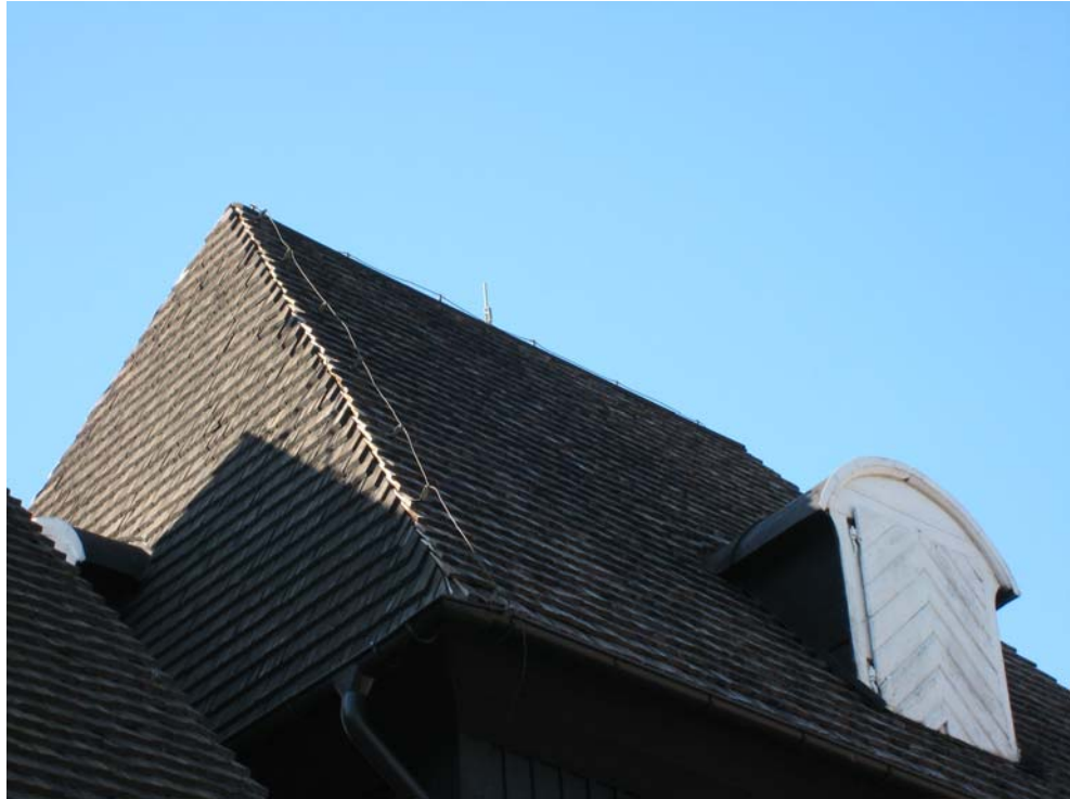
Anpassning av nytt spån mot befintligt.