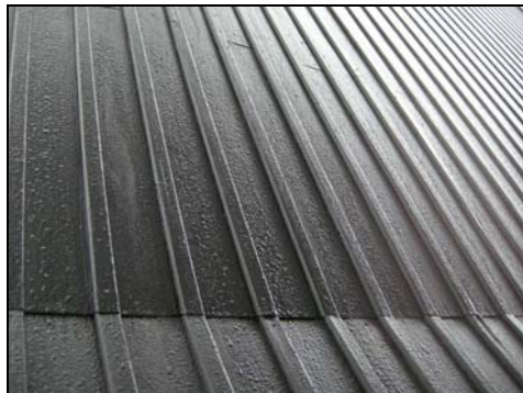
Figur. Norra takfallet på långhuset.