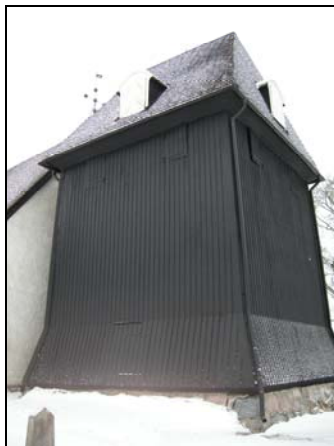
Figur. Omtjärad klockstapel.