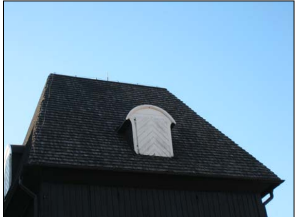
Figur. På klockstapelns norra takfall har samtliga spån bytts ut.