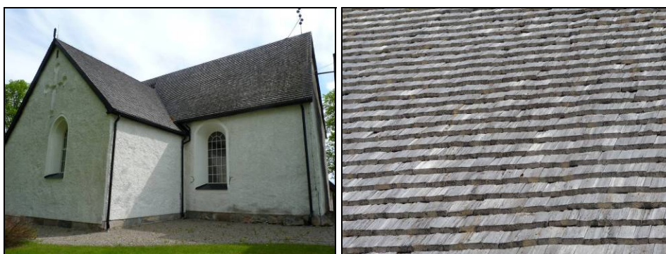
Figur. Taket sett från nordväst före omtjärning. Foto: Helén Sjökvist. Figur. Vapenhusets tak före omtjärning med kanske lite för tätt liggande spån. Detta kan leda till minskad inträngning av tjära mellan spånen. Foto: Helén Sjökvist.