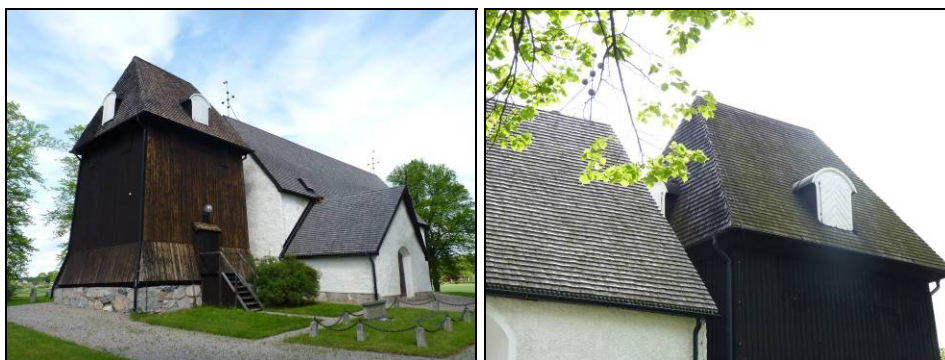
Figur. Kyrkan och klockstapeln sedd från sydväst före omtjärning. Foto: Helén Sjökvist. Figur. Algangrepp på klockstapelns norra takfall. Foto: Helén Sjökvist.