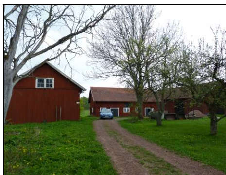
Figur 9. Samlad ekonomibebyggelse sedd från norr.

Tanken var att hela taket på logen skulle ha bytts mot plåt av typen TP20, det vill säga en trapetskorrugerad standardplåt. Istället kom det gamla tegeltaket att behållas och endast en nockplåt lades på byggnaden. Ur kulturmiljösynpunkt är det förstås positivt att teglet har kunnat ligga kvar på taket, om detta ger ett tillräckligt tätskikt och skydd för byggnadens stomme. Vad som hade varit önskvärt är dock att nockplåten slutit bättre än mot underliggande tegel. På ett par ställen lyfter plåten från underlaget, vilket ur estetisk och teknisk synvinkel bör vara negativt.