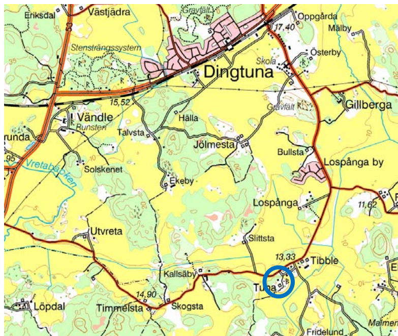
Figur 2. Tuna markerat med en ring på Gröna kartan. Skala 1:50 000.