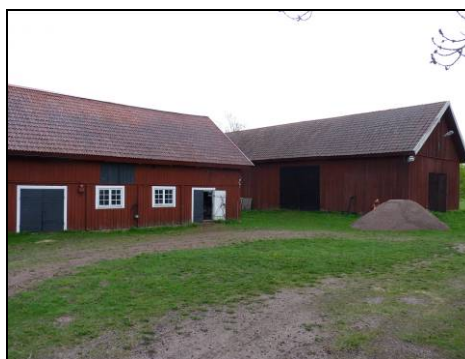
Figur 10. I bakgrunden syns den aktuella logen före åtgärder.