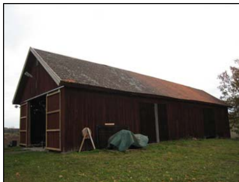
Figur 11. Logen sedd från väster.