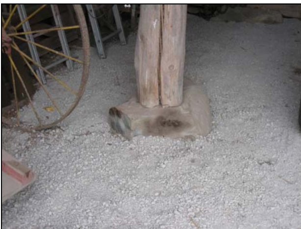
Figur 5. Sidoskepp med vägg i stolpverkskonstruktion och stående stolpar som stöd för takkonstruktionen.