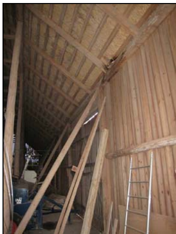
Figur 4. Halmtak under nuvarande tegeltäckning. Till höger i bild anas att ryggingen på halmtaket är borta och att tegeltäckningen skymtar fram.