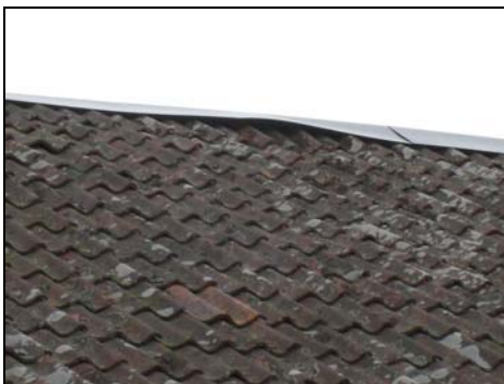
Figur 12. Taket sett från väster. Plåten ligger ojämnt och sluter inte riktigt an mot teglet.