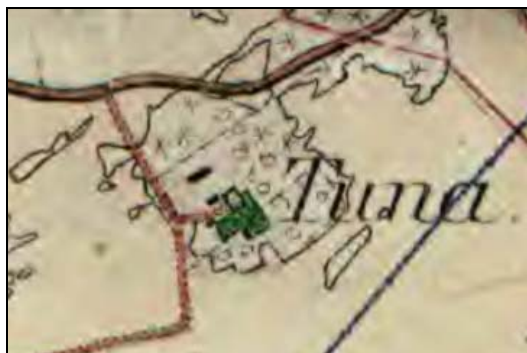
Figur 7. Häradsekonomska kartan uppmätt år 1905-11.