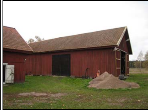
Figur 13. Västra takfallet sett mot söder.