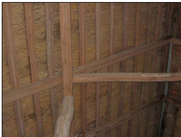
Figur 3. Takstolskonstruktion.