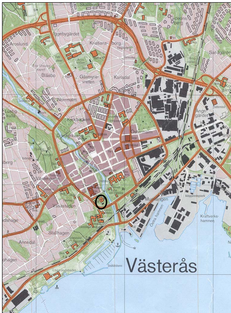
Figur 2. Undersökningsplatsens läge markerat med en ring. Utdrag ur Ekonomiska kartan. Skala 1:20 000.

Kartor ur allmänt kartmaterial © Lantmäteriet Gävle. Ärende nr MS2006/01407.