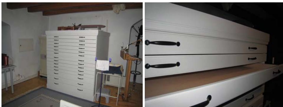
Figur 2. Textilskåpet är placerat utmed sakristians södra vägg. Strax bakom skymtar det flyttade kassaskåpet.

För att få rum med textilskåpet har det befintliga kassaskåpet flyttats till det sydöstra hörnet i sakristian. Detta har medfört behov av förstärkning av golvet i detta hörn.