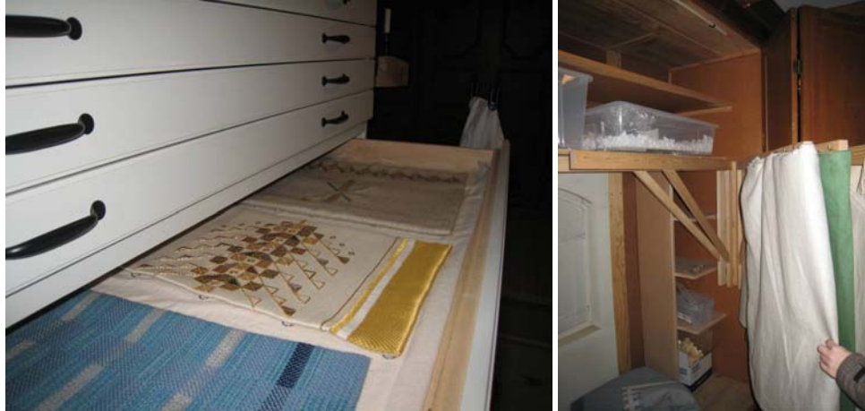
Figur 4. Lådorna är inredda med textilklädda skivor.