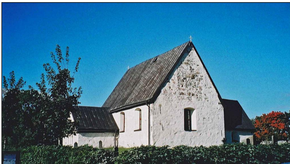
Figur 2. Angarns kyrka hösten 2012.

Arbetet beställdes av Össeby församling som också bekostade schaktningsövervakningen och efterföljande rapportarbete.