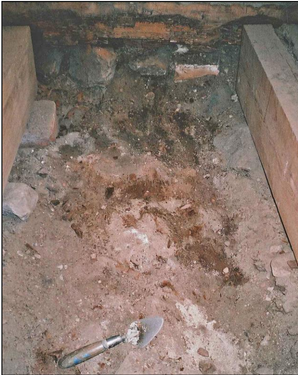
Figur 7. Under det grå steniga lagret framkom ett mycket murket trägolv som med viss osäkerhet dateras till 1700-talet. Bjälkarna som syns i bildens kanter är nyinlagda. (Foto från väst U. Alström.)

Några spår efter en äldre kyrka kunde inte observeras.