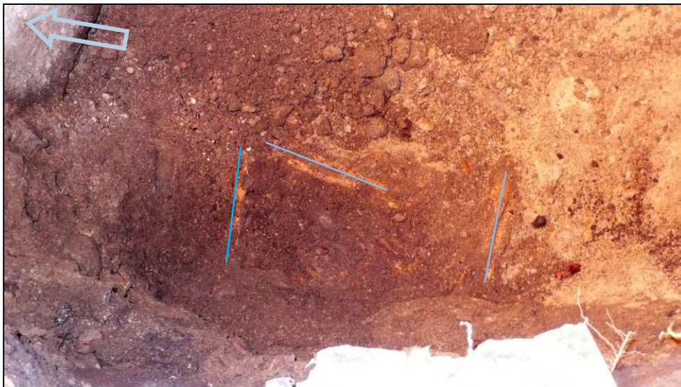
Figur 4. Del av skelettet med ena underarmen i vinkel på magen. Skelettet ligger efter norra väggen och som brukligt i väst-östlig riktning. Armställningen är markerad med blå linjer.

när graven påträffades. Det troliga är ändå att en gravsättning skett i sakristian eftersom graven tydligt låg inrättad efter sakristians norra vägg.