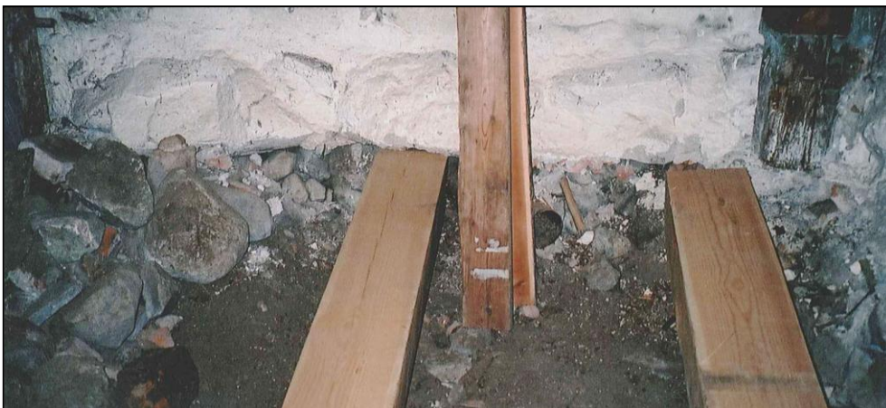
Figur 8. Bilden visar att golvnivån har sänkts genom att golvmaterial fraktats bort. När detta skett har inte fastställas. Bilden visar kyrkans västra vägg. (Foto från öster U. Alström.)