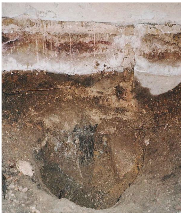
Figur 6. Murken golvbjälke vid sakristians västra vägg. Foto från öster U. Alström.)

Under stengolvets sättlager som bestod av kalkbruk, småsten och grus påträffades ut från väggarna rester efter ett mycket murket bjälklag. Bjälklaget talar för att ett trägolv funnits i sakristian innan stengolvet lades in. Under trägolvslagret påträffades ett grusigt mörkt kulturlager som var 0,3 meter tjockt. Detta lager låg på ren morän, dvs ursprunglig markyta.