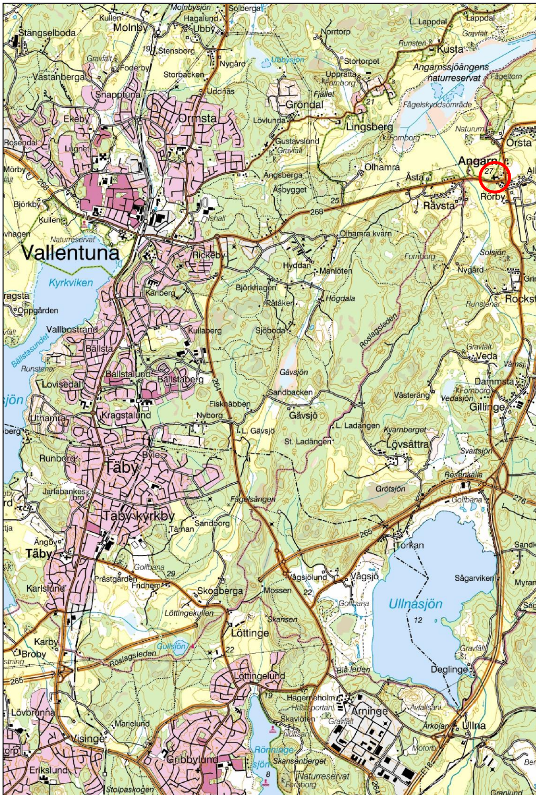
Figur 1. Undersökningsplatsens läge markerat med en ring. (Utdrag ur Gröna kartan. Skala 1:50 000.)