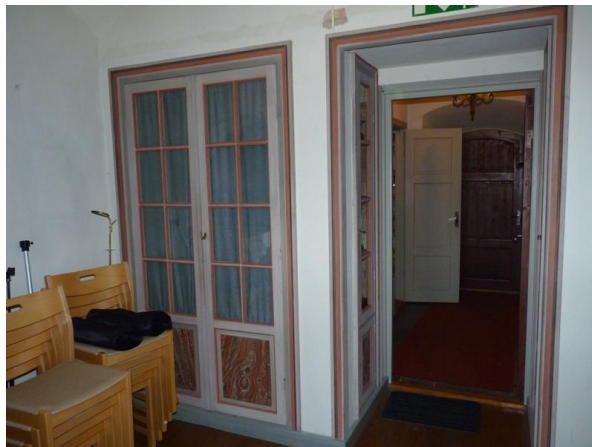
Figur 4. Före åtgärd. Inbyggt förråd i sakristian samt väggyta mellan förråd och dörr där givare monterades.