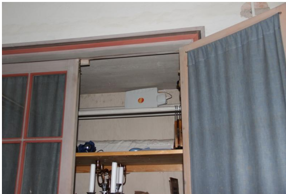
Figur 6. Efter åtgärd. Antenn för 3G har placerats högst upp inuti ett förråd i sakristian.