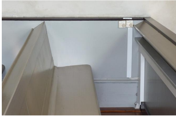
Figur 2. Före åtgärd. Två termostater i första bänkraden, norra kvarteret.