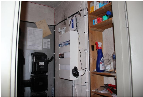
Figur 7. Efter åtgärd. Nytt apparatskåp i elförrådet.