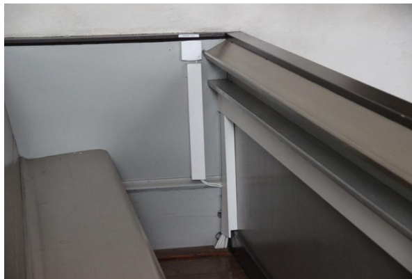
Figur 3. Efter åtgärd. Två termostater byttes mot en i första bänkraden, norra kvarteret. En dold givare har också installerats (i plastlisten) som styr temperaturen och minskar fukten om det behövs.