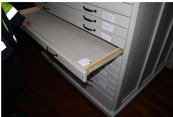
Figur 8. I textilförvaringsmöbeln på läktaren har en givare placerats.