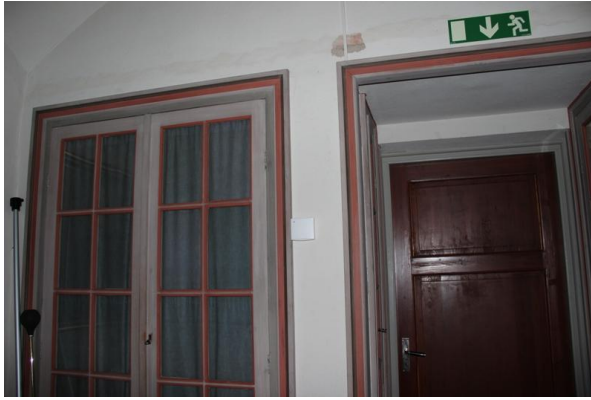
Figur 5. Efter åtgärd. Givare för temperatur och fukt har monterats bredvid förrådet.