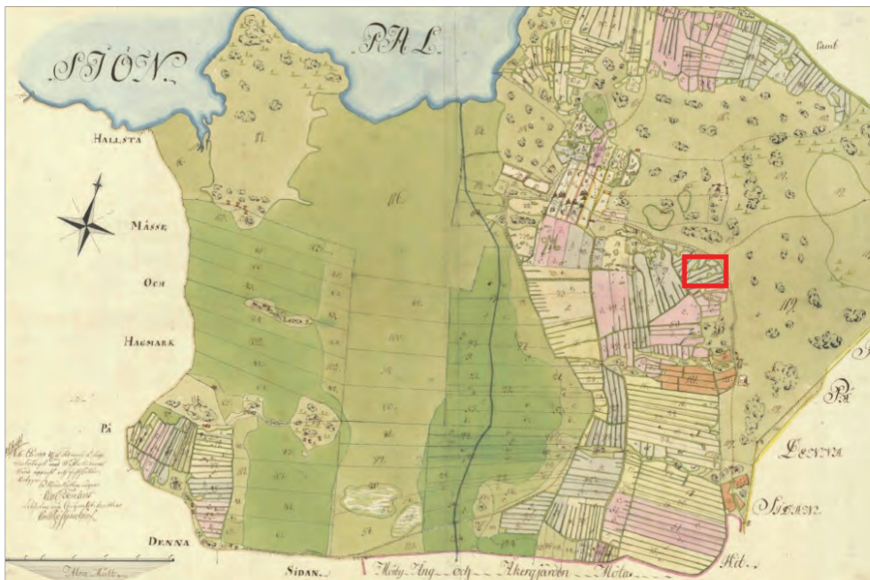
Figur 3. Storskifteskarta från 1789 med utredningsområdet markerat (Akt nr LMS: C47-34:2). Ej skalenlig.