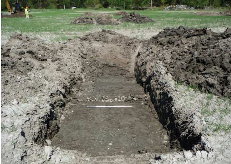
Figur 5. Schakt 10 med stenfyllt dräneringsdike, från söder.