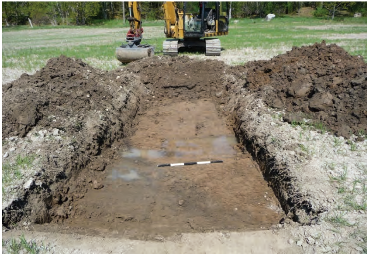
Figur 6. Schakt 15, som visar ett större täckdike, från söder.