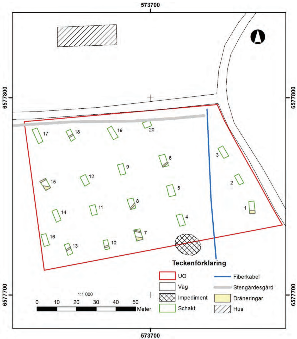
Figur 4. Schaktplan med störningar markerade. Skala 1:1 000.