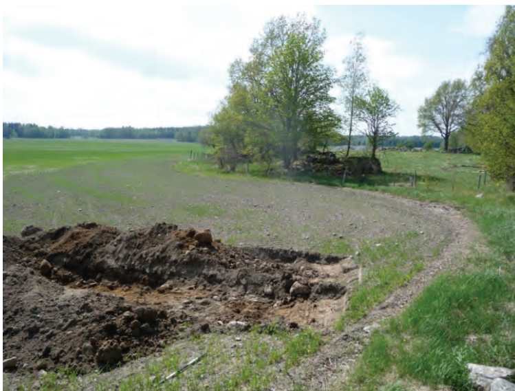
Figur 7. Schakt 17 med moränstråk direkt under plogzonen. RAA Lista 111 syns bortom åkerytan. Foto från östnordöst.