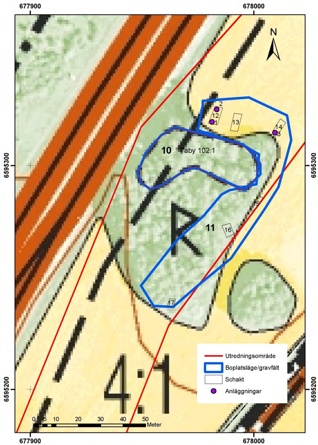
Figur 4. Boplatsen objekt 11, gravfältet objekt 10 (Täby 102:1), schakt och anläggningar. Utdrag från digitala fastighetskartan. Skala 1:1 000.