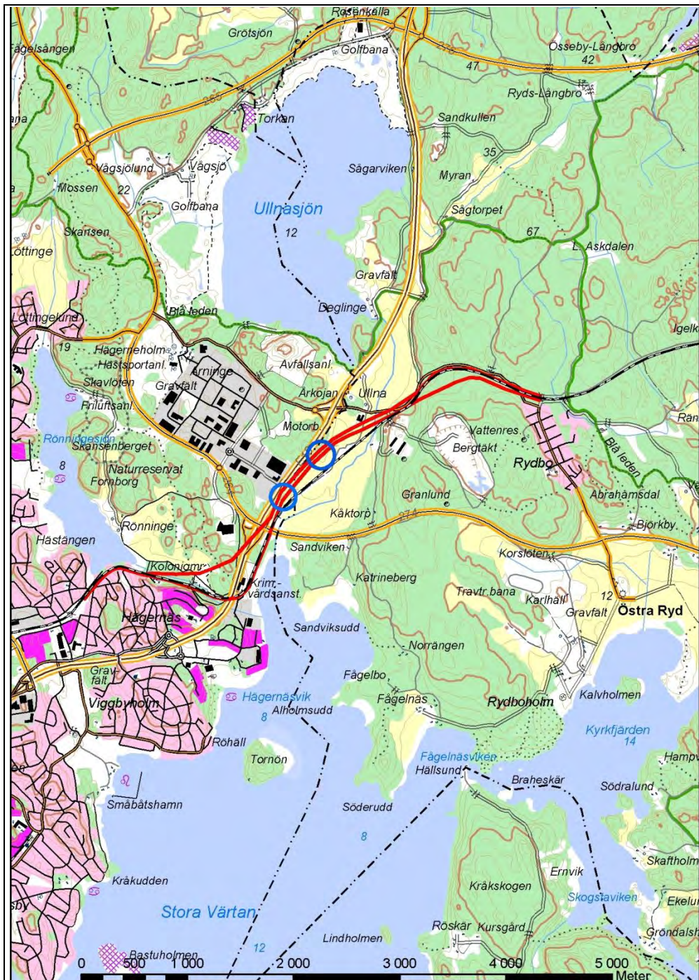
Figur 1. Utredningsplatsernas läge, markerade med blå cirklar. Utredningsområdet för Roslagsbanan dubbelspår, sträckan Viggbyholm-Rydboholm markerad med rött. Utdrag ur Digitala Terrängkartan. Skala 1:50 000.