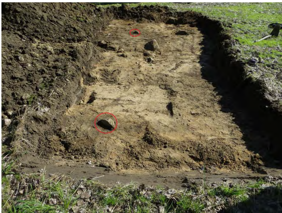
Figur 5. Schakt 12 i boplatsläget objekt 11. I förgrunden syns stolphålet A1 och i bakgrunden stolphålet A2 markerade med röda ringar. Foto från söder, Henrik Runeson.