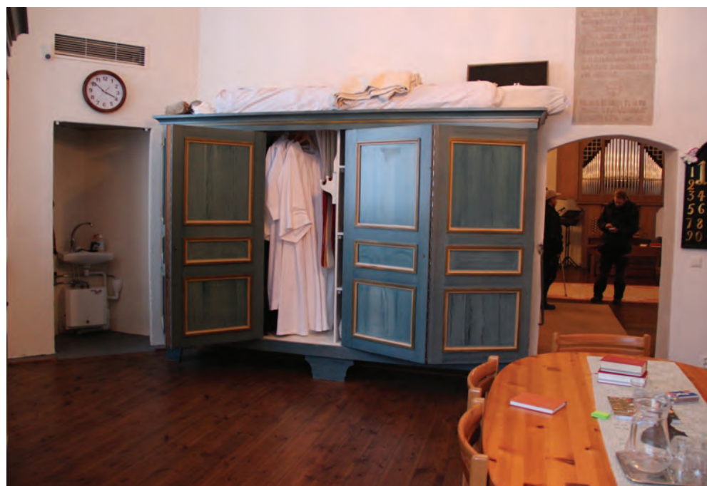
Figur 4. KM12063 Ramnäs ka_20120305_0004. Befintligt bemålat skåp, troligen från 1975.