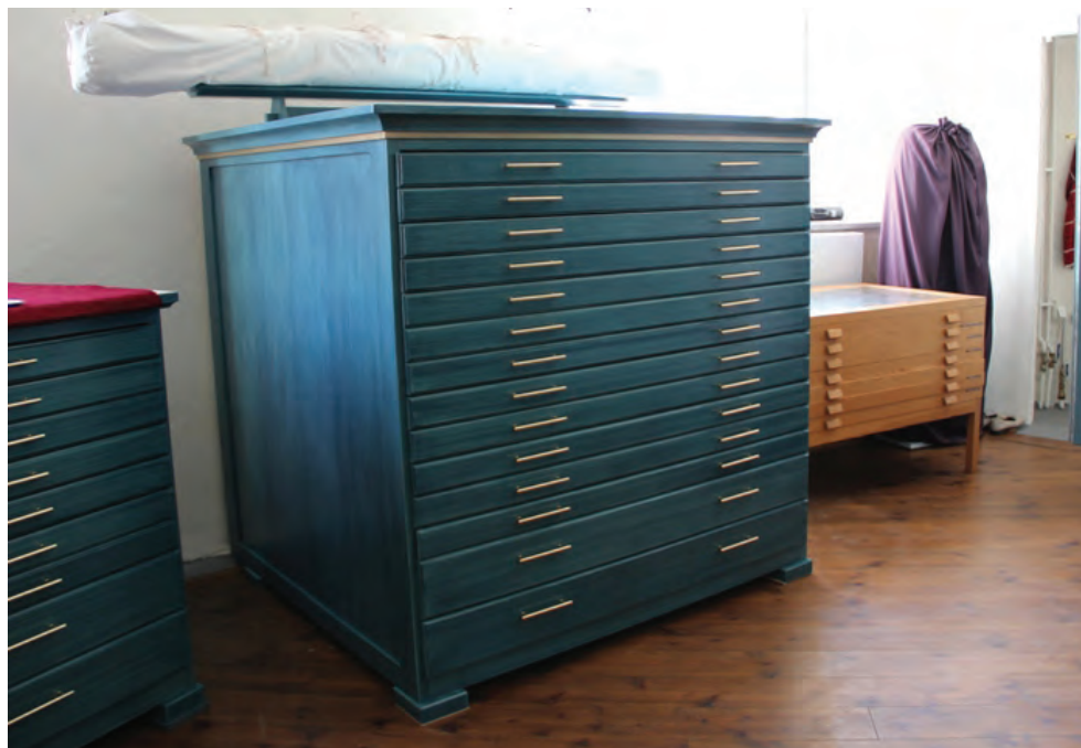
Figur 6. KM12063 Rannäs ka_20130516_0011. Ny textilförvaring med ställning för mattförvaring.