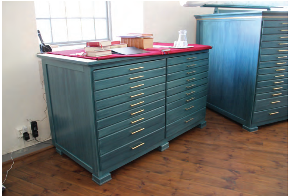
Figur 7. KM12063 Ramnäs ka_20130516_0017. Ny textilförvaring.