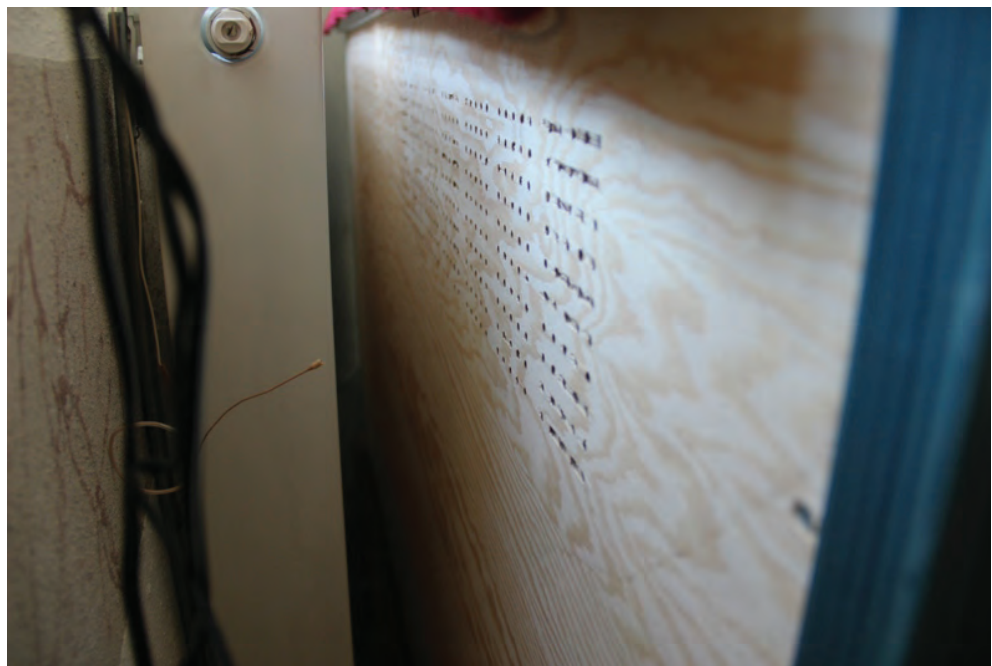
Figur 8. KM12063 Ramnäs ka_20130516_0019. Ny textilförvaring med ventilationshål i bakstycket.