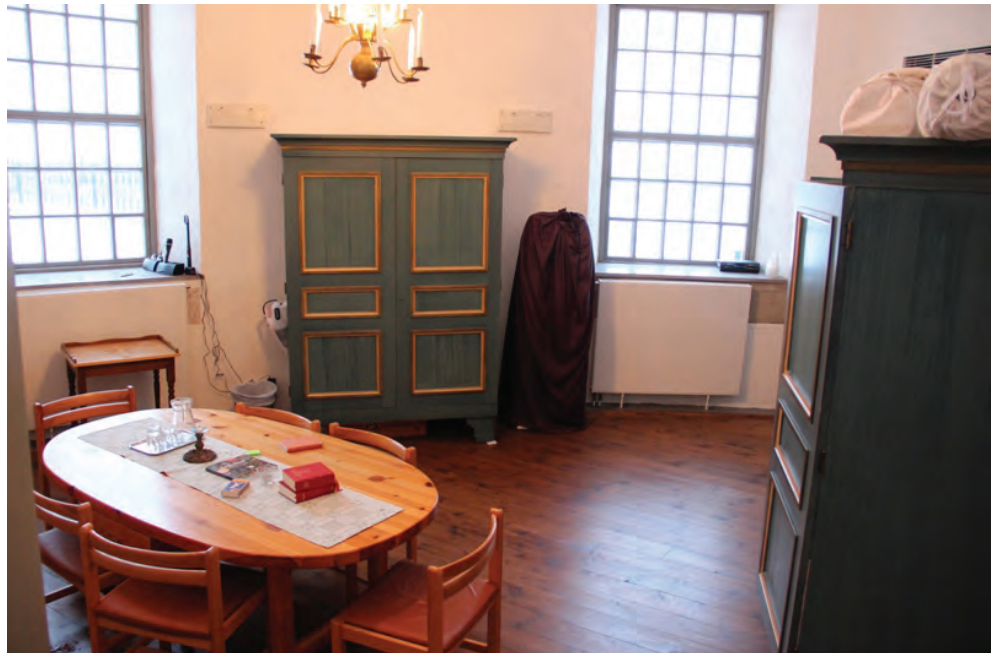
Figur 3. KM12063 Ramnäs ka_20120305_0003. Befintliga bemålade skåp, troligen från 1975, som nya skåp anpassats till avseende utformning.