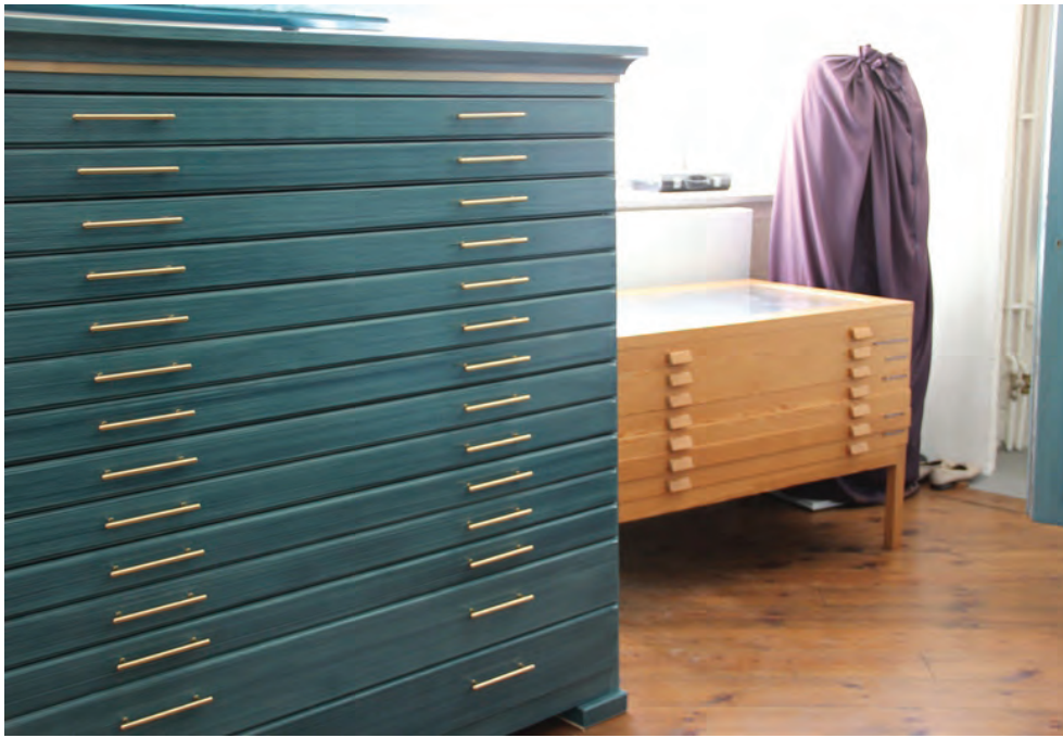
Figur 5. KM12063 Rannäs ka_20130516_0012. Ny textilförvaring bredvid gammal.