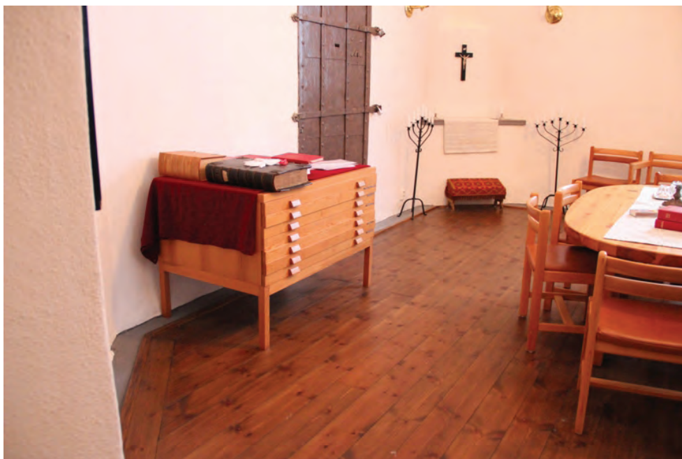
Figur 2. KM12063 Ramnäs ka_20120305_0002. Äldre skåp i standardutförande för liggande förvaring.

Ramnäs kyrkas nya textilförvaring för liggande förvaring, samt förbättrade klimatförhållande, har utfört i enlighet med Länsstyrelsens beslut.