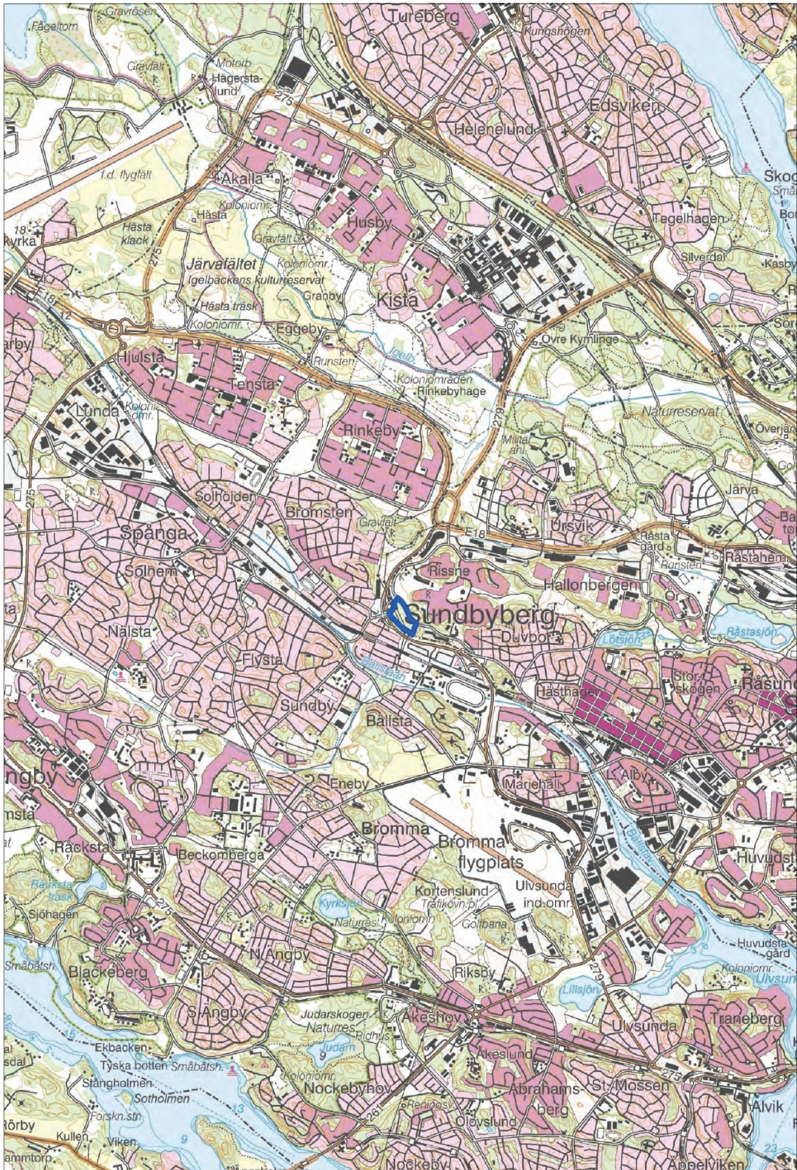
Figur 1. Utredningsområdet markerat med en blå linje. Utsnitt ur digitala terrängkartan. Skala 1:50 000.