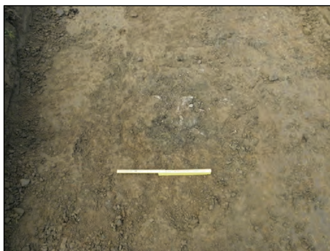
Figur 4. Härden i schakt 3 fotografierad från öster.

Område C ligger i den allra västligaste delen av utredningsområdet, väster om det vattensjuka området. Området avgränsas i norr, öster och söder av markanta höjder. Inom ytan grävdes tre schakt (S9–11). Inga anläggningar påträffades.