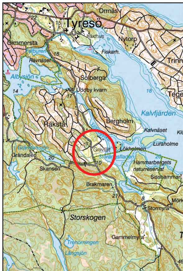
Figur 1. Utdrag ur digitala Terrängkartan. Platsen för utredningen är markerad med en röd ring. Skala 1:50 000.

De tre boplatslägena utredningsgrävdes under etapp 2. I område A framkom en härd. Denna har dokumenterats vid utredningen och länsstyrelsen i Stockholms län har beslutat att inga ytterligare arkeologiska åtgärder krävs (dnr 431-31461-2012, daterat 2013-09-13). Efter samråd med länsstyrelsen klassificeras härden i detta fall därför som en övrig kulturhistorisk lämning och inte som fast fornlämning. Inom område B och C påträffades inga fasta fornlämningar eller förhistoriska fynd.