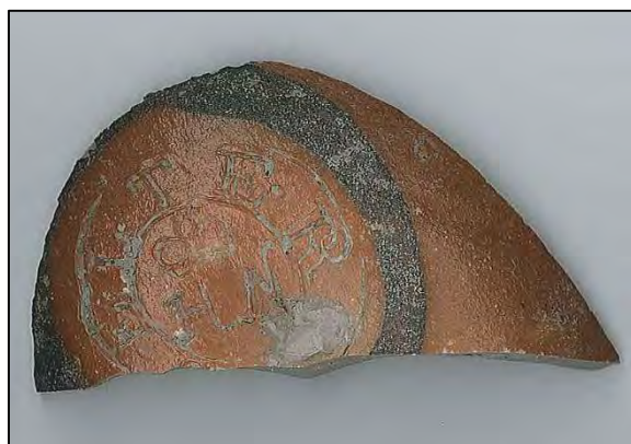
Figur 3. En skärva från en Selterflaska i saltglaserat stengods framkom i schaktet vid västra kyrkogårdsgränden. Skala 1:1.

Schaktet som grävdes var cirka 130 m långt. Djupet var i allmänhet 0,6 meter och bredden 0,4 meter. I schaktet vid kyrkans torn framkom byggnadsrester i form av bruk och tegelfragment. Det avsatta lagret härstammar med stor säkerhet efter bygget av tornet 1824–1826. För övrigt bestod schaktmassorna av matjord och morän. Enstaka ben påträffades under grävningsarbetet. Dessa lades tillbaka i schaktet.