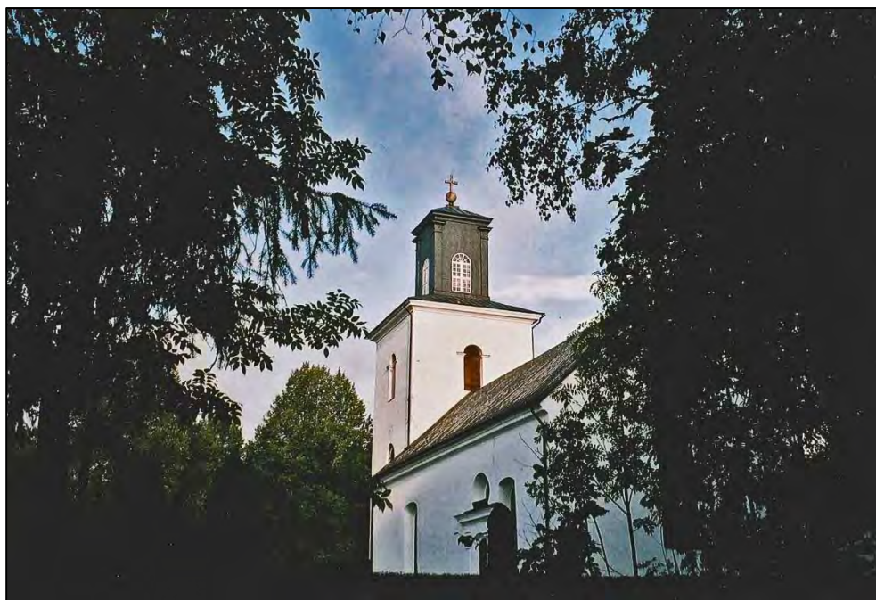
Figur 1. Tortuna kyrka från ÖSÖ.

Beställare av den arkeologiska kontrollen var Västerås kyrkliga samfällighet.