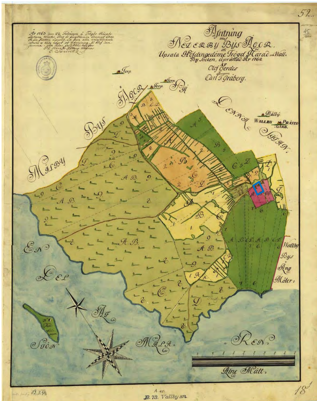
Figur 3. Storskäfteskarta från 1762 över Nederby med det aktuella området markerad med blå linje. Ej skalentlig.