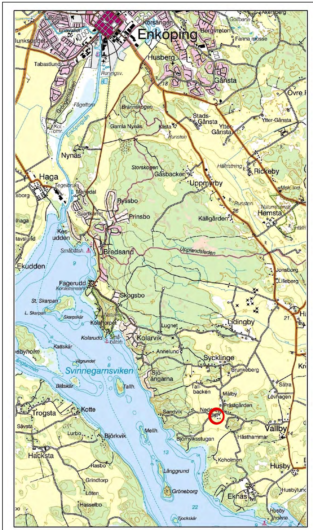
Figur 1. Undersökningsplatsens läge, markerat med en röd ring. Utdrag ur Digitala Terrängkartan. Skala 1:50 000.