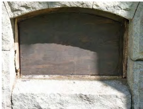
Figur 19. Källarfönstret i gravkorets södra fasad innan åtgärd.

Källarfönstret i gravkorets södra fasad var igensatt och karmen var delvis rötskadad. En ny båge tillverkades och större delen av karmens virke ersattes. Karm och båge har målats efter övriga fönster samt vid sinsemellan olika tillfällen och avviker något från varandra i kulör.