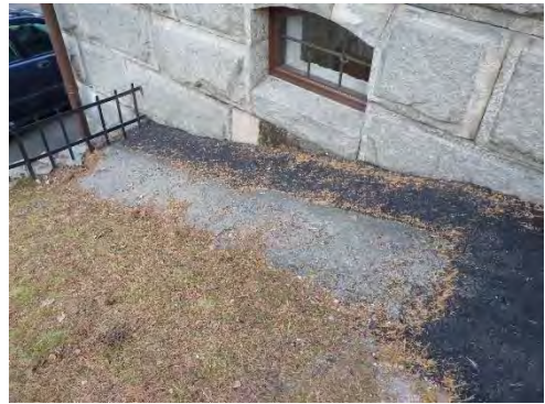
Figur 8. Här lades endast ny asfalt intill fasad.

Fönster: Karmar och bågar rengjordes med målartvätt samt vid behov Decomax alg och mögeltvätt. Lös färg och kitt avlägsnades, trärena ytor oljades med Jupex 45, Kinesisk träolja, därefter kittades bågarna med Dana lim Linoljekitt. Fönstren målades med Wiboline Gammaldags Linoljefärg i kulör NCS S 8010-Y10R. Fönstret i gravkorets gavelröste var tidigare målat i vit kulör men fick nu samma kulör som de övriga. Dessvärre målades även de äldre fönsterblecken av koppar. Färgen togs senare bort från fönsterblecken, dock med en viss påverkan på utseendet.