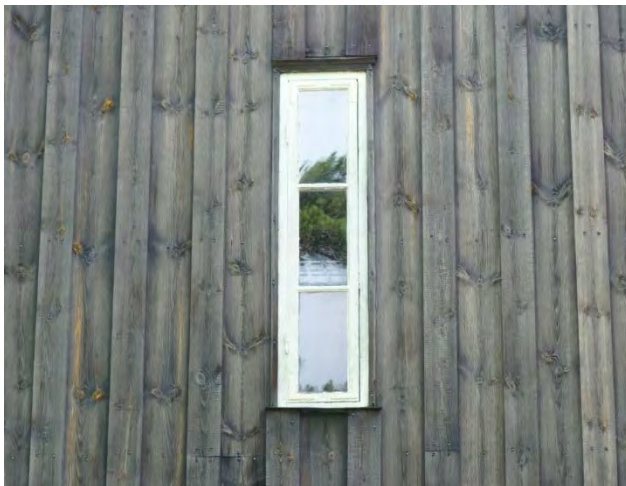
Figur 14. Färgen avlägsnades men inte helt utan åverkan.