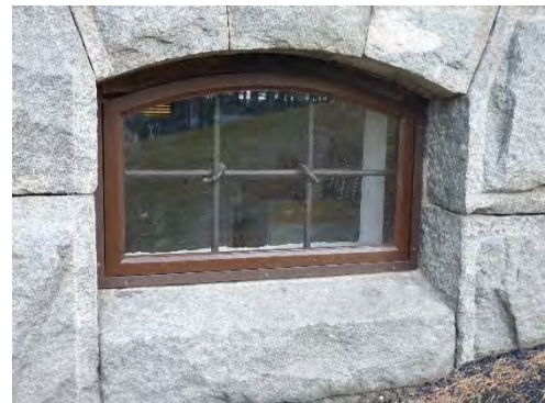
Figur 20. Ett nytt fönster tillverkades och karmen ersattes, med undantag av överstycket.

Vindskivor och takfotsbrädor: Ytorna rengjordes med målartvätt samt vid behov Decomax alg och mögeltvätt. Lös färg avlägsnades och vindskivorna grundades med Tinova utegrund därefter målades vindskivor och takfotsbrädor med Nordsjö Tinova oljetäckfärg, i kulör NCS S 0502-Y.