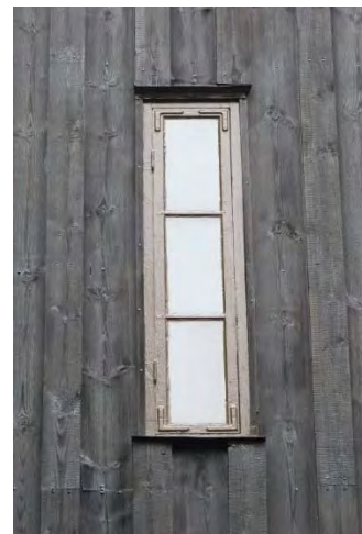
Figur 15. Fönstret i gravkorets gavelröste var målat i vit kulör. Bilden visar även gavelröstets panel innan ommålning.