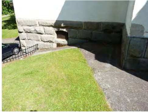
Figur 5. Det för markarbeten aktuella området innan åtgärd.