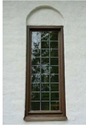
Figur 11. Ett av fönstren innan åtgärd (fönstret längst norrut i östra fasaden).