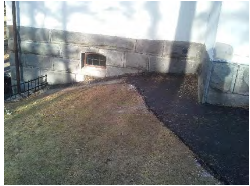
Figur 6. Asfalten lades delvis om med justerad lutning från fasad.