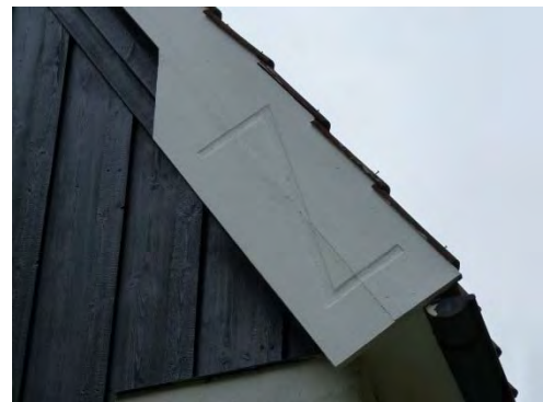
Figur 22. Samma vindskiva efter åtgärd. Observera den stilfulla Z-orneringen.