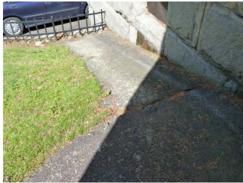
Figur 7. Del av området innan åtgärd.