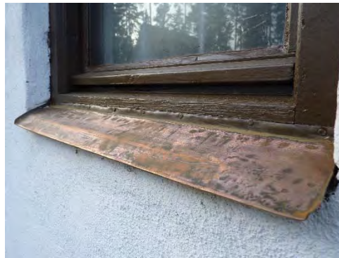
Figur 13. Fönsterblecken av koppar målades av misstag.