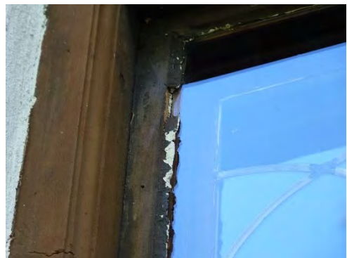
Figur 10. Fönstren var även i stort behov av omkittning.