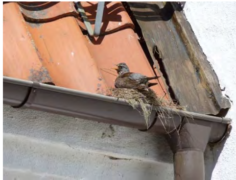
Figur 17. Täckeplåten mellan södra gaveln och vapenhuset innan åtgärd.