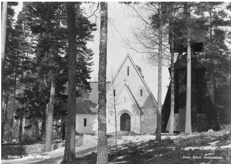
Figur 4. Äldre rykort, från 1950-talet, visar att gavelrösterna ursprungligen var målade i en ljus grå kulör. År 1974 tillkom den bruna kulör de har idag.