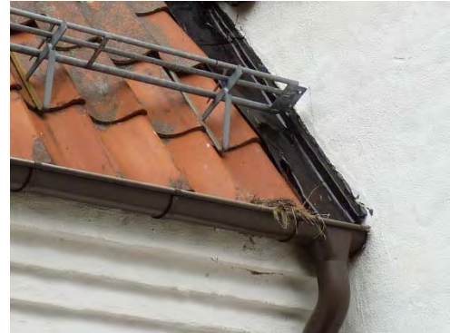
Figur 18. Plåtarna, på båda takfallen, målades i samma kulör som gavelrösternas panel.

Källarfönstret i gravkorets södra fasad var igensatt och karmen var delvis rötskadad. En ny båge tillverkades och större delen av karmens virke ersattes. Karm och båge har målats efter övriga fönster samt vid sinsemellan olika tillfällen och avviker något från varandra i kulör.