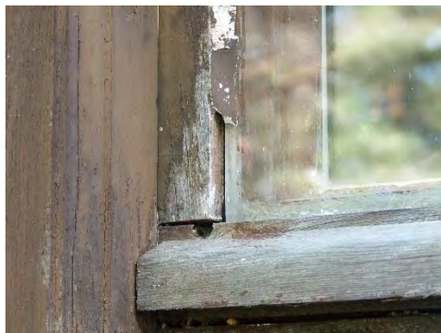
Figur 9. Detalj av fönster, både karmar och bågar var i stort behov av underhåll. Färgen var på många ställen helt försvunnen.

Fönster: Karmar och bågar rengjordes med målartvätt samt vid behov Decomax alg och mögeltvätt. Lös färg och kitt avlägsnades, trärena ytor oljades med Jupex 45, Kinesisk träolja, därefter kittades bågarna med Dana lim Linoljekitt. Fönstren målades med Wiboline Gammaldags Linoljefärg i kulör NCS S 8010-Y10R. Fönstret i gravkorets gavelröste var tidigare målat i vit kulör men fick nu samma kulör som de övriga. Dessvärre målades även de äldre fönsterblecken av koppar. Färgen togs senare bort från fönsterblecken, dock med en viss påverkan på utseendet.