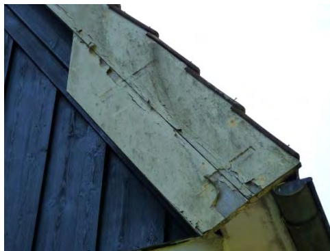
Figur 21. Färgen på vindskivor och i viss mån takfotsbrädor flagade kraftigt.

Vindskivor och takfotsbrädor: Ytorna rengjordes med målartvätt samt vid behov Decomax alg och mögeltvätt. Lös färg avlägsnades och vindskivorna grundades med Tinova utegrund därefter målades vindskivor och takfotsbrädor med Nordsjö Tinova oljetäckfärg, i kulör NCS S 0502-Y.