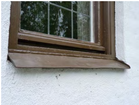
Figur 12. Samma fönster efter åtgärd.