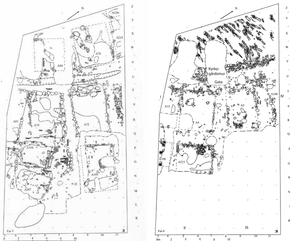
Figur 4. Lämningar från två av de av Ros (2009) föreslagna faserna. Till vänster fas 3 (ca 1000–1050) med mynthuset. Till höger fas 6 (ca 1150–1200) med gravar i norr. Ritningar av Jonas Ros, ur Ros 2009.