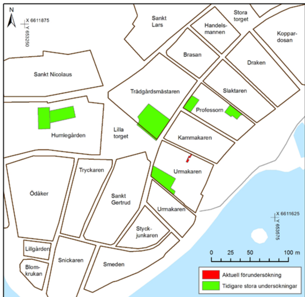
Figur 3. De gröna fälten visar lägena för de stora arkeologiska undersökningarna som har gjorts i Sigtuna. Den röda markeringen motsvarar schaktet i kvarteret Urmakaren som denna rapport berör. Skala 1:3 000. Plan: Kristina Jonsson.

Inte heller från undersökningen i kvarteret Urmakaren 1990–91 föreligger en arkeologisk rapport, men materialet har bearbetats och delvis redovisats i en bok publicerad 2009 (Ros 2009). Resultaten redovisas nedan i kommande underkapitel.