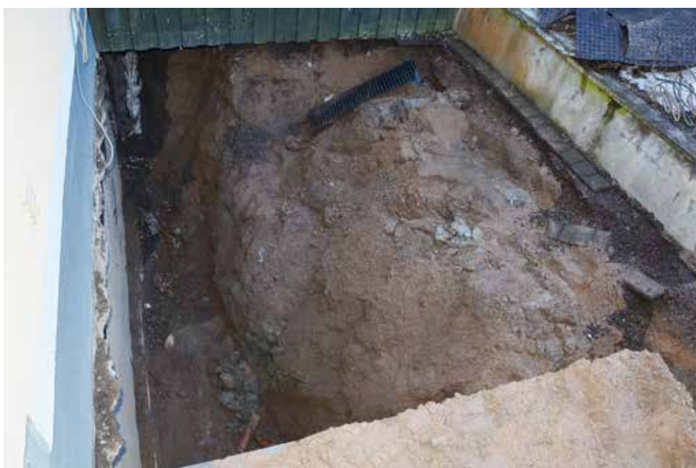
Figur 6. Schaktdelen i söder, före borttagande av all fyllning och oljetank. Foto mot SV av Kristina Jonsson.

Eftersom nedgrävningen gjordes inom ytor som tidigare grävts ur i samband med husets uppförande, nedläggande av oljetank, ledningar m.m., så påträffades endast sentida fyllnadsmassor (jfr figur 6). Dessa bestod av mellanbrun sand med inslag av lera, samt enstaka delar av tegelstenar och tegelpannor. I botten av schaktet, på ca 2–2,2 meters djup, framkom naturlig blålera.