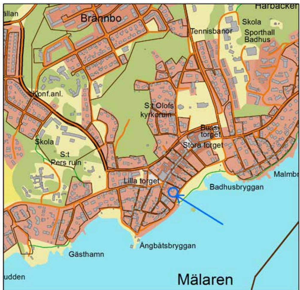
Figur 2. Läget för undersökningsytan i centrala Sigtuna (markerat med en blå ring och en pil). Utdrag ur digitala Fastighetskartan, skala 1:10 000.

I februari 2015 utförde Stiftelsen Kulturmiljövård (KM) en arkeologisk förundersökning i form av schaktkontroll i samband med markingrepp inom fastigheten Urmakaren 9 i Sigtuna stad (för tomtens läge, se figurer 1 och 2). Syftet med schaktningen var att dränera grunden längs två sidor av ett hus på en villatomt, som ligger inom fornlämningsområde Sigtuna 195:1 (stadslager). Den arkeologiska schaktkontrollen genomfördes efter beslut av Länsstyrelsen i Stockholms län (dnr 4311-38293-2014), och utfördes av Kristina Jonsson från KM. Uppdraget beställdes och bekostades av fastighetsägaren Magnus Sandström.