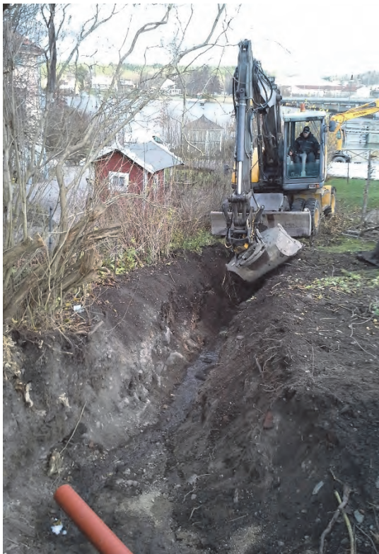
Figur 4. Schaktet. Till vänster ses raseringslagret från huslämningen från 1800–1900-tal. Fotograferat från norr av Jonas Ros.