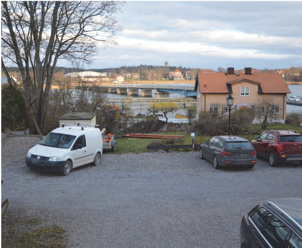
Figur 3. Översikt över undersökningsområdet. Topografin sluttade ned mot Strängnäsfjärden som ses i bakgrunden. Fotograferat från söder av Jonas Ros.