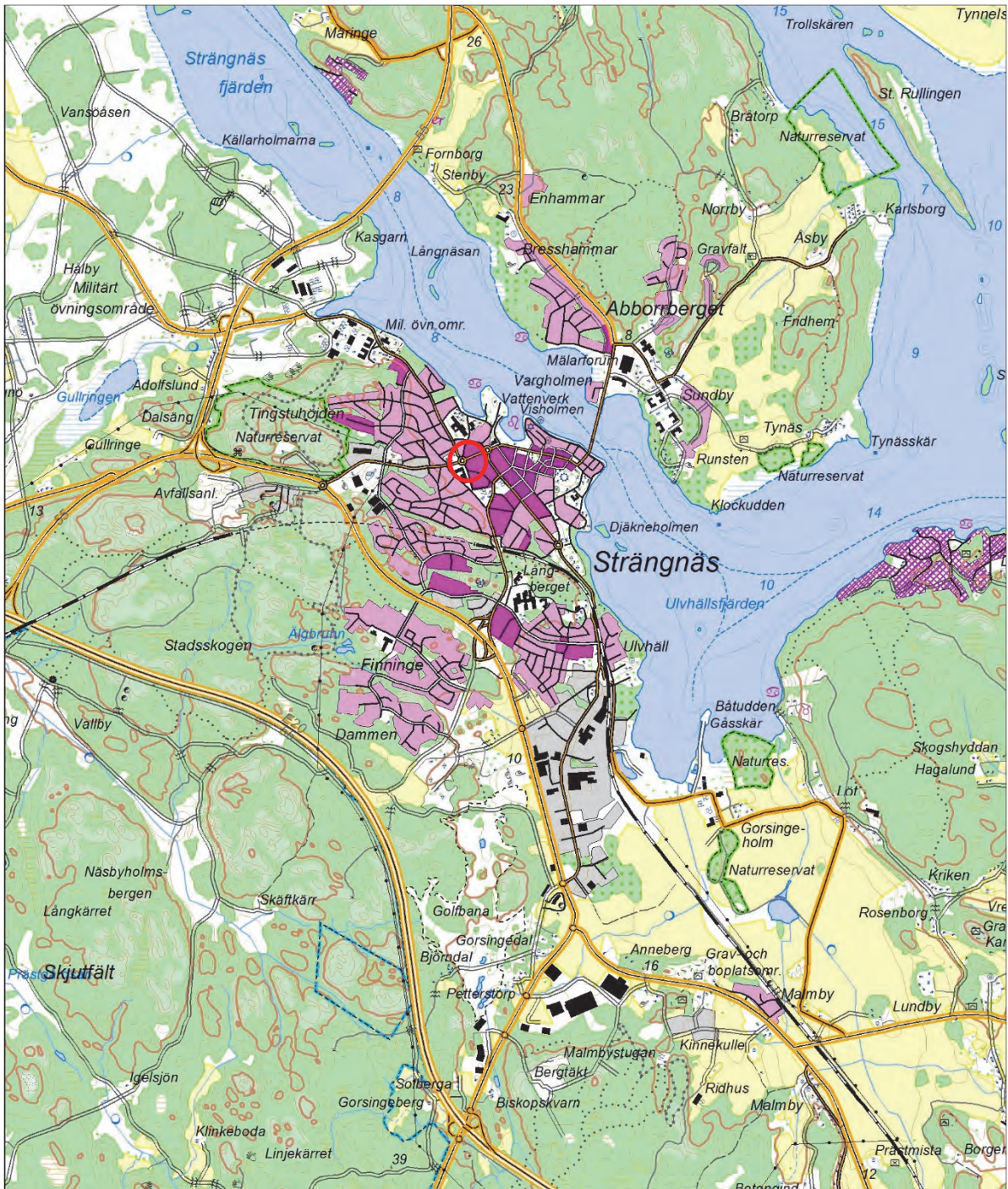
Figur 1. Undersökningsplatsens läge, markerat med en ring. Utdrag ur Terrängkartan. Skala 1:50 000.