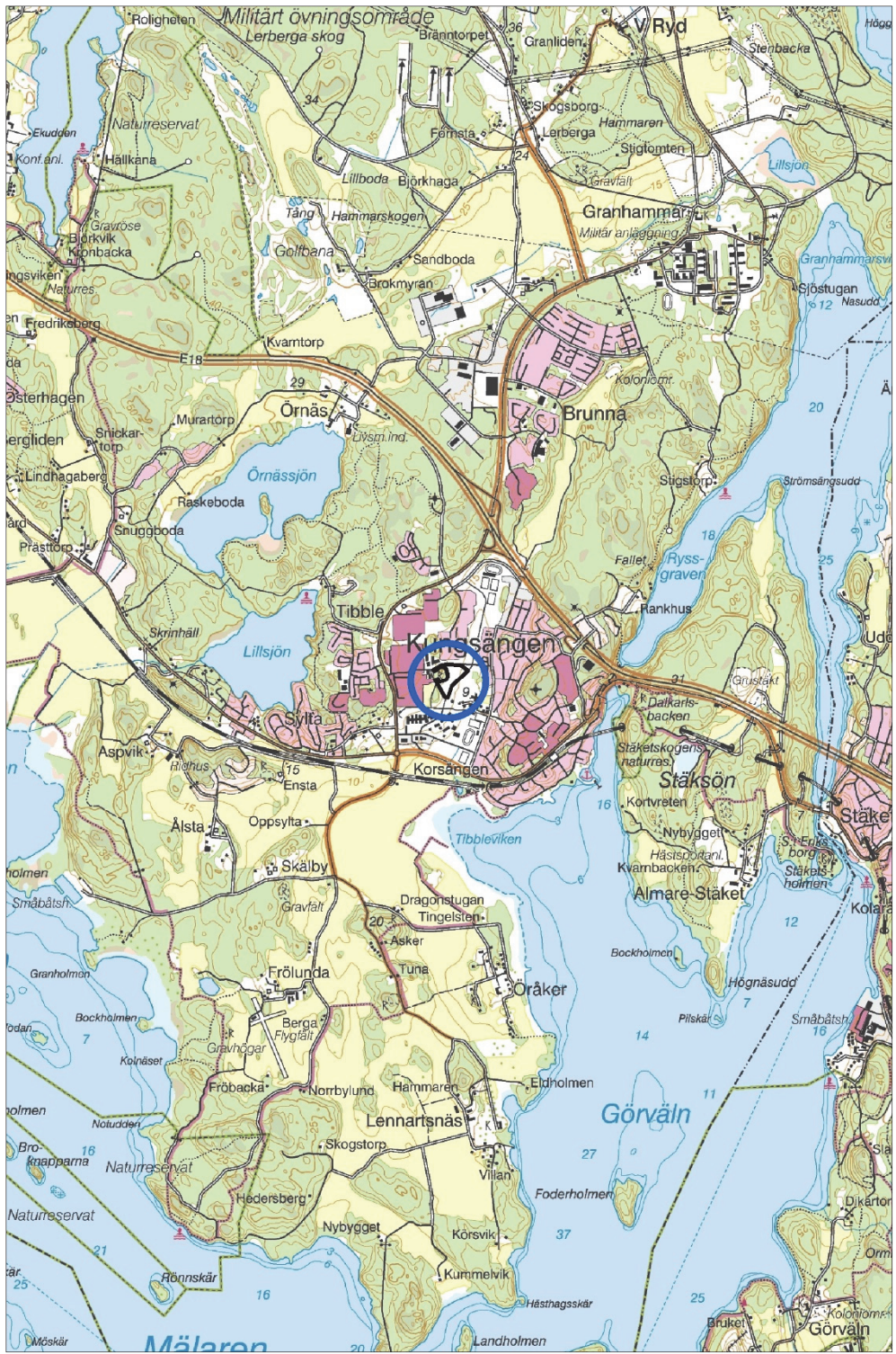
Figur 1. Utredningsområdet markerat med en svart linje och en blå ring. Utsnitt ur digitala terrängkartan. Skala 1:50 000.