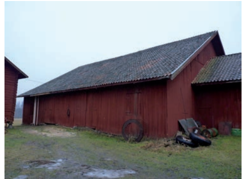
Figur 6. Östra fasaden, sedd från nordöst.