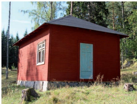
Figur 19. Hus 40 efter utfört målningsarbete.

Taktassar, takfot och fasadernas panel målades med röd slamfärg.