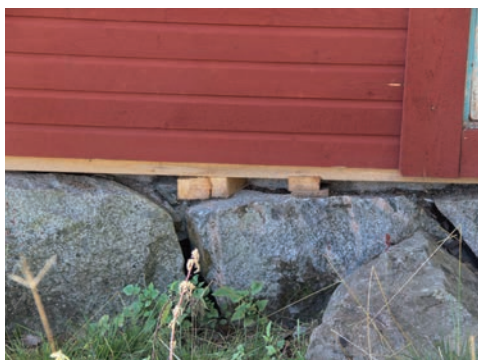
Figur 21. När fasaderna fått färg syns tydligt avsaknaden av fotbrädor över sockeln.