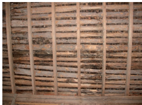
Figur 10. Västra takfallets ursprungliga undertak, vissa fuktskador synliga.