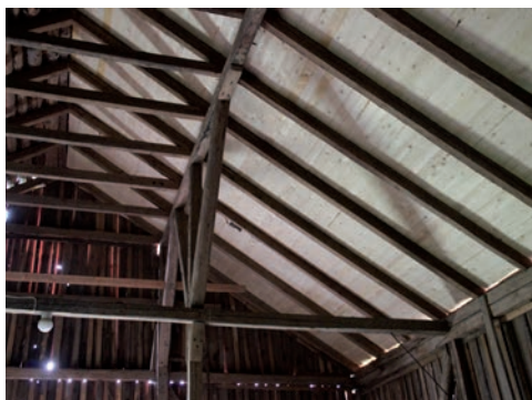
Figur 11. Del av västra takfallet efter åtgärd.

Vid omläggningen plockades takteglet ned och tillvaratogs, befintligt undertak av pärt och brädor revs. Istället lades ett nytt undertak av råspont, täckt med takpapp. På detta lades nytt enkupigt lertegel. Innan omläggning åtgärdades några av taktassarna genom att skadat virke avlägsnades och nytt virke skarvades i. Även fotbräda samt vindskivor och vattbräddor ersattes på västra takfallet.