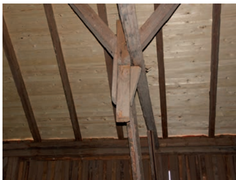
Figur 12. Stolpen är inte åtgärdad.