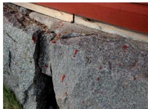
Figur 22. Visst färgspill på sockeln.