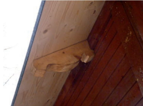
Figur 18. Ny takfot och ny taktass, båda omålade.

Taktassar, takfot och fasadernas panel målades med röd slamfärg.