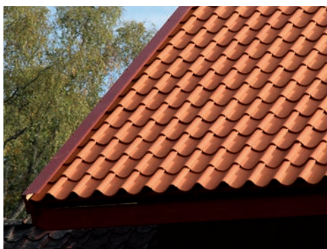
Figur 16. Efter åtgärd, överligger i rödmålade plåt.