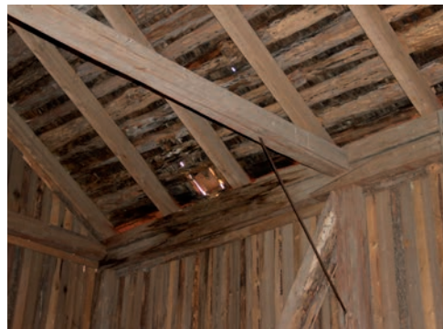
Figur 8. Exempel på skada i västra takfallet.

Byggnaden har stolpverkskonstruktion med dubbla hammarband. Sadeltaket bärs av en takstomme med sidoåsar, vilandes på rader med tre stolpar, en mot vardera sidoås och en där den ursprungliga östra ytterväggen tidigare fanns. En av stolparna som bär den västra sidoåsen, nära mitten av byggnaden, har någon gång kapats. Stommen vilar på plintar av natursten samt grundstenar under stolparna. Fasaden har stående slät panel, delvis av kilsågade bräder. Panelen är målad med Falu rödfärg. På taket ligger ett undertak av glesa bräder och däröver pärt. Pärttakets har senare täckts med enkupigt lertegel.