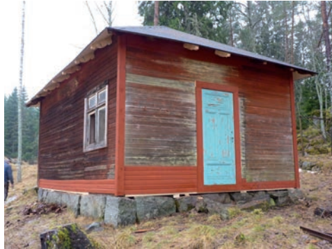
Figur 17. Hus 40 efter 2013 års åtgärder.

Vid åtgärder 2013 lades nytt tak, skadad panel i fasad ersattes liksom skadad takstomme. Den nya panelen målades innan montering med resultatet att den kulörmässigt bröt av tydligt mot panelen i övrigt. Taktassarna, vilka utgör ändarna av takstommens bjälkar, samt takfoten, var omålade sedan åtgärderna 2013.