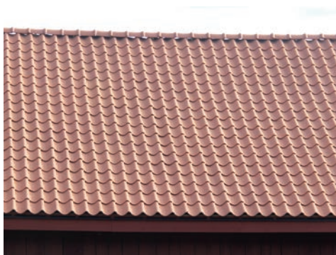
Figur 14. Detalj av västra takfallet efter åtgärd.