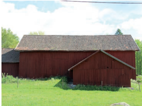
Figur 5. Trösklogen innan åtgärd, sedd från väster.

Trösklogen är sammanbyggd med hus 28 mot norr och hus 30 mot väster samt tidigt tillbyggd mot öster. I tillbyggnaden mot öster syns fortfarande de äldre, rödfärgade taktassarna.