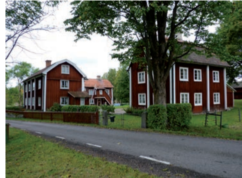
Figur 2. Vägen in mot Bråfors, från öster.