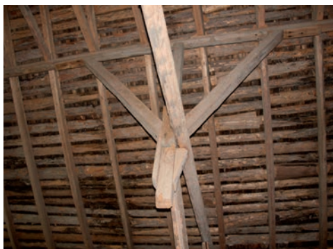
Figur 9. Kapad stolpe.

Byggnaden har stolpverkskonstruktion med dubbla hammarband. Sadeltaket bärs av en takstomme med sidoåsar, vilandes på rader med tre stolpar, en mot vardera sidoås och en där den ursprungliga östra ytterväggen tidigare fanns. En av stolparna som bär den västra sidoåsen, nära mitten av byggnaden, har någon gång kapats. Stommen vilar på plintar av natursten samt grundstenar under stolparna. Fasaden har stående slät panel, delvis av kilsågade bräder. Panelen är målad med Falu rödfärg. På taket ligger ett undertak av glesa bräder och däröver pärt. Pärttakets har senare täckts med enkupigt lertegel.