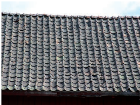
Figur 7. Detalj av västra takfallet innan åtgärd.