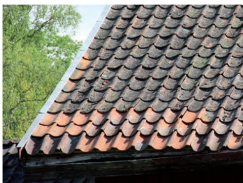
Figur 15. Innan åtgärd, sekundärt tillkommen överligger av galvad omålade plåt i korta längder.