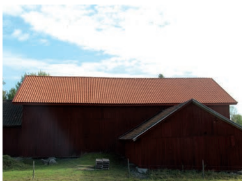
Figur 13. Tröskelogen sedd från väster, efter åtgärd.