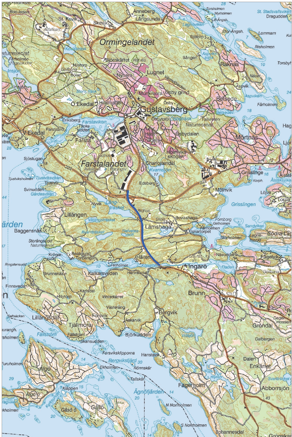
Figur 1. Utredningsområdet markerat med en blå linje. Utsnitt ur digitala terrängkartan. Skala 1:50 000.