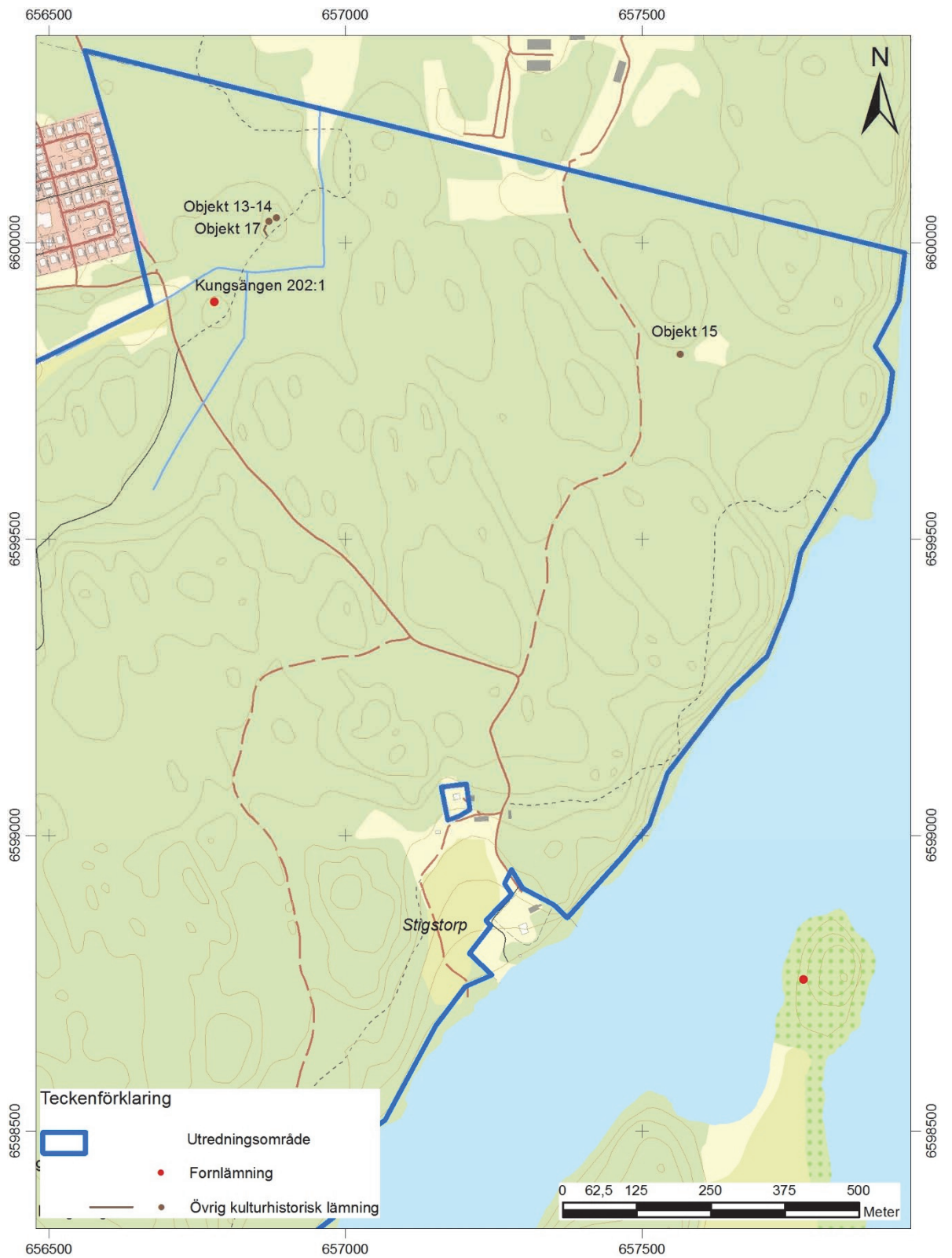
Figur 3. Utredningsresultatet, områdets nordöstra halva. Utsnitt ur digitala fastighetskartan. Skala 1:10 000.