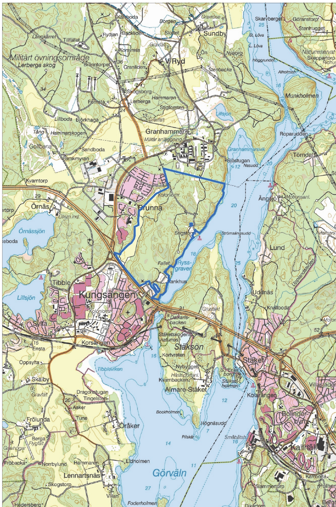
Figur 1. Utredningsområdet markerat med en blå linje. Utsnitt ur digitala terrängkartan. Skala 1:50 000.