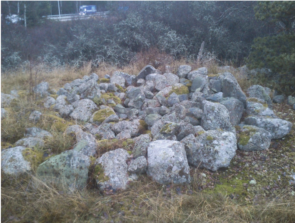
Figur 4. Röset Kungsängen 92:1 sett från öster.

gravhög. Uppgifterna om stenåldersfynd och gravhögen antyder ett möjligt tidsdjup från stenålder till järnålder för eventuella boplatser, eller andra lämningar.