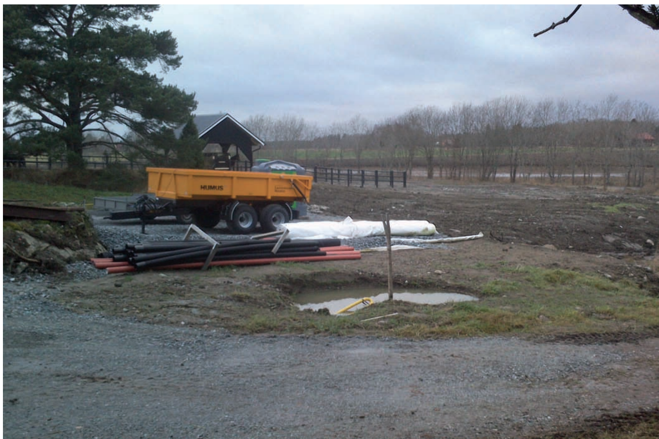
Figur 2. Platsen för det planerade avloppet. Utsikt mot det vattendrag som flyter fram norr om förundersökningsområdet. Fotograferat från sydöst, intill platsen för hållristningen Boglösa 98:2, av Christian Gatti.

Förundersökningen, som ägde rum innan ordinarie avloppsschaktning, utfördes av Christian Gatti den 9 december 2015. Beslut i ärendet är fattat av Länsstyrelsen i Uppsala län med stöd av 2 kap 13 § i Kulturmiljölagen (1988:950), (1st dnr: 431-4788-2015). Förundersökningen beställdes och bekostades av fastighetsägaren.