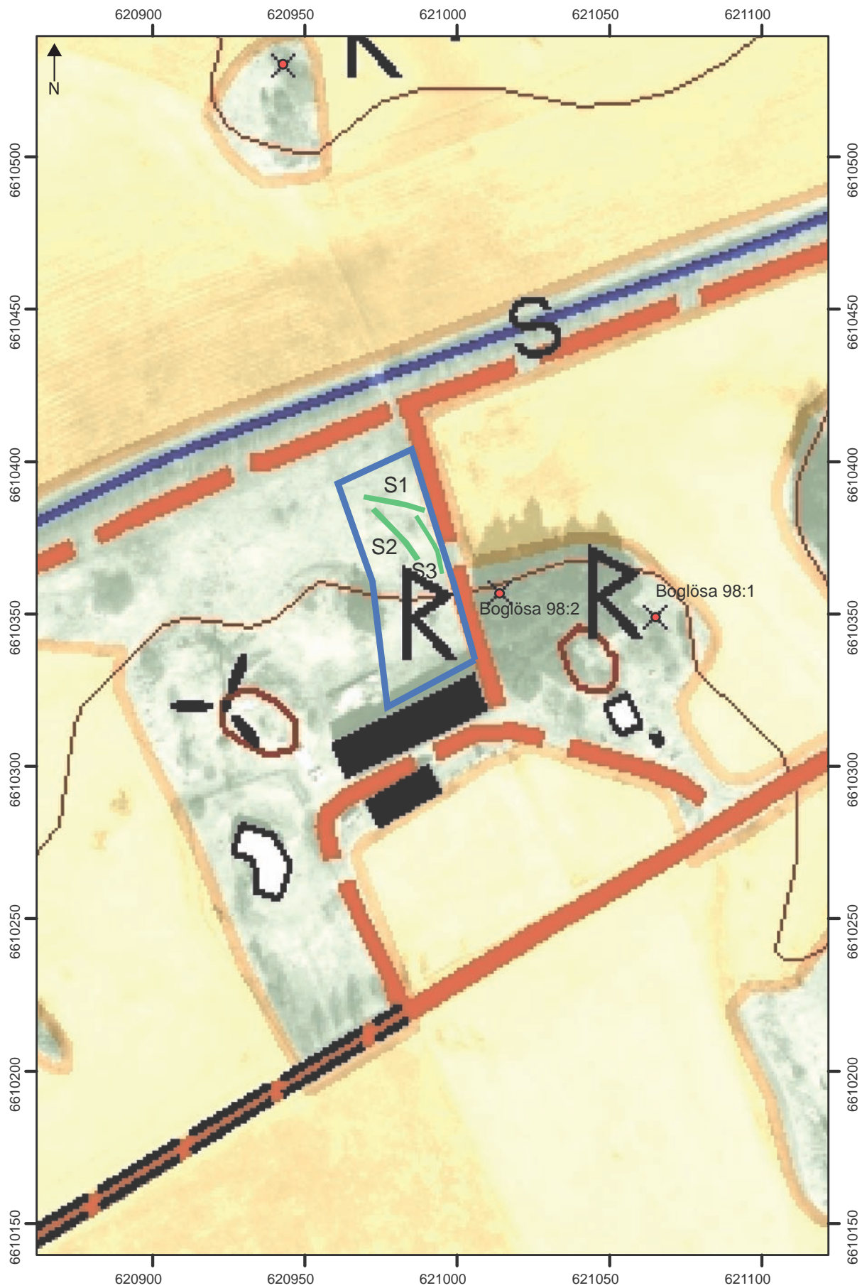
Figur 5. Schaktplan. De grävda schakten, S1–3, är markerade med gröna linjer och förundersökningsområdet med en blå linje. Mätning inlagd på den digitala Fastighetskartan. Skala 1:2 000.