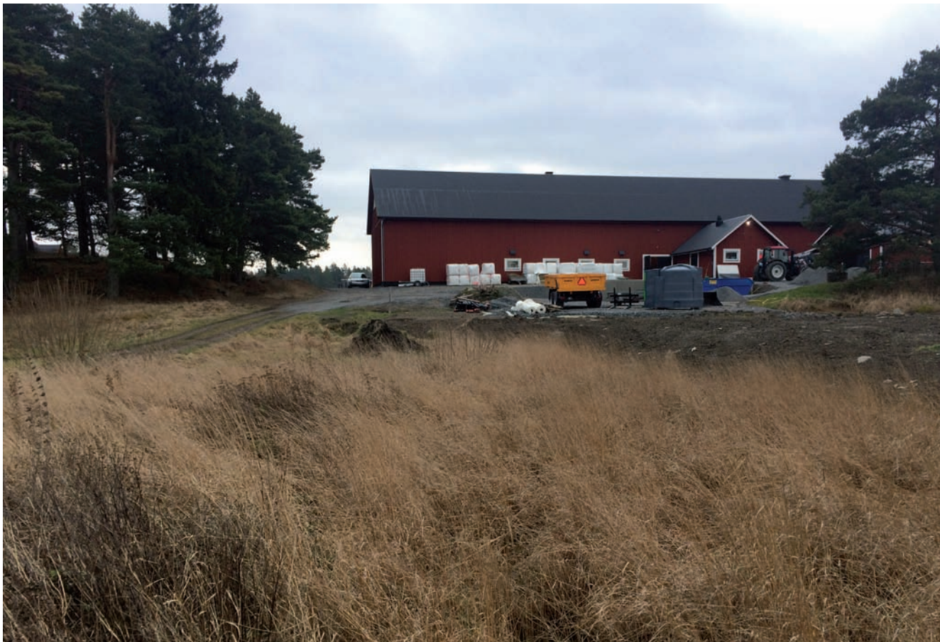
Figur 4. Förundersökningsområdet fotograferat från norr av Christian Gatti.

Fältarbetet utfördes av Christian Gatti och rapporten har sammanställts av Anna-Lena Hallgren.