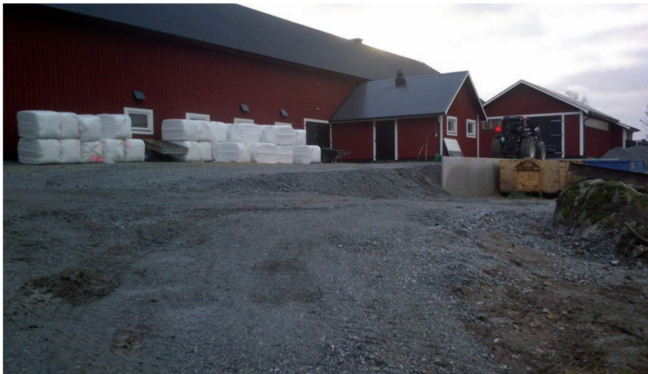
Figur 6. Den södra delen av förundersökningsområdet täcktes av bärlager. Foto från nordost av Christian Gatti.

Schaktningen resulterade inte i något av antikvariskt intresse.